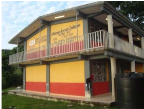
Fotografía 1 ‘el albergue Antonio Caso’