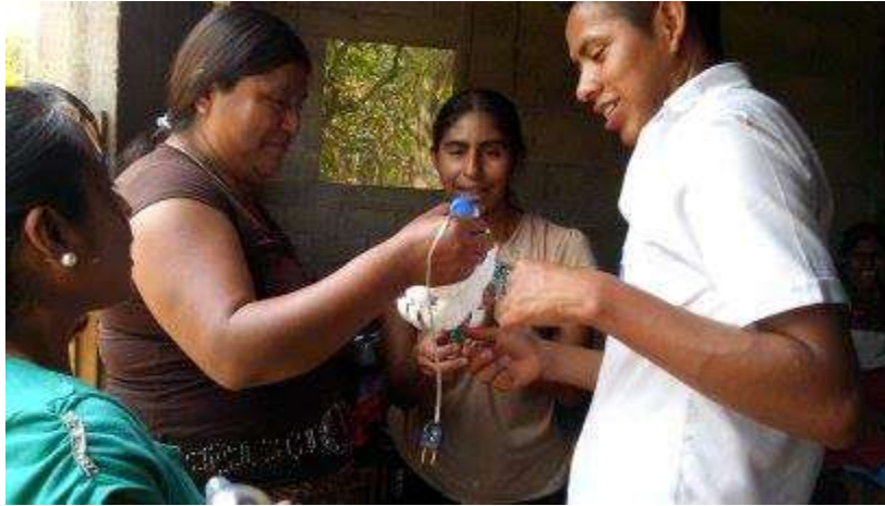
Anexo VI: elaboración de las lámparas mágicas, se auxilió en la instalación de los cables para la iluminación de los mismos.