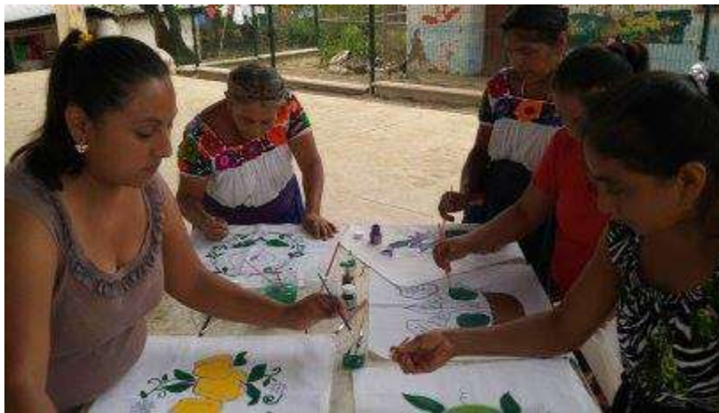
Anexo VII: decoración de la tela por parte de cada una de las integrantes del grupo de mujeres que participaron en el proyecto.