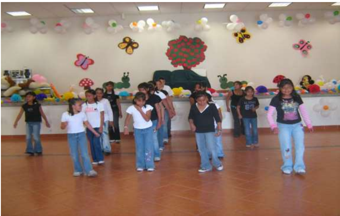
Foto 9. Baile en grupo