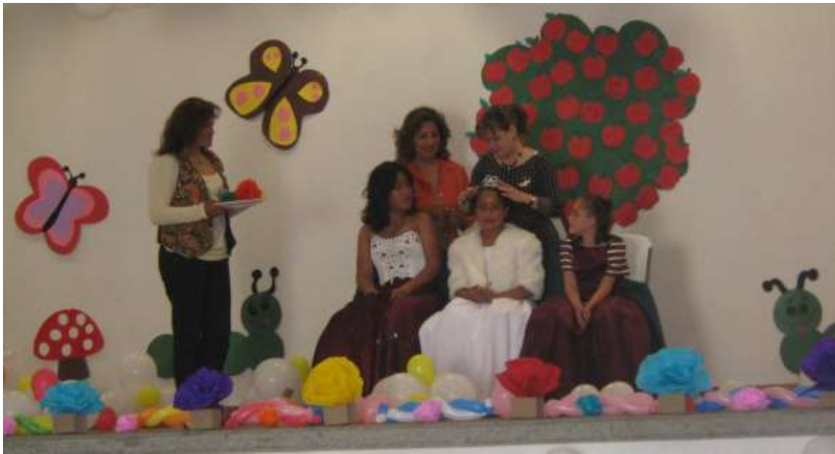
Foto 14. Coronación.