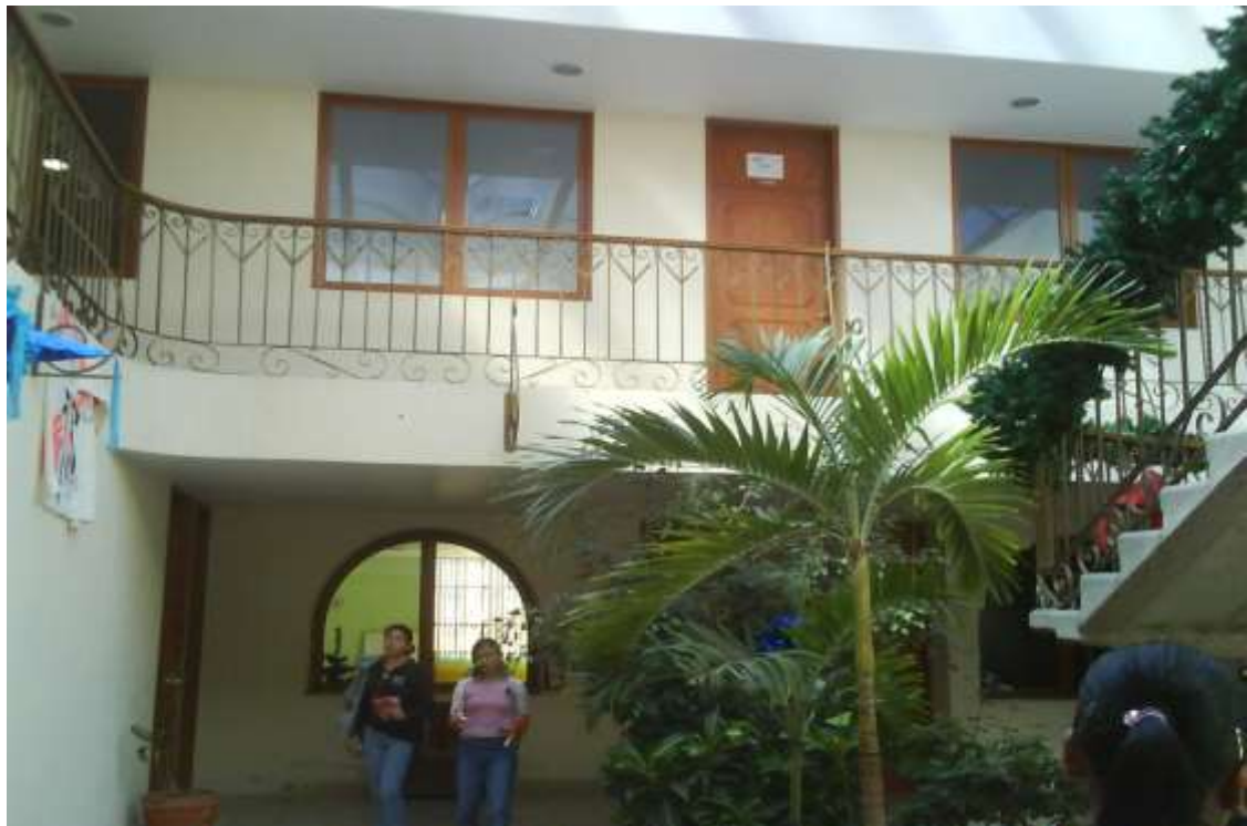
Fotografía 5. Vista de las recamaras