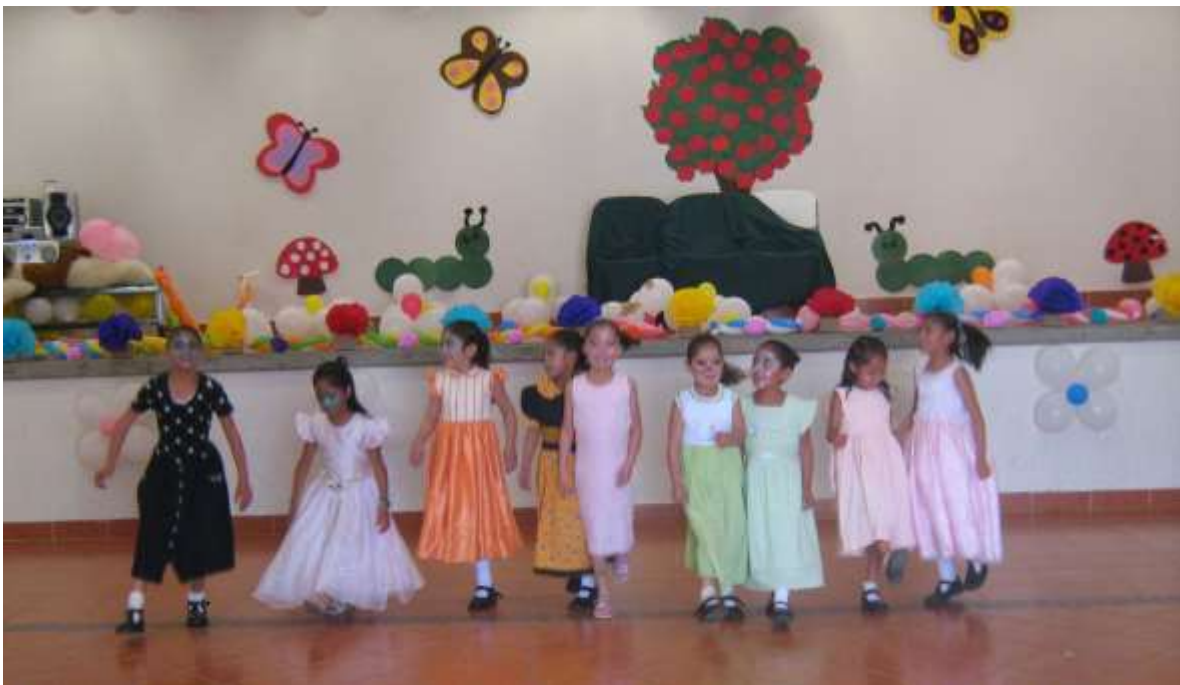
Foto 11. Baile en grupo.