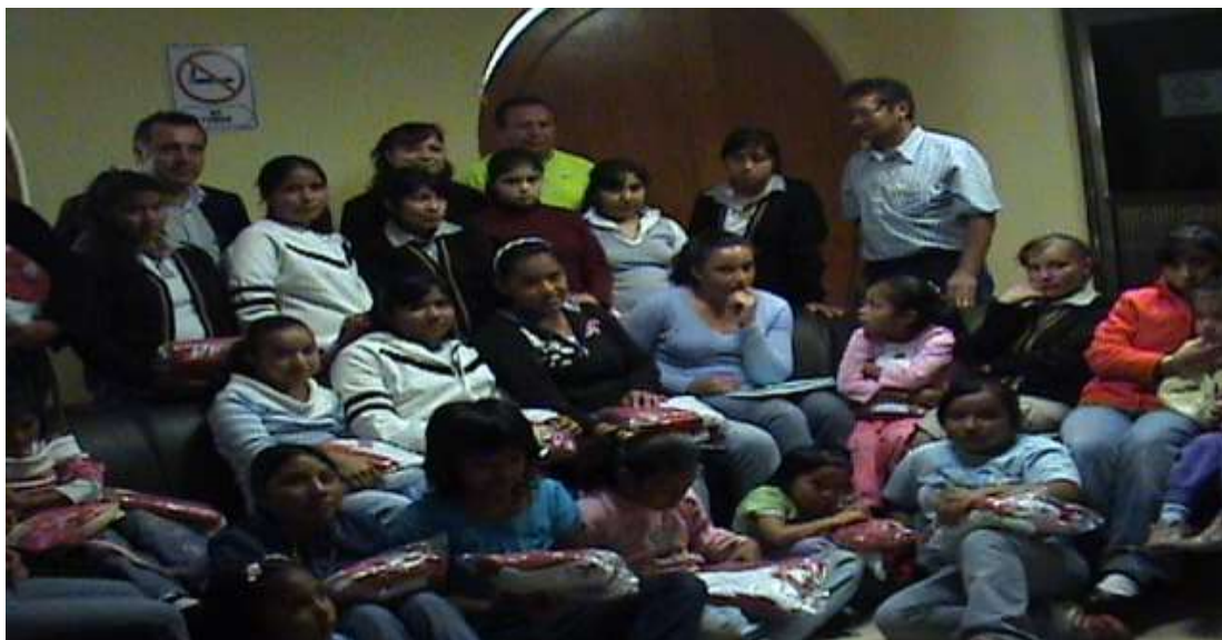
Fotografía 1. Niñas residentes