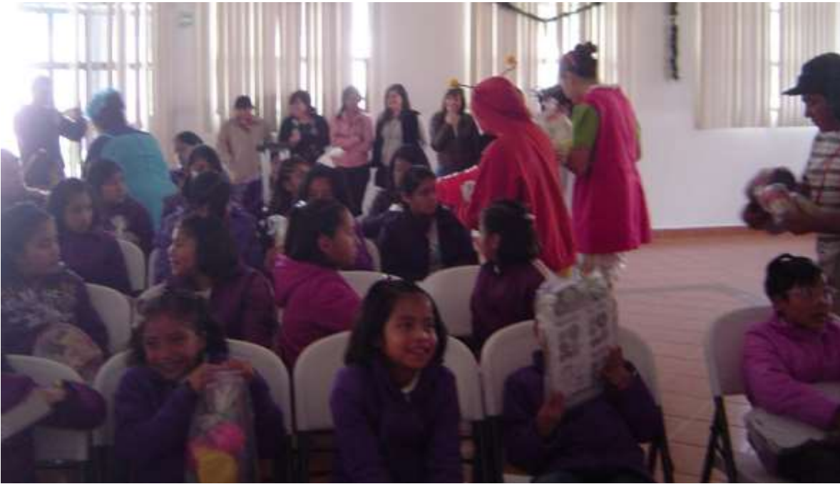
Foto 16. Evento final.