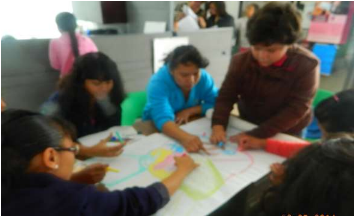
Foto 8. Silueta del aprecio.