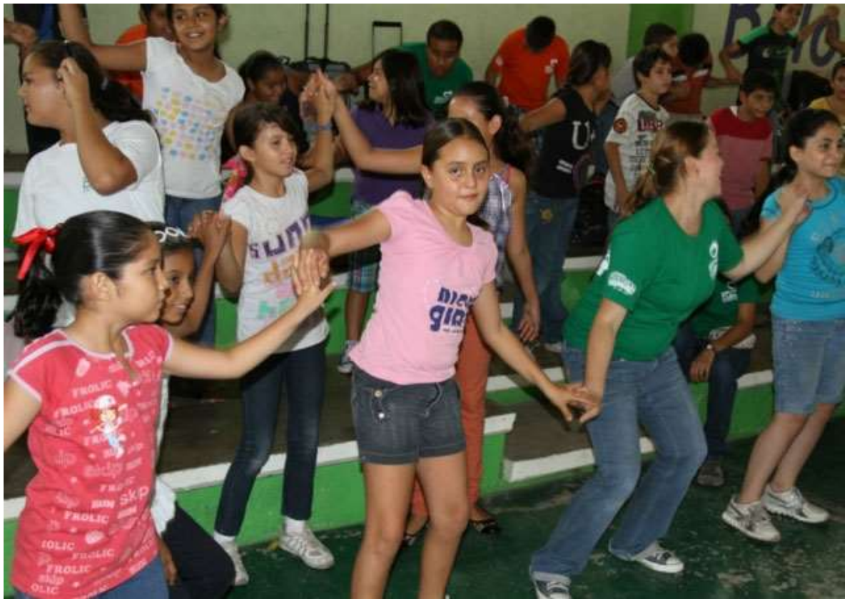
Foto 6. Abrazos musicales.