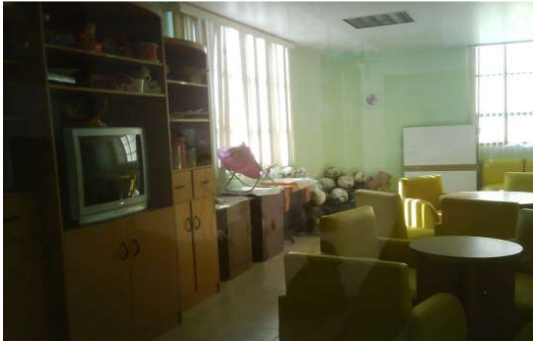
Fotografía 4. Sala de manualidades.