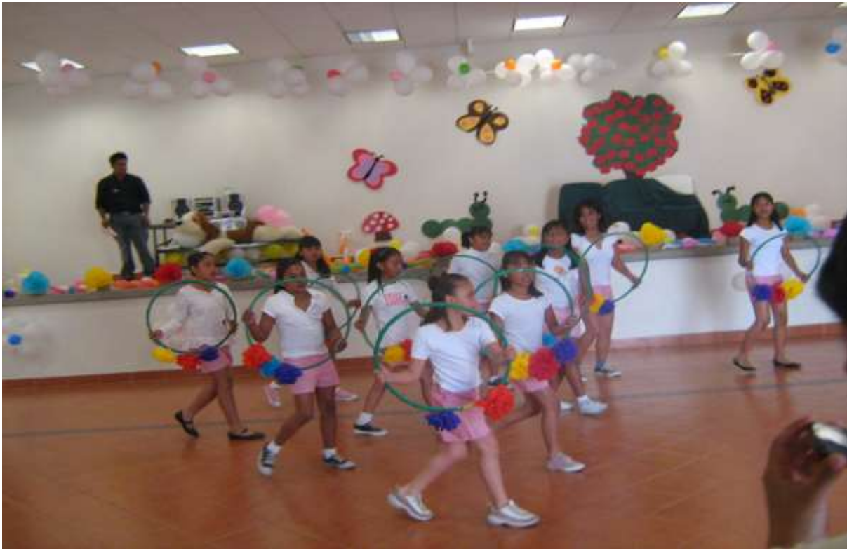
Foto 12. Baile en grupo