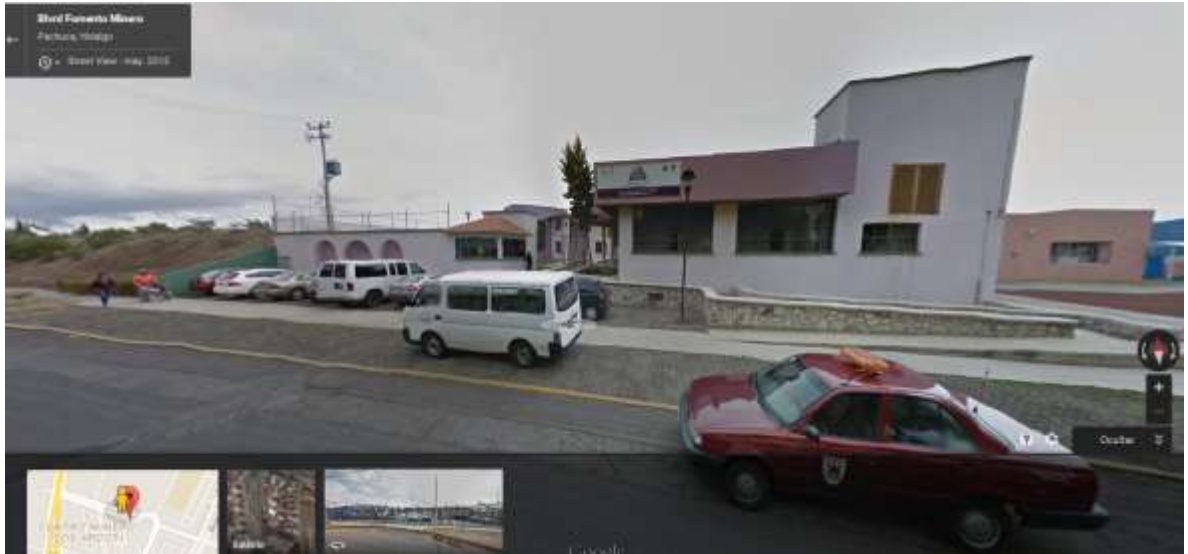
Fotografía 2. Casa vista desde la calle