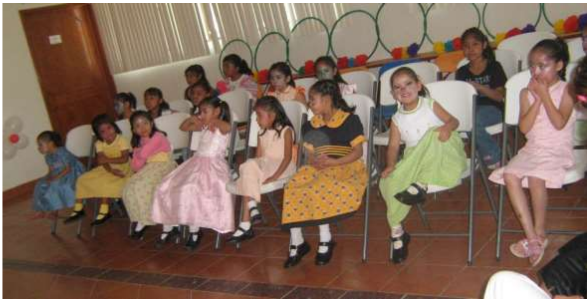
Foto 15. Niñas