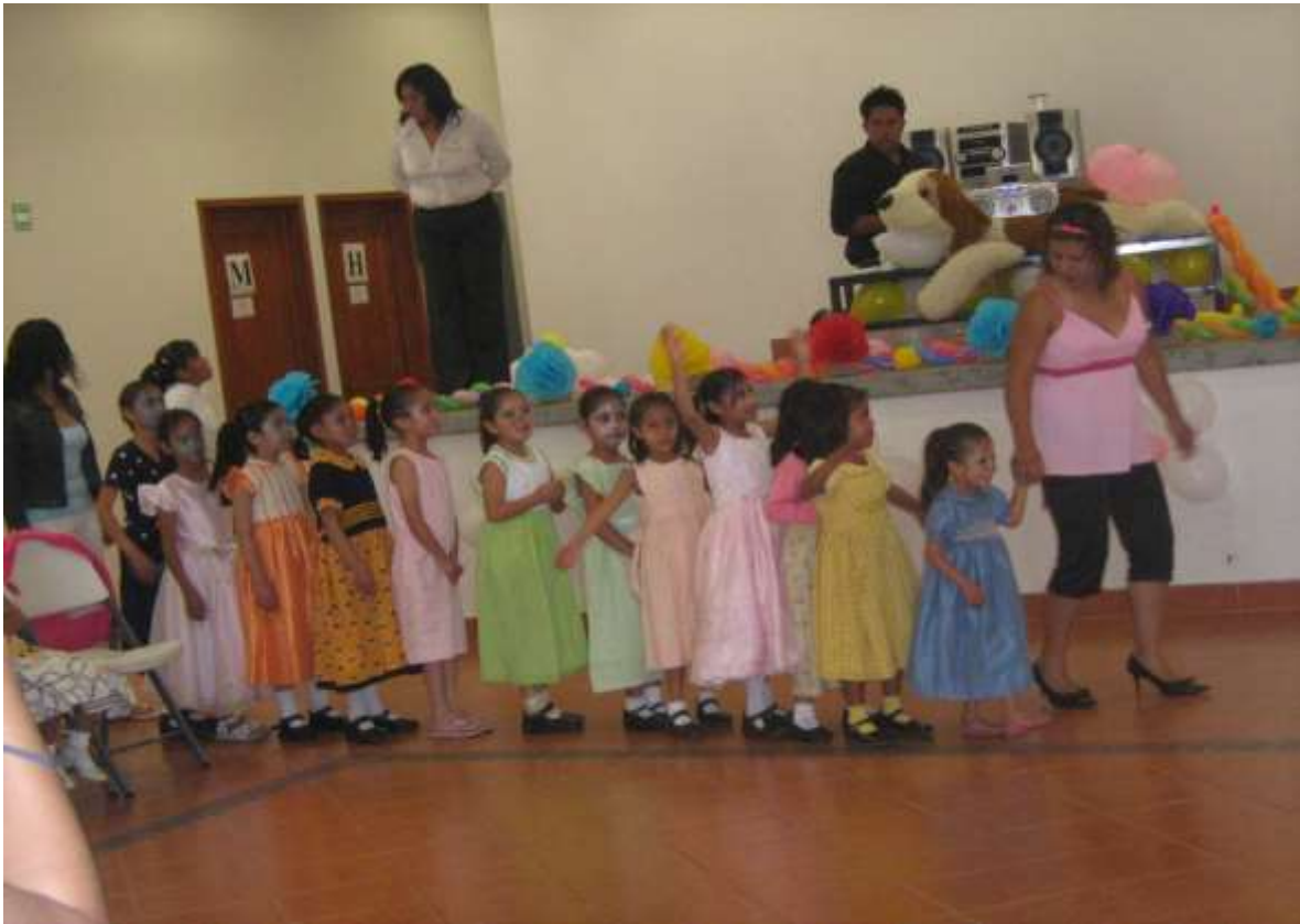
.Foto 10. Baile en grupo