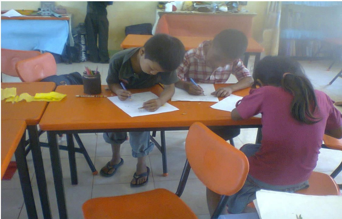
Anexo 17. Alumnos en la redacción de los textos en hojas blancas para la antología.

Consumir frutas y verduras es mucho más barato, además de todos beneficios que brindan al cuerpo, sin mencionar que nos ayudan a tener una mejor salud. Los estudios demuestran que el índice de vida de las personas que consumen de manera excesiva productos chatarra es menor al de una persona que se alimenta sanamente.