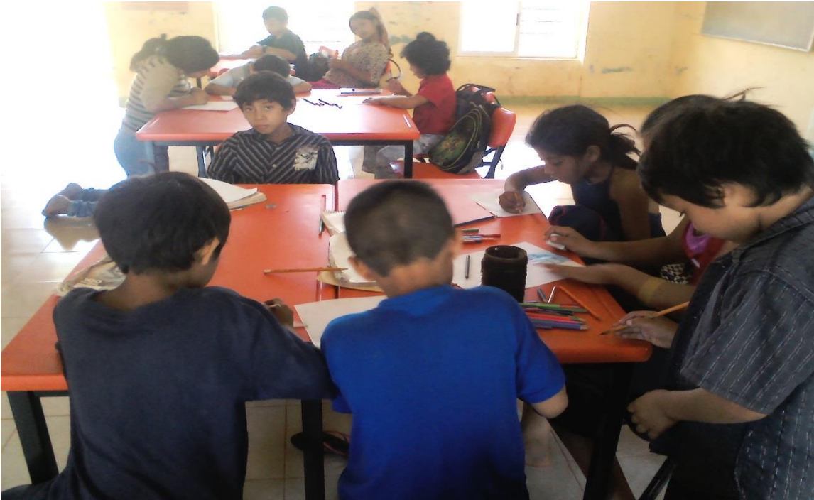
Anexo 20. Alumnos trabajando en equipo.