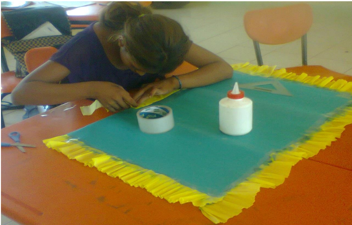
Anexo 23. Alumna decorando los carteles con los textos propios de la localidad.