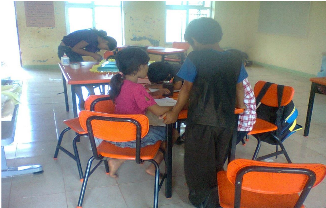
Anexo 24 Alumnos en los últimos detalles para presentar a la comunidad sus trabajos.