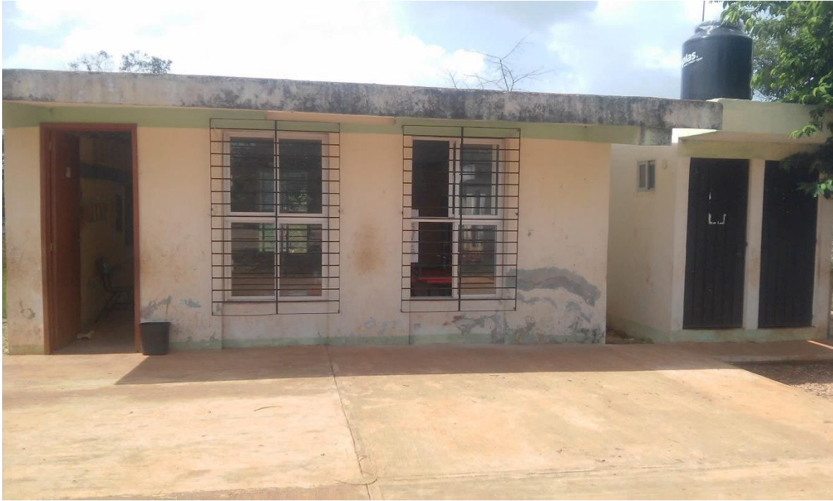
ANEXO 5. Escuela “VICTORIANO HUERTA”. Chunhuaymil, Oxkutzcab.