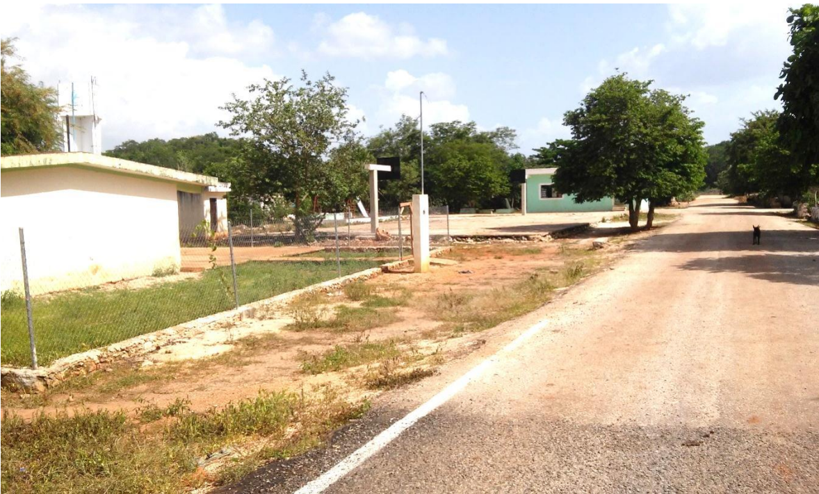
ANEXO 4. Chunhuaymil, Oxkutzcab.