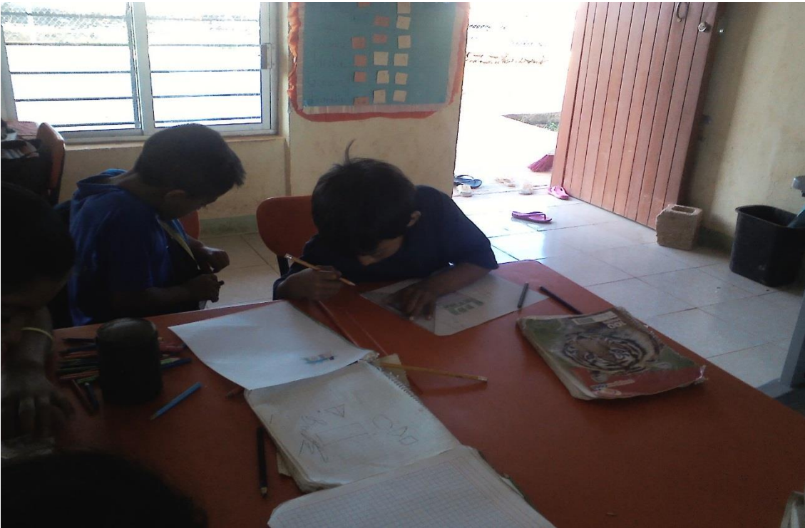
Anexo 18. Alumnos redactando los textos de su comunidad.