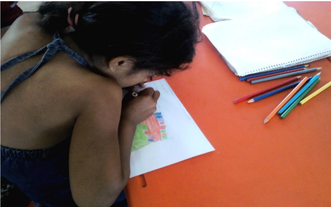
Anexo 21. Alumno realizando dibujos alusivos a los textos de la antología.