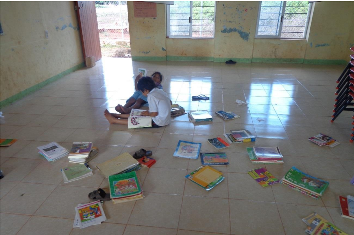
Anexo 19. Alumnos revisando textos en los libros de la biblioteca.