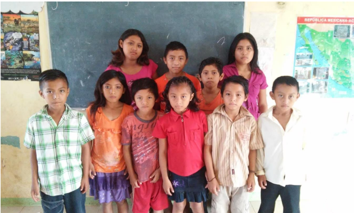
ANEXO 6. Alumnos de la escuela “Victoriano Huerta” de Chunhuaymil, Oxkutzcab.