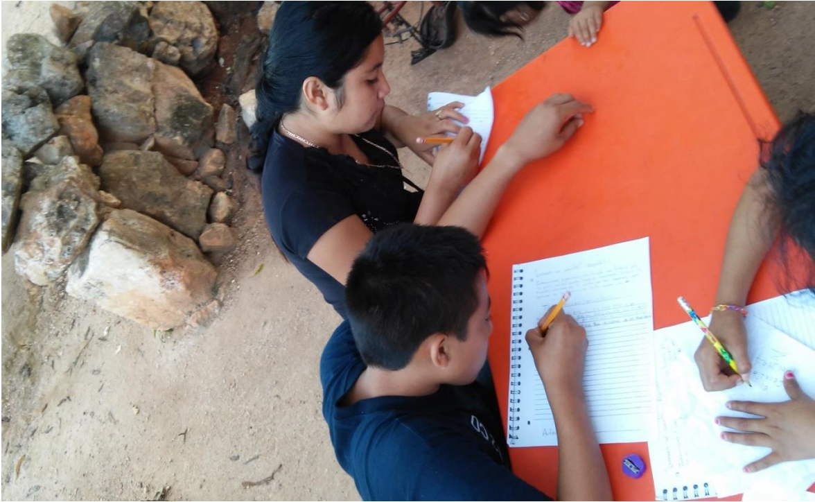
ANEXO 3. Alumnos realizando actividades de español.