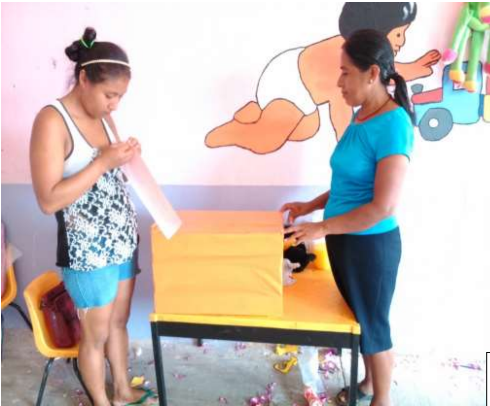
Forrando las cajas para la base del lavabo de manos.