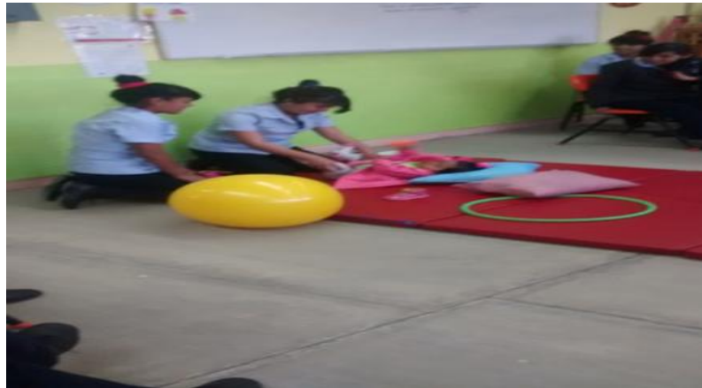
Imagen 2 de alumnas de Puericultura realizando ejercicios de estimulación temprana con niñas de 2 años de la comunidad de Tepetitlán con materiales como: pelota, cojines, aros; para desarrollar la psicomotricidad gruesa y lenguaje.

disponibilidad de las alumnas los trabajos en el curso taller no habrían alcanzado los propósitos establecidos. Lo que me permite visualizar por otro lado, la integración de las alumnas como grupo y el desarrollo del nivel cognitivo con el reforzamiento temas ya vistos en los submódulo. A las alumnas permitió apropiarse claramente conceptos como: Pedagogía, juego, estimulación temprana, materiales didácticos.