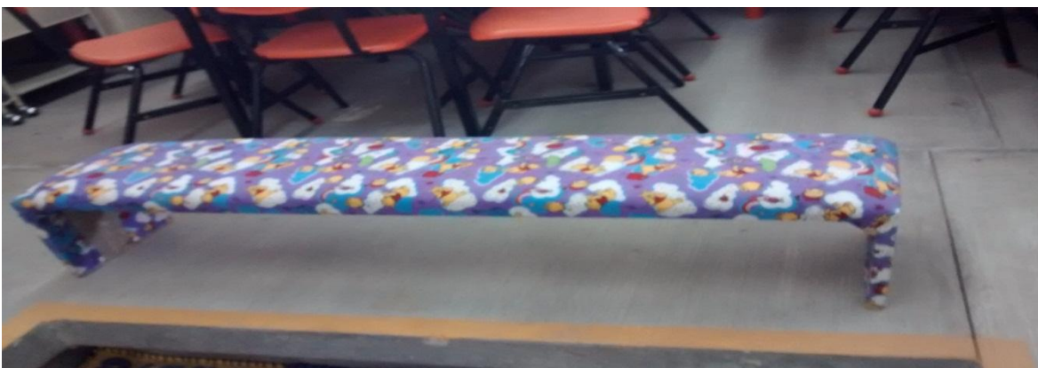
Tabla de equilibrio

En esta tabla los niños desarrollan la coordinación para establecer el equilibrio para caminar. Con ayuda de un adulto los niños van pasando manteniendo la coordinación.