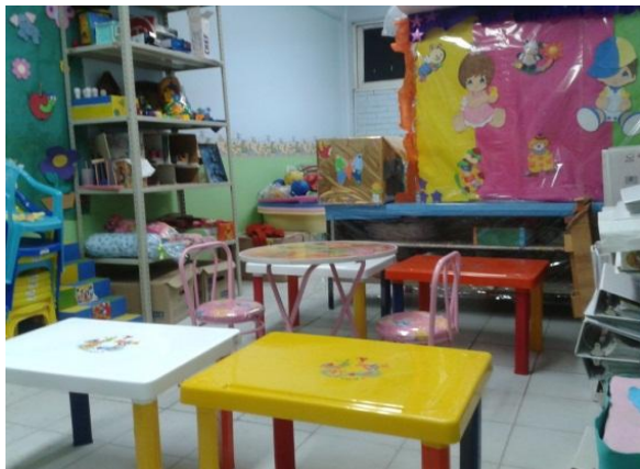
Imagen 1. Laboratorio de Puericultura

En efecto, se retoma la importancia de las prácticas en todos los submódulos de Puericultura, establecidas por los programas y las guías didácticas de cada submódulo, donde también proponen un método de evaluación para desarrollar habilidades propias de los módulos profesionales; al docente le permite evaluar las competencias de los alumnos. Estas evaluaciones son importantes para los docentes donde se percibe que los alumnos desarrollan habilidades en los talleres y laboratorios acompañados de materiales didácticos, como una actividad final usando técnicas y procedimientos de acuerdo a las competencias de las alumnas.