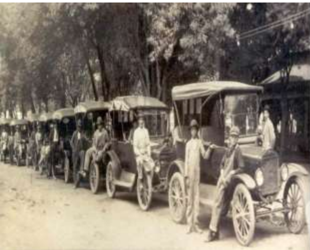
Sitio de Autos frente al Jardín

Museo de Datos Históricos de Tulancingo, Hidalgo