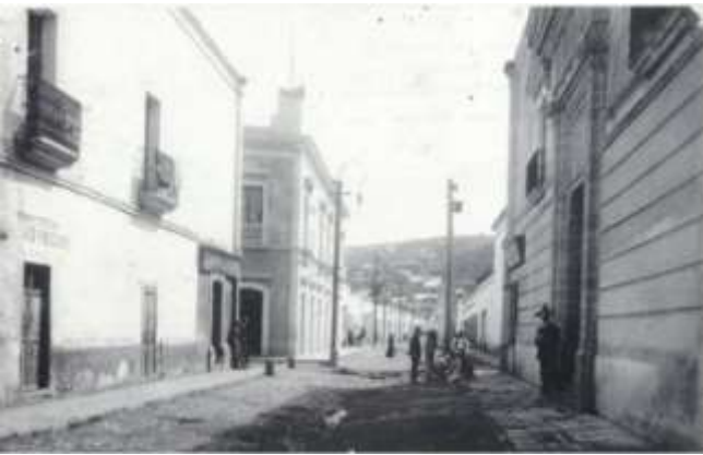
Calle 1ra de Mayo y Cuauhtémoc

Museo de Datos Históricos de Tulancingo, Hidalgo