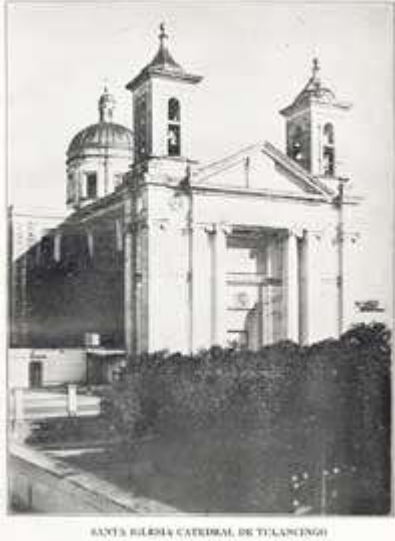
Catedral metropolitana de Tulancingo de Bravo