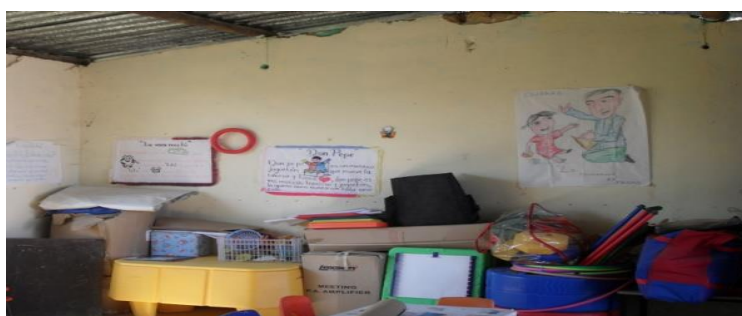
FOTO NO. 7 MATERIAL DIDÁCTICO DEL PREESCOLAR