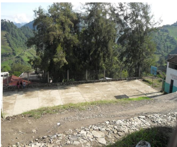
Cancha de usos múltiples