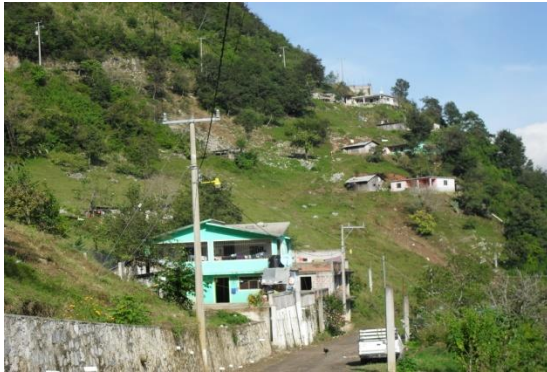
Entrada a la comunidad