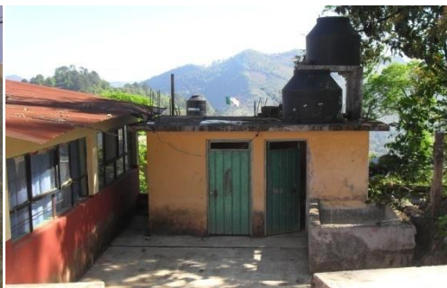
FOTO NO.2 BAÑOS