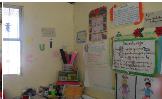
FOTOS NO. 5 Y 6 MOBILIARIO DEL AULA DE EDUCACIÓN INICIAL