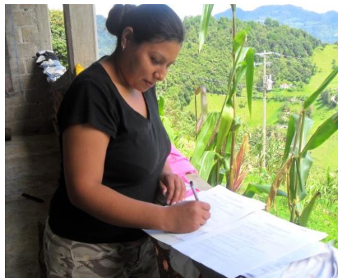
Aplicación de entrevistas