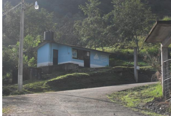
Casa de Salud