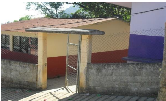
FOTO NO.1 ENTRADA A LA ESCUELA