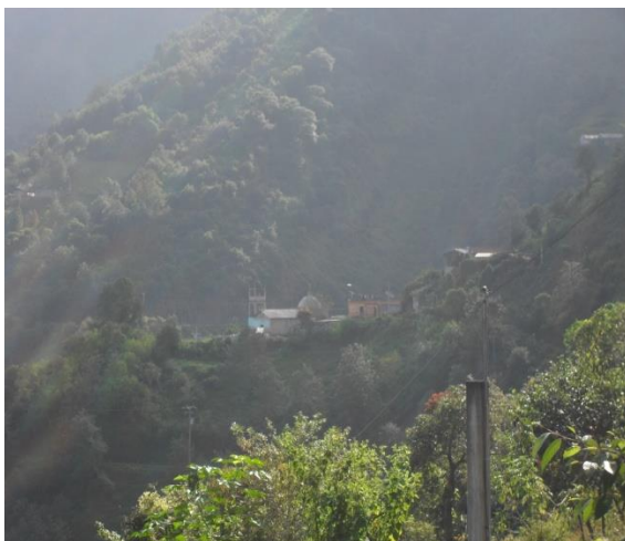
Iglesia de la comunidad