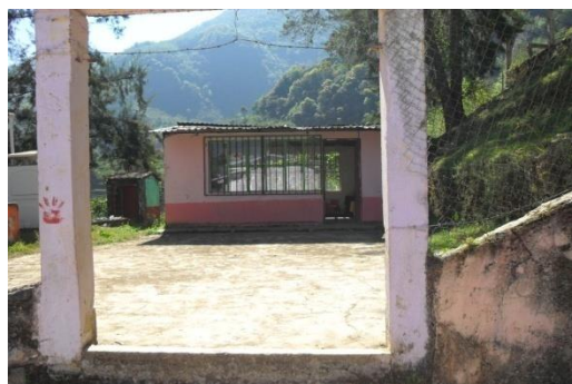
FOTO NO.3 PATIO Y AULA DE EDUCACION INICIAL