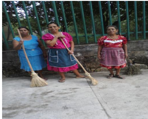
En esta imagen se muestra la galera limpia