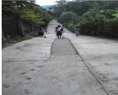
Las señoras barriendo las calles de la comunidad

En estas imágenes se puede observar un ambiente comunitario libre de basura y suciedad.