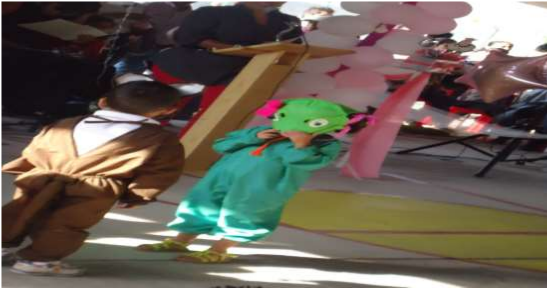
Los niños escenificando el cuento el grufalo, con sus disfraces.