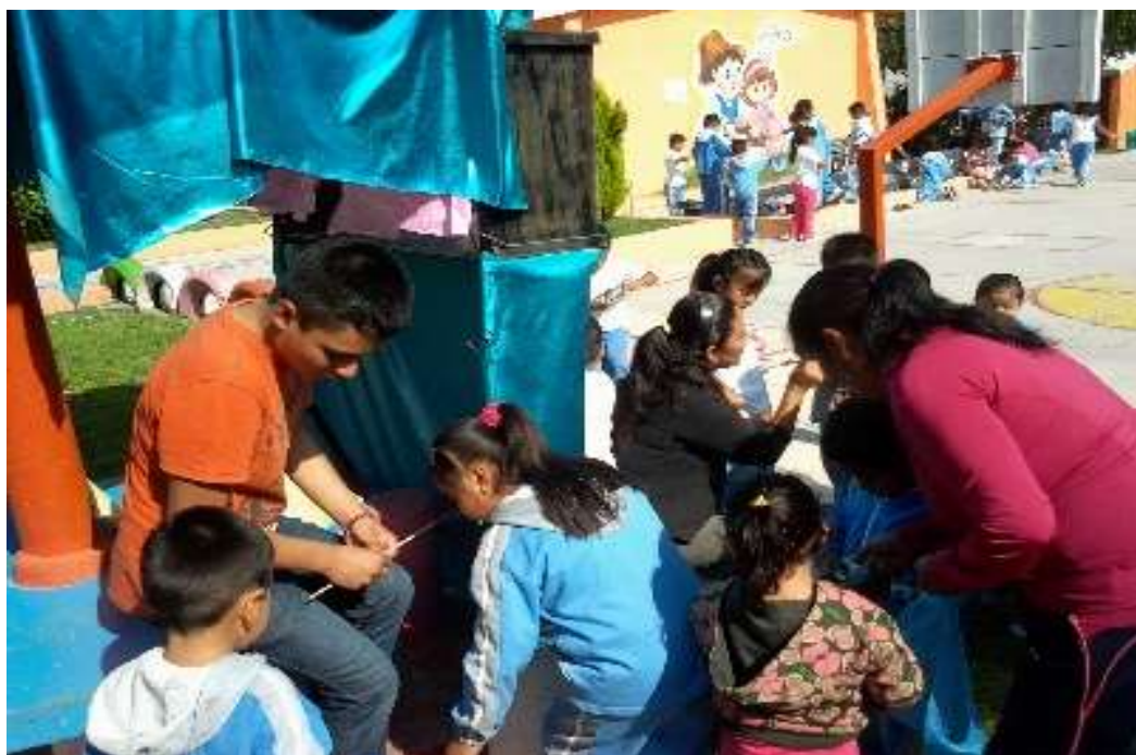
La fotografía muestra los pequeños adquiriendo boleto para su entrada