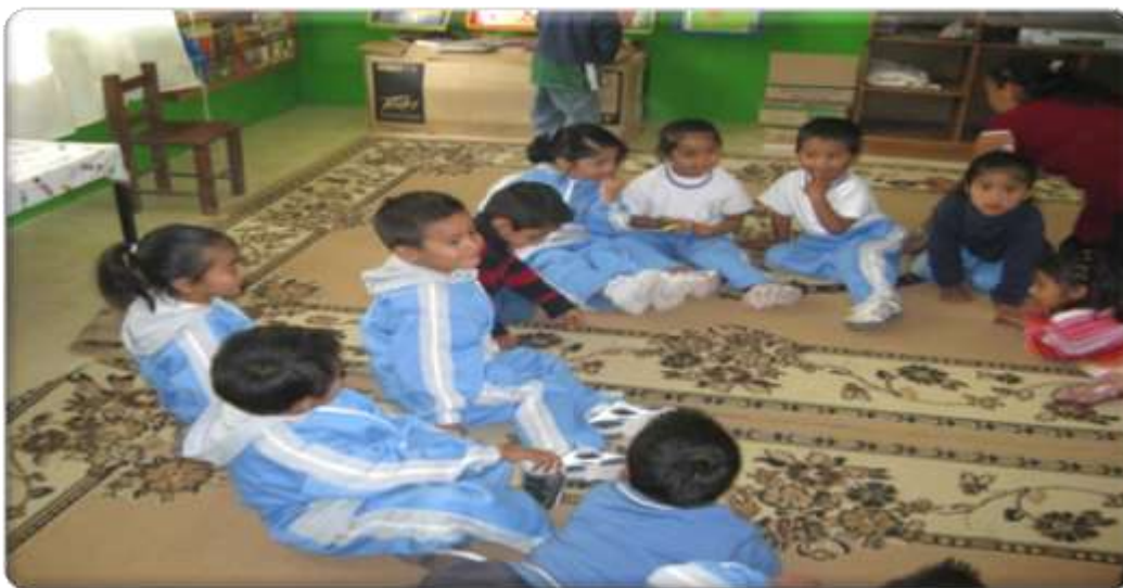
Anexo 5 actividad teléfono descompuesto