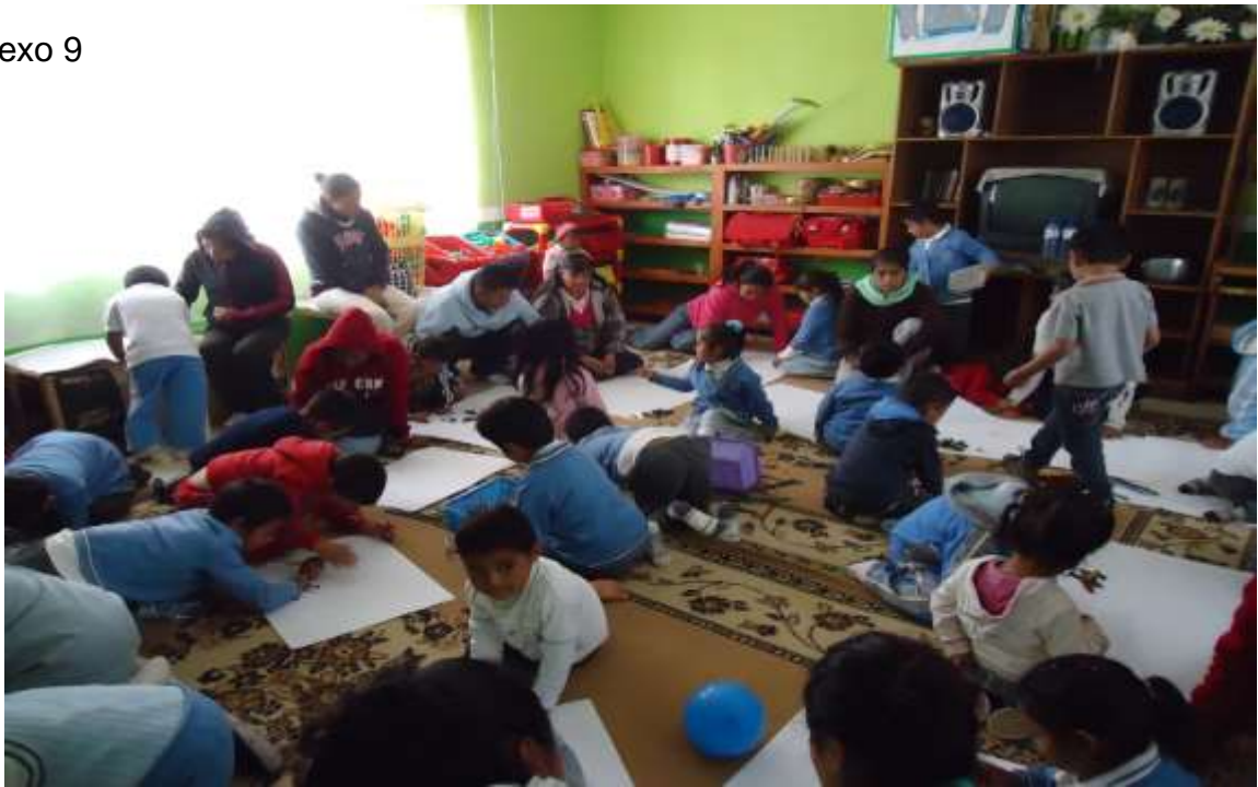
Aquí podemos apreciar que después de contarles el cuento los alumnos despiertan su imaginación para dibujar el final