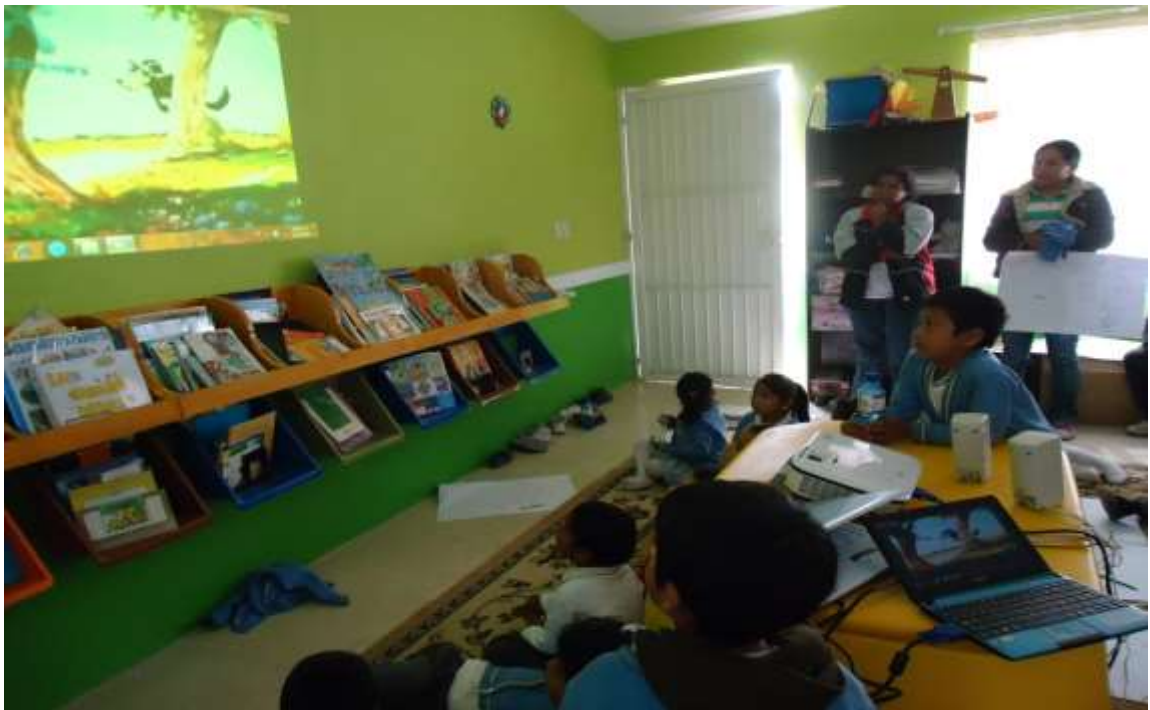
Los niños ven como ocurrió el final del cuento mediante una película