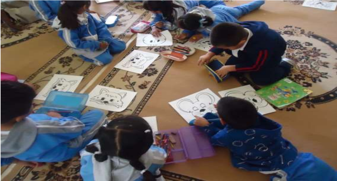
Los niños colaboran en las actividades de la máscara