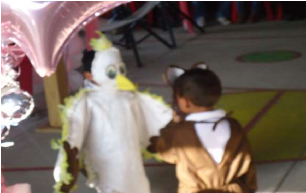
Realizando la escenificación.