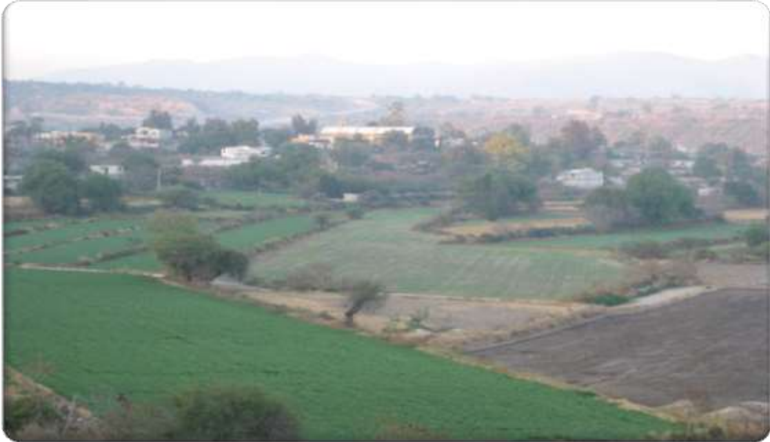
Anexo 1 la comunidad de Xothi