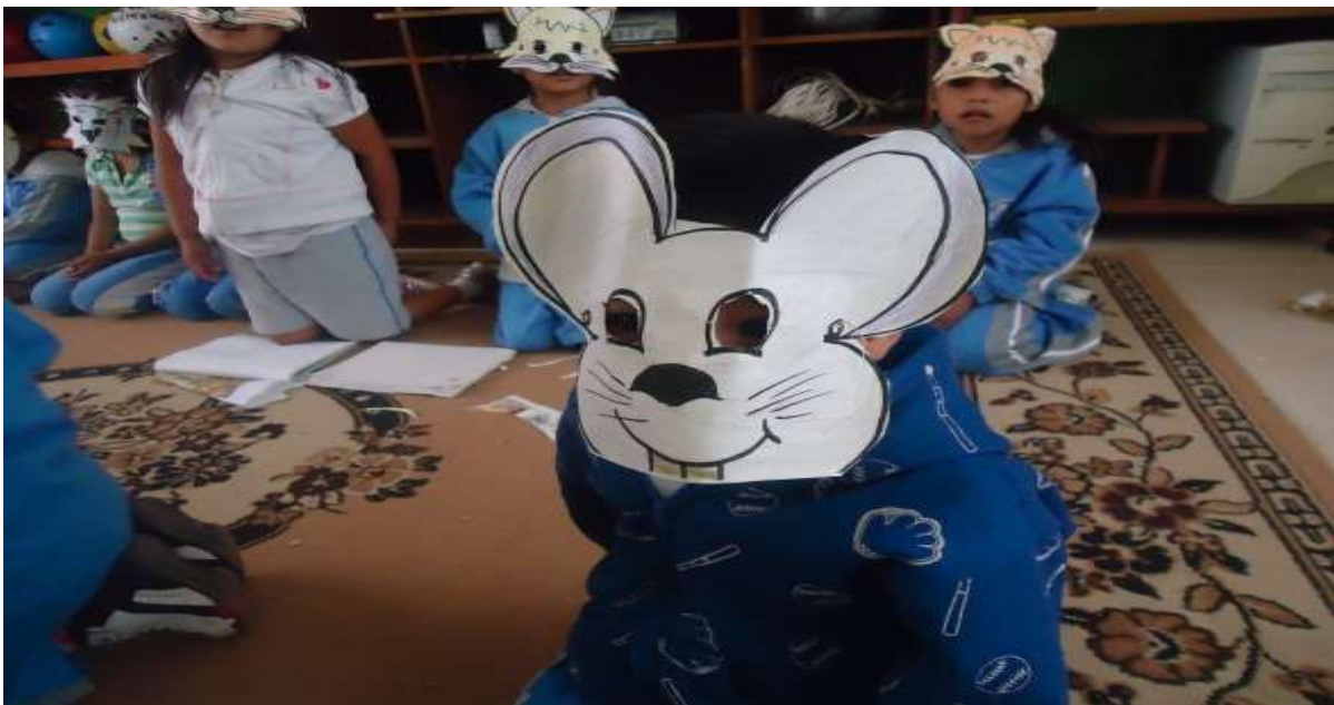
Los niños muestran su máscara al final de la actividad