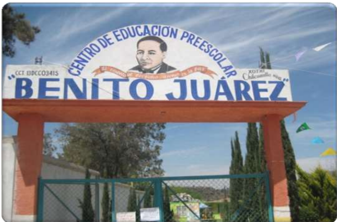
Anexo 2 entrada del preescolar Benito Juárez