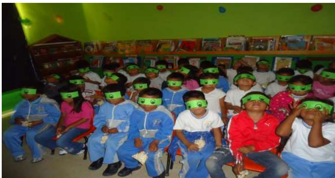
Los pequeños atienden a las indicaciones y escuchan la función.