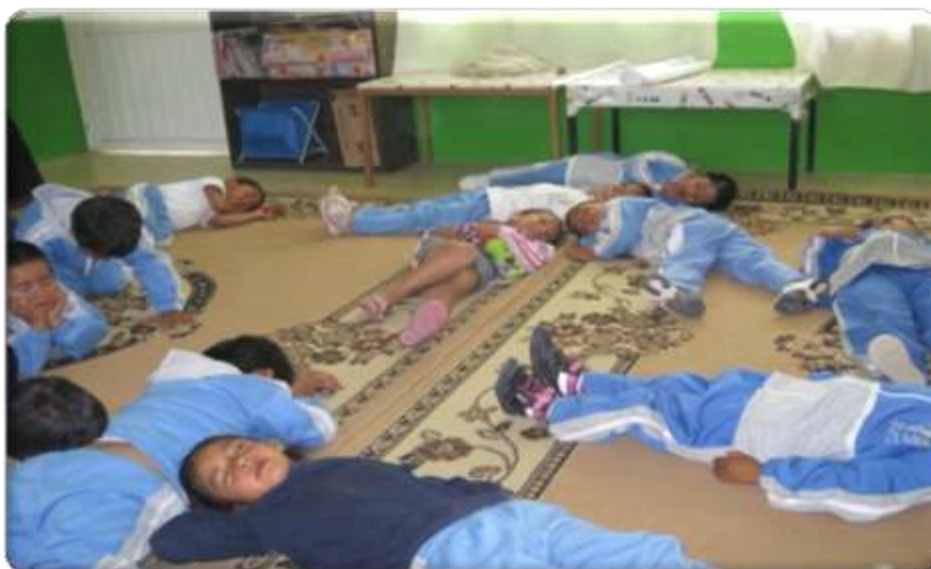
Anexo 6 niños en la alfombra para la lectura del cuento