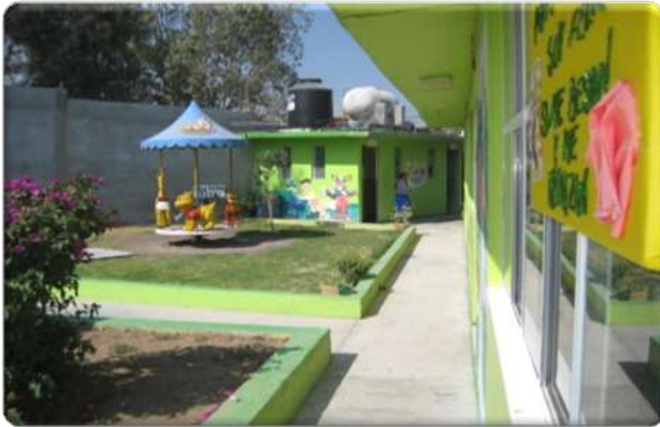
Anexo 3 muestra las instalaciones del preescolar