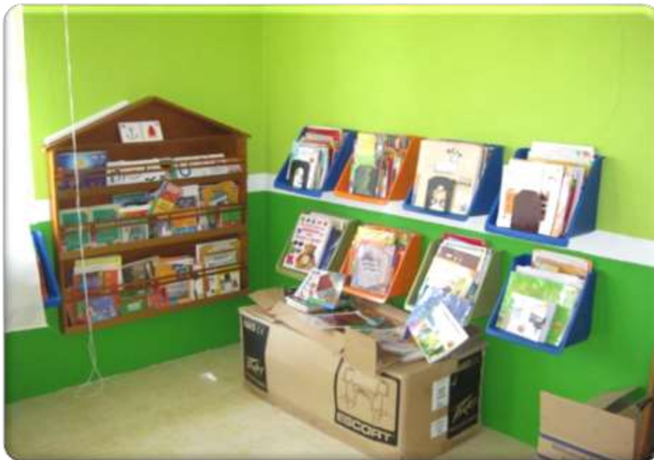
Anexo 4 Biblioteca del preescolar