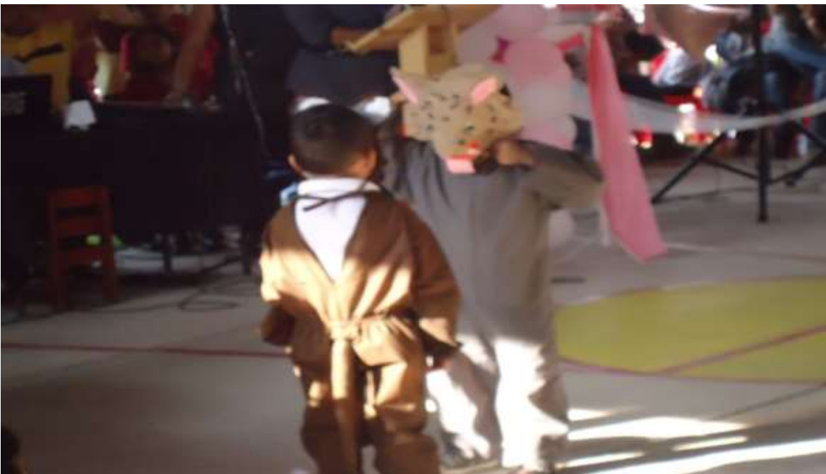
Disfraces realizados por los padres de familia