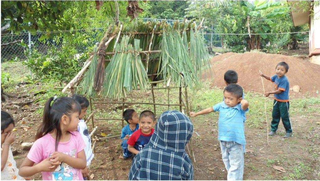
Niños disfrutan la casa