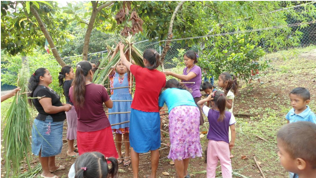
Madres colocan zacate a la casa