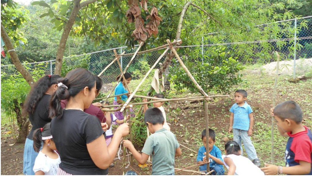
Madres y alumnos construyen la casa