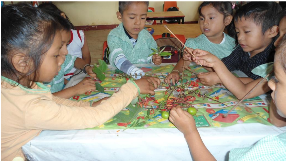
Trabajo de clasificación