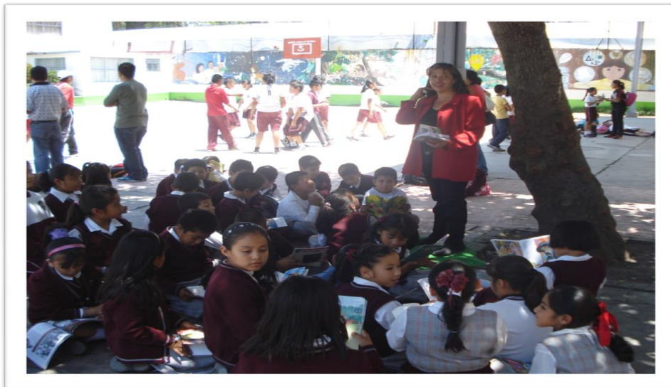
Los niños experimentaron y disfrutaron en diferentes escenarios el placer de leer.