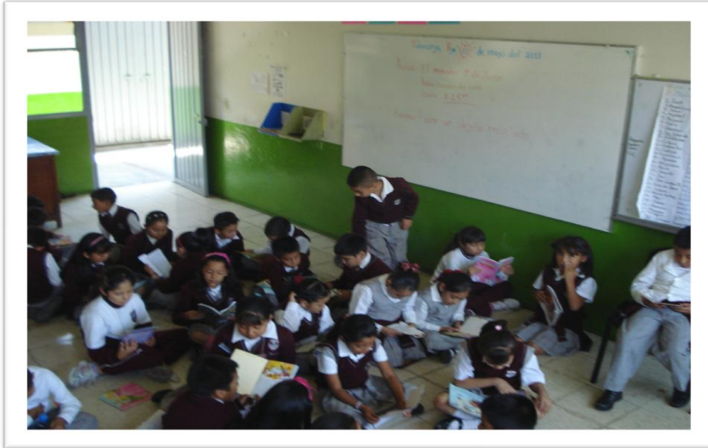
Los alumnos en un sesión en plena actividad de lectura.