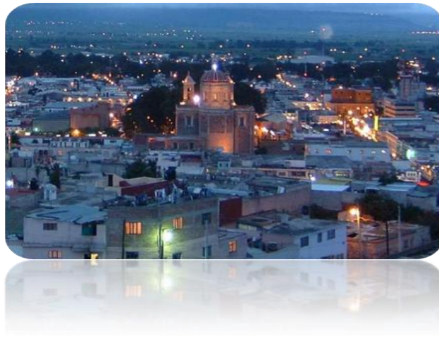
Vista panorámica del valle de Tulancingo.

Para iniciar con este trabajo se empezará por describir algunas referencias sobre la ubicación del centro de trabajo en el cual realizo mi práctica docente.