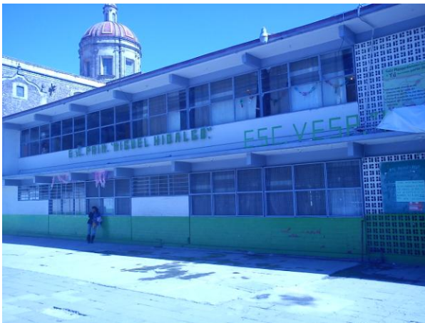
Fachada de la escuela Primaria Miguel Hidalgo