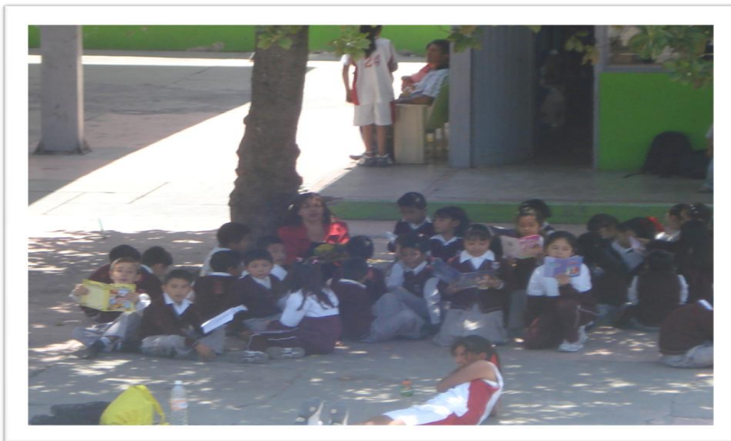
Actividad de lectura fuera del aula los alumnos disfrutaron de la lectura de cuentos

10:00 a.m. Se invitará a los alumnos que quieran compartir sus cuentos para que los lean ante el grupo, se elegirá el que más les haya gustado para que lo dramaticen en la semana siguiente. Finalmente comentarán sus opiniones sobre que la historia, los personajes y que fue lo que más les gusto de la lectura, y se efectuará el préstamo de libros.