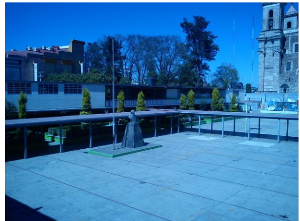
Vista desde el interior de la escuela

La Escuela Primaria “Miguel Hidalgo” es donde presto mí servicio como maestra frente a grupo, este un centro escolar se encuentra ubicado en la ciudad de de Tulancingo, Hgo., con C.C.T. 13DPR2627P, perteneciente a la Zona 58, y al Sector