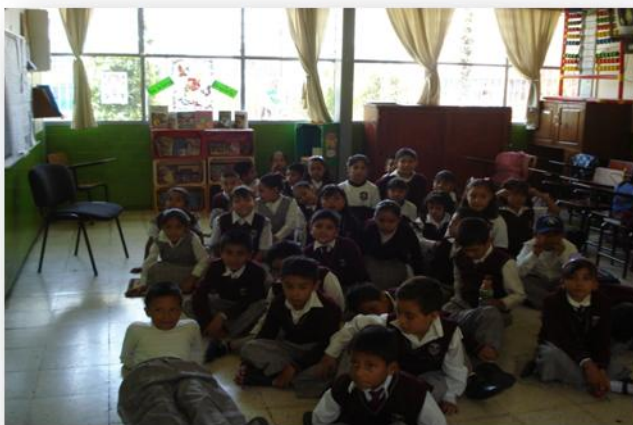
Vista desde el interior del salón de clases en una sesión de lectura.

El aula donde desarrollo diariamente mi trabajo docente esta conformada por: