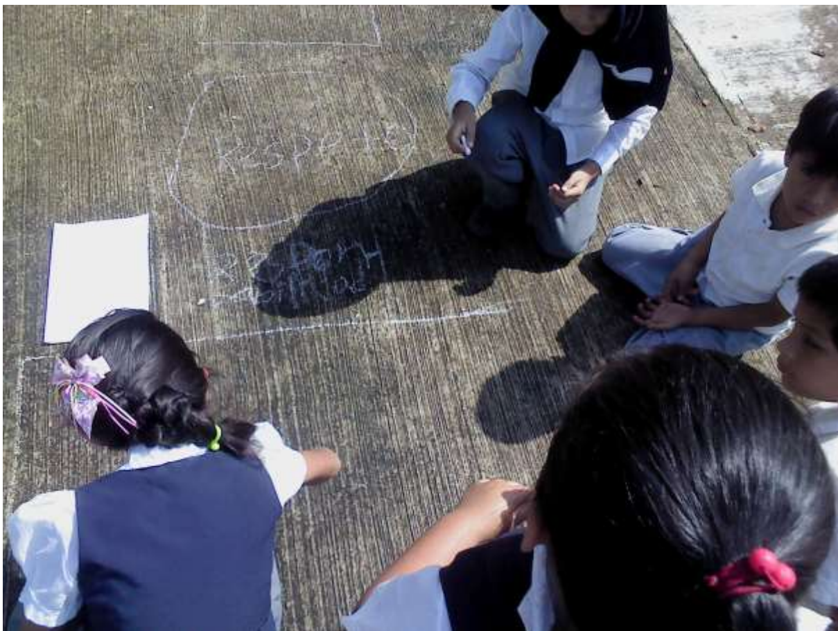
Alumnos dibujando el avión para comenzar su actividad lúdica.