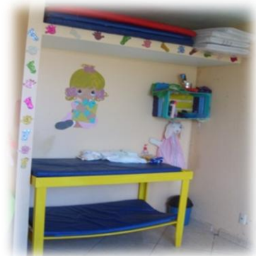
Planta alta de la estancia infantil