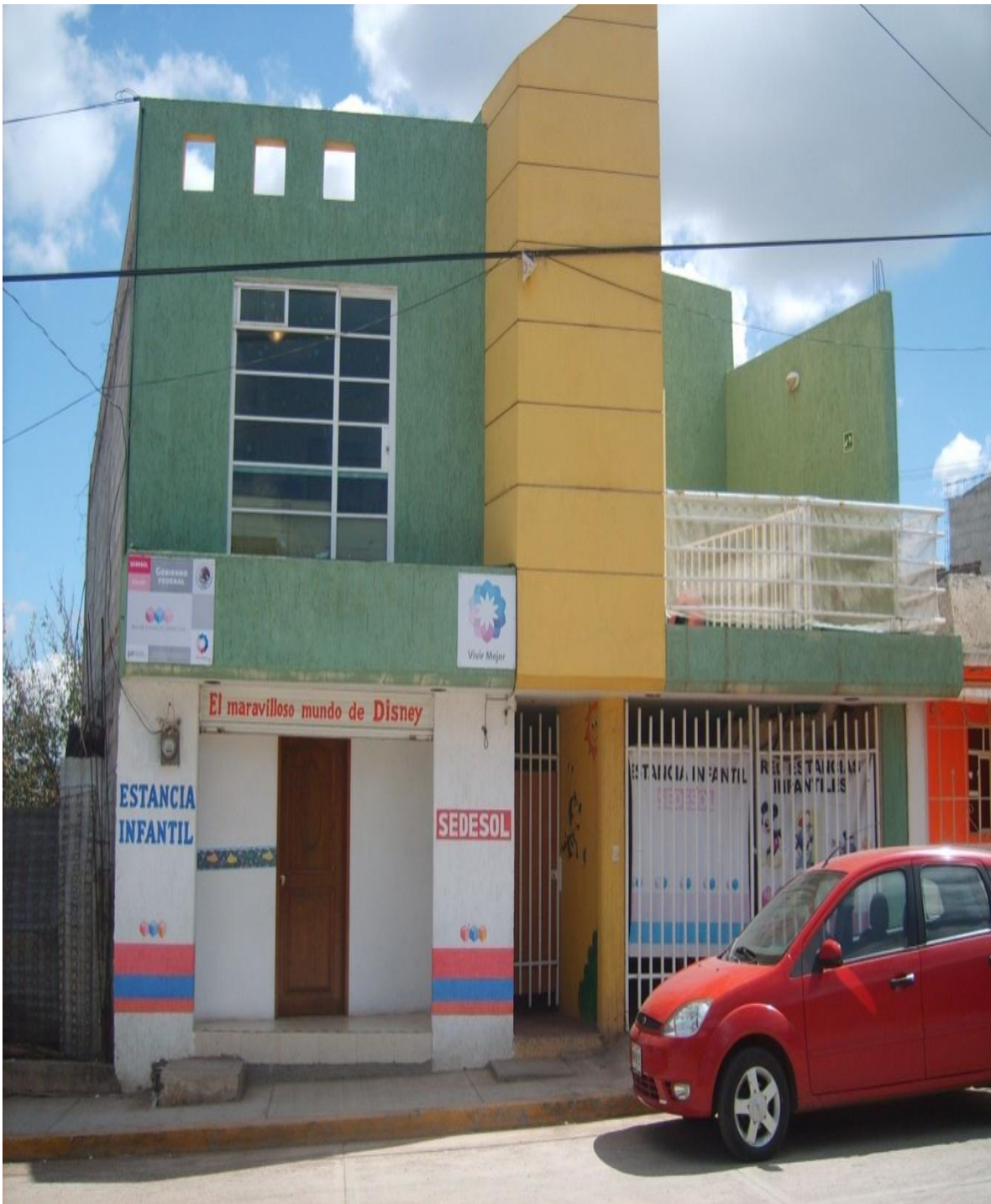
Estancia infantil "El maravilloso mundo de Disney"