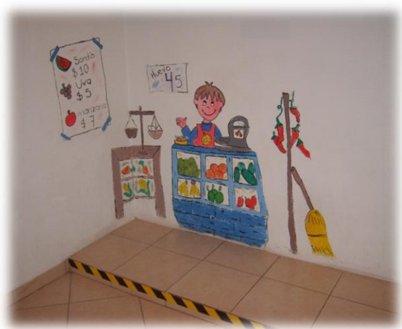
Planta baja de la estancia infantil