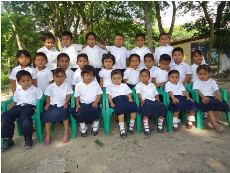
Foto de grupal de los alumnos que egresan generación 2013 - 2014