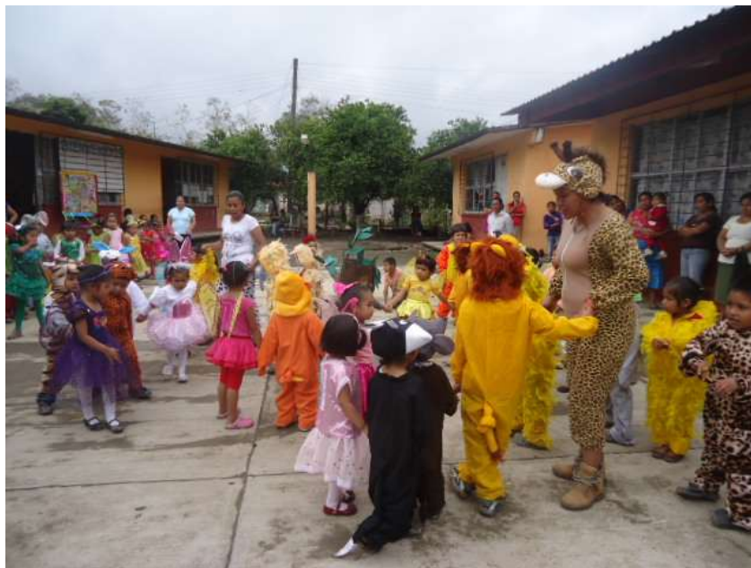
Realizando el evento del día de la primavera, maestros y alumnos