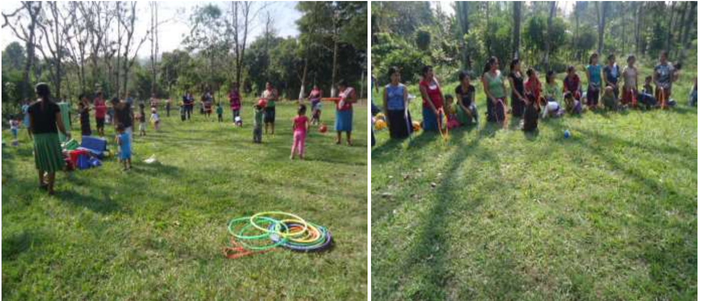
Los niños y madre de familia repasando los números a través de esta actividad llamada matrogimnasia