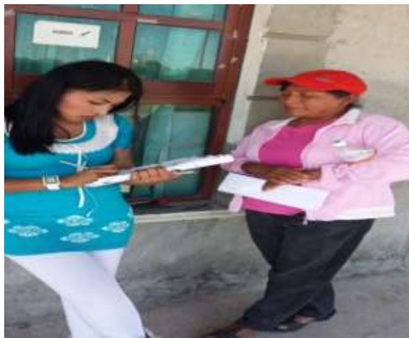
LIE'S realizando las entrevistas previas a cada una de las mujeres de la comunidad de la Heredad.

ANEXO 4: Caracterización de otras diez mujeres en donde se conformó con una totalidad de dieciocho mujeres contando con la caracterización de las primeras ocho mujeres del primer capítulo de documento.