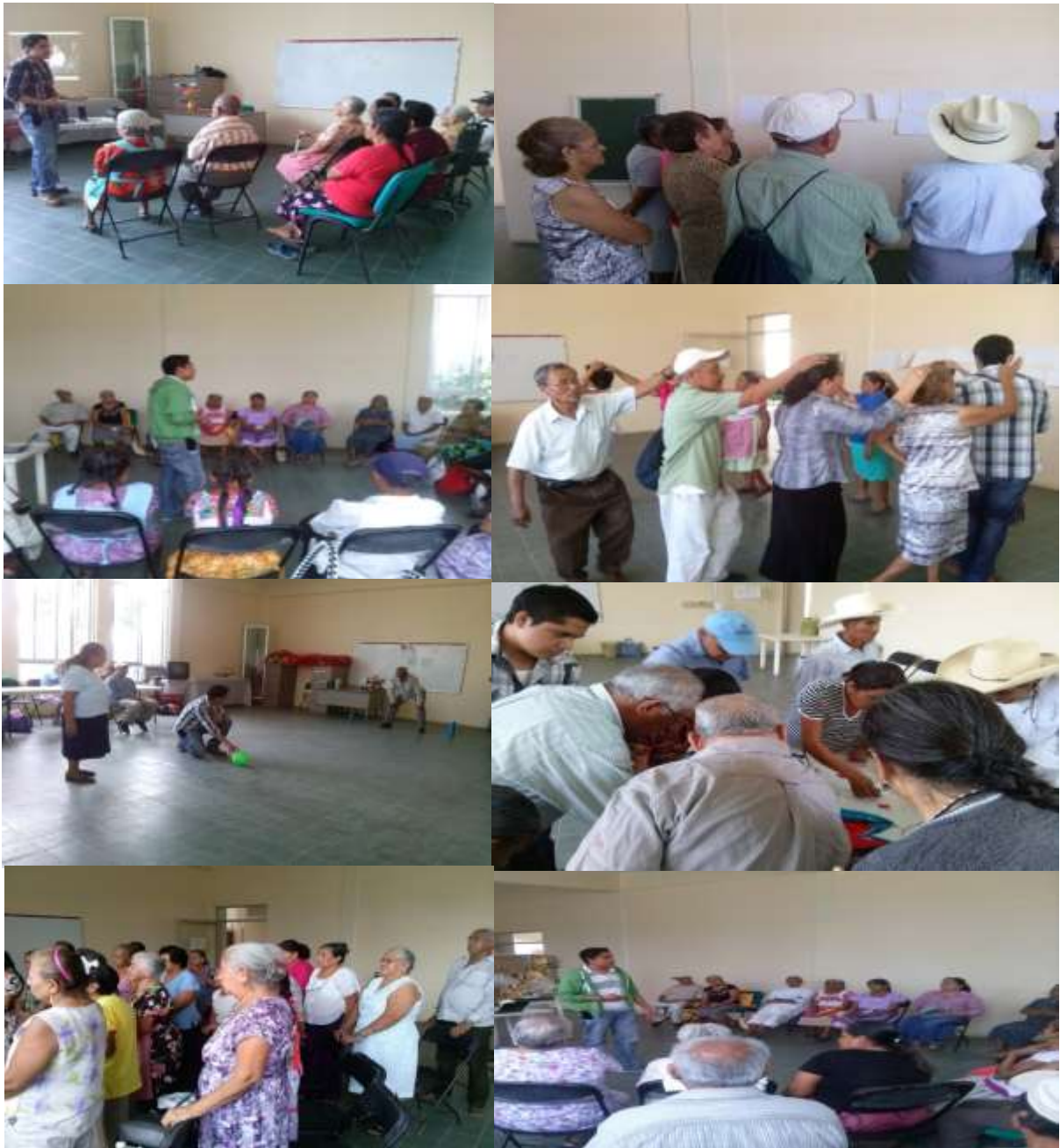
Actividades recreativas de integración grupal implementadas en el grupo de adultos mayores del Centro Gerontológico integral de Huejutla, Hidalgo en el mes de Febrero del 2014.