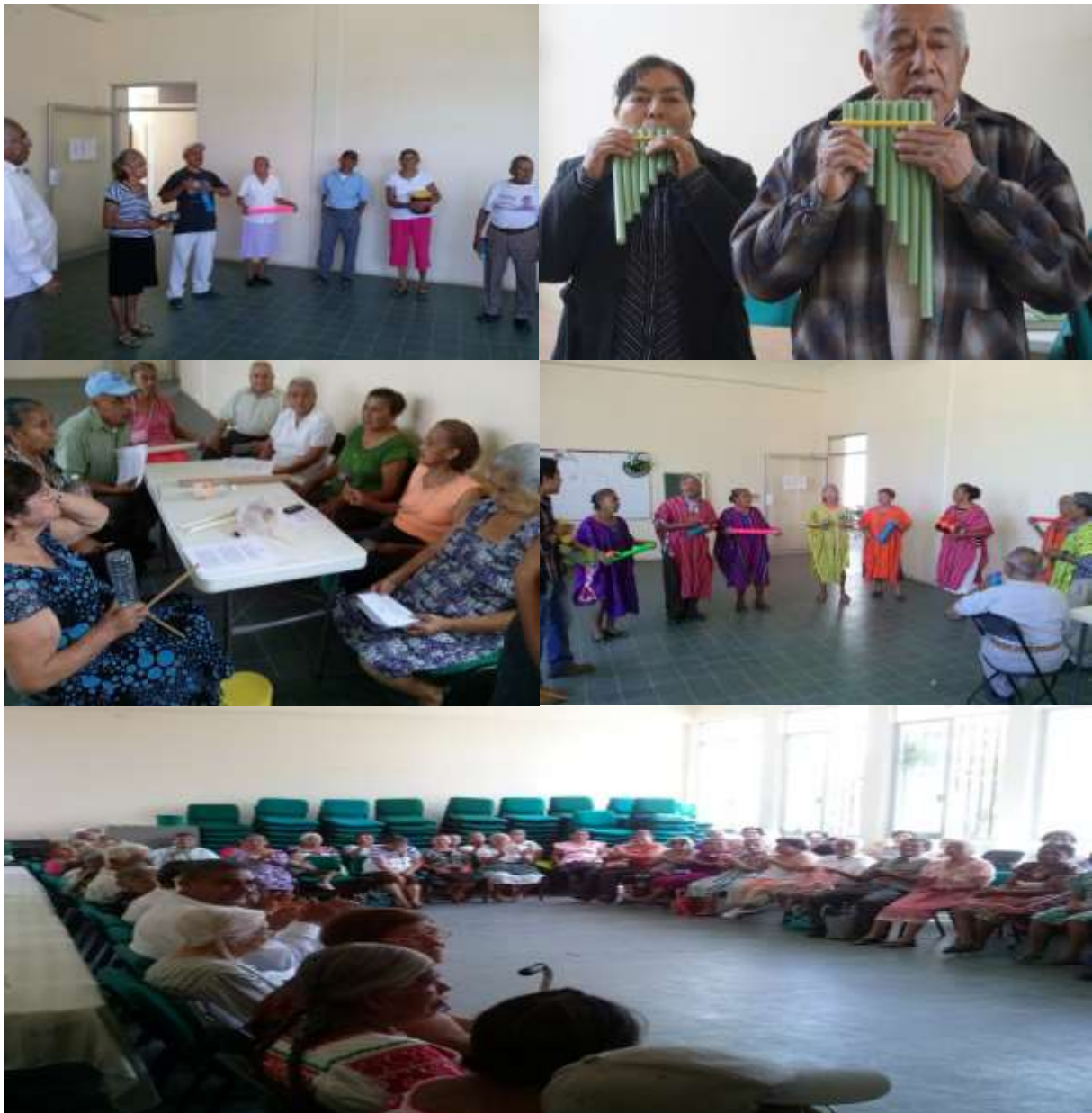
La integración grupal de 20 adultos mayores del Centro Gerontológico Integral de Huejutla, Hidalgo en el mes de Junio.