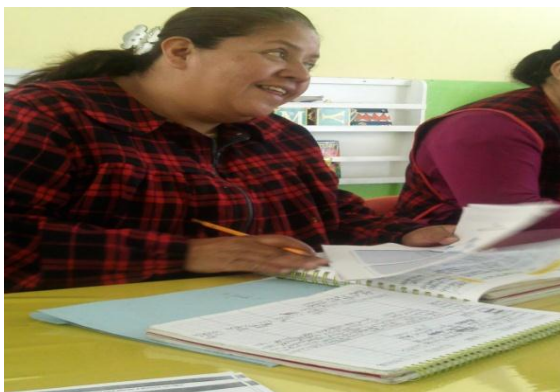
Educadora explicando el diseño de su planeación.