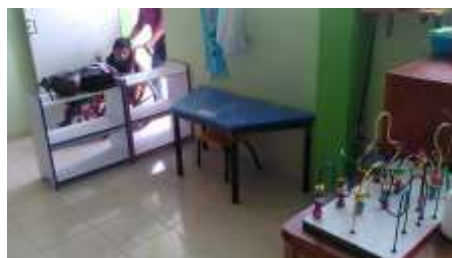
Lugar donde trabaja un niño con discapacidad múltiple.