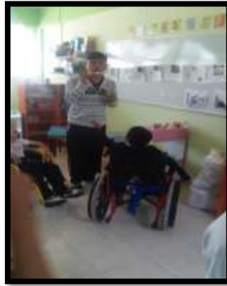
Estudiantes del CAM No. 30 divirtiéndose con burbujas de jabón