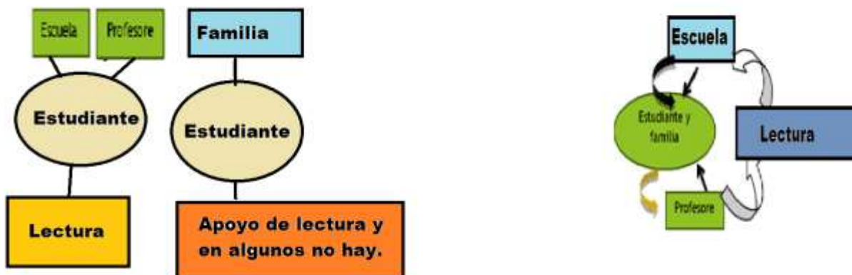
Esquema 1. Relación y vínculos familiares y escolares sobre la lectura

En el esquema se muestra por el lado derecho al estudiante donde se está trabajando la lectura de manera separada con profesores y a su vez con la misma escuela es decir donde no hay un involucramiento de todos los agentes para la promoción de la lectura mientras que por el otro lado se llega a identificar que la familia no se toma en cuenta para trabajar en equipo con los profesores y escuela, sino solo se trabaja la casa con el estudiante y la lectura aunque esto no en todos los casos.