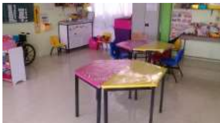
Espacio áulico en el que trabajan los estudiantes.