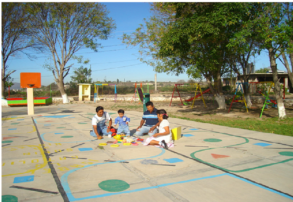
Padres de familia presentando la dramatización de un cuento.