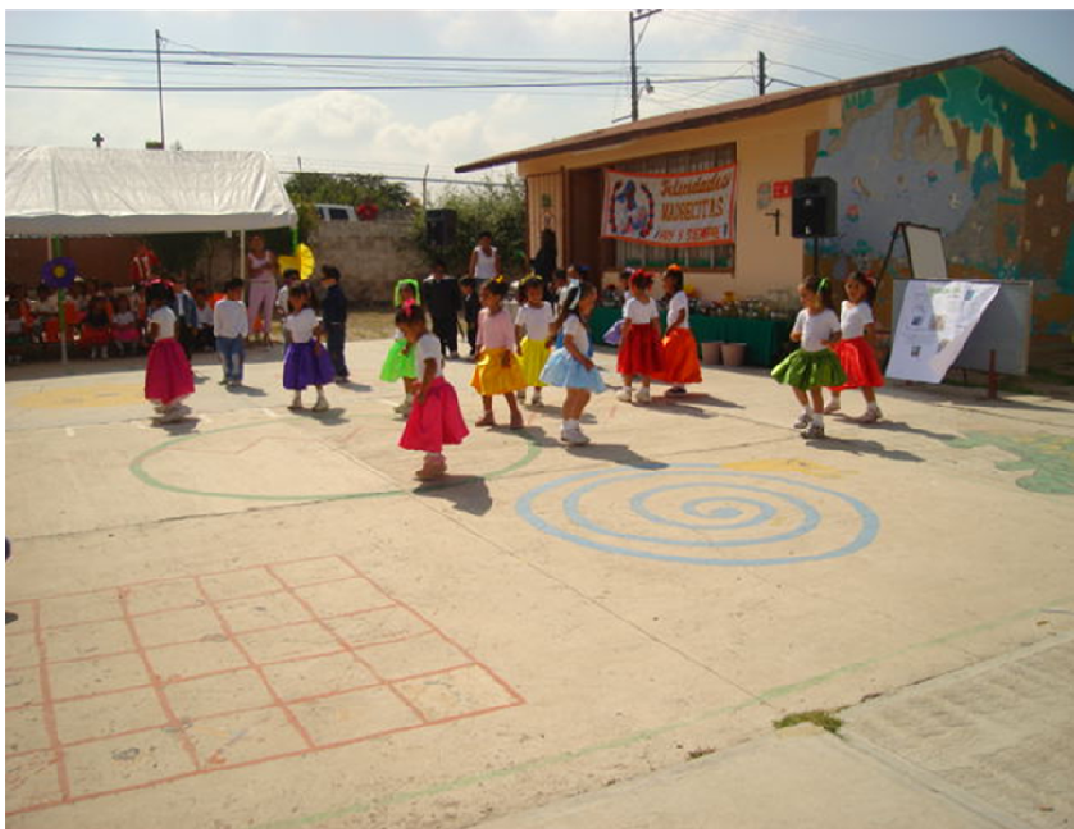
IMAGEN DE LA ESCUELA JARDIN DE NIÑOS, DE LA COMUNIDAD DE JAGUEY, NOPALA HIDALGO.