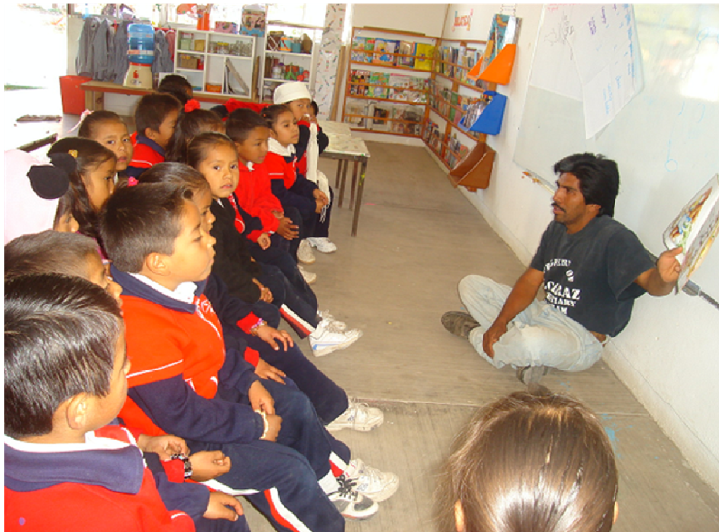
Un padre de familia presentando a los niños un cuento infantil.