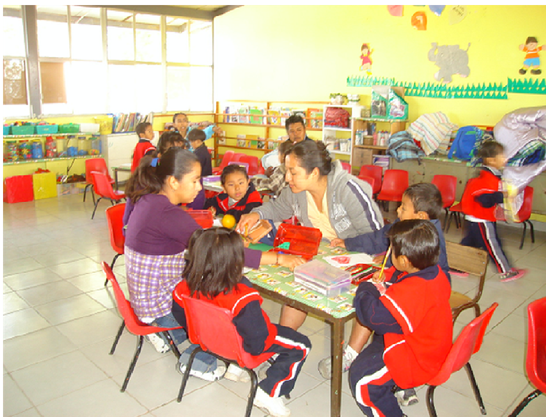
Niños y padres de familia realizando actividades en forma conjunta en la construcción de trabalenguas.