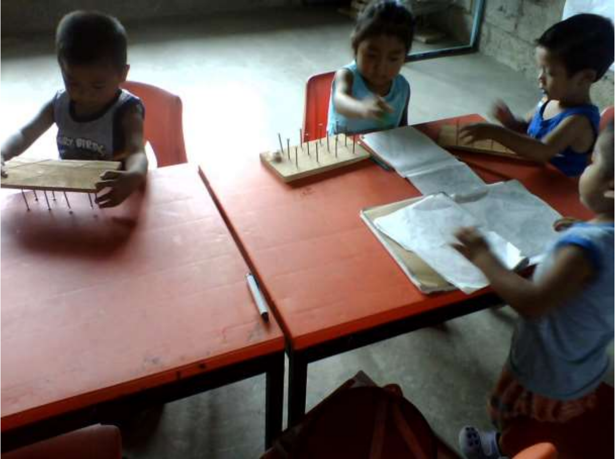
Los alumnos observan como realizan figuras con el geoplano