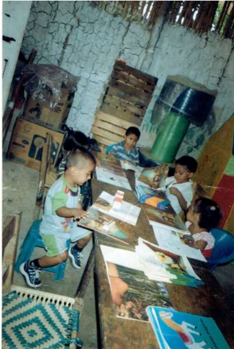
Así trabajaban los alumnos, aún no existía mobiliario