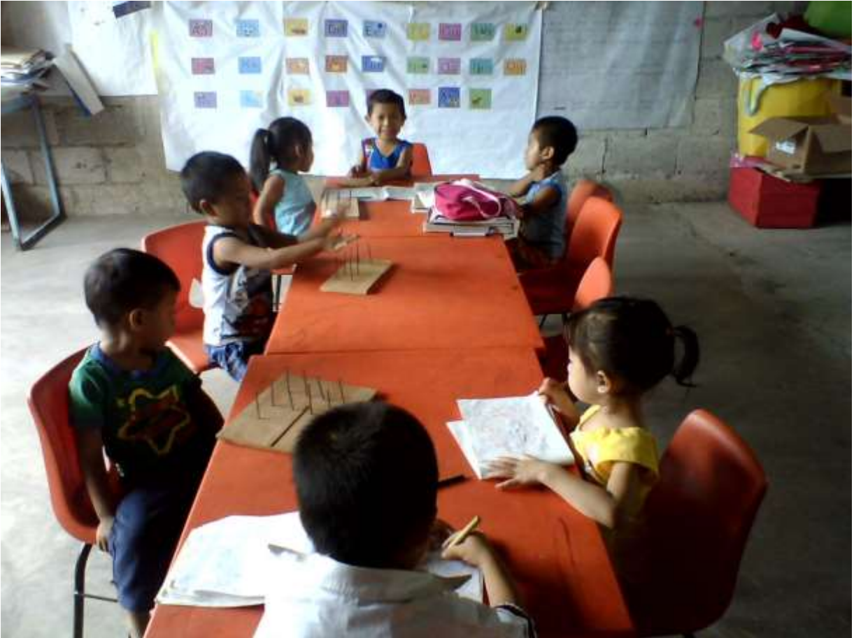
Los alumnos se encuentran trabajando individualmente con el geoplano