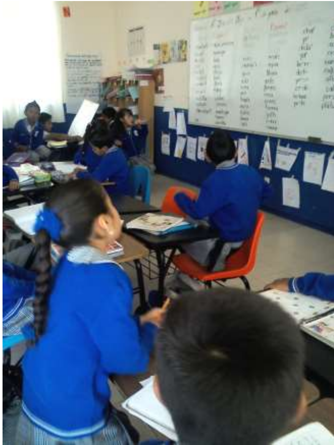
Secuencia 5: “En qué me hablan” vocabulario en diferentes dialectos”.