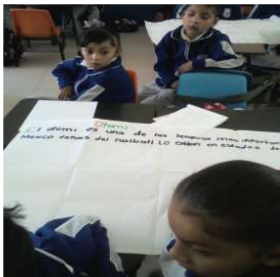
Secuencia cinco; "¿En qué me hablan?", investigando sobre los dialectos.

Por lo tanto el proyecto se encausa hacia esta dimensión, puesto que las prácticas de evaluación son parte de la innovación y en un contenido escolar específico. En conjunto con la metodología de investigación-acción que fundamenta y colabora una con otra, porque todo se define en los que yo hago frente a la evaluación de los aprendizajes en la asignatura de español.