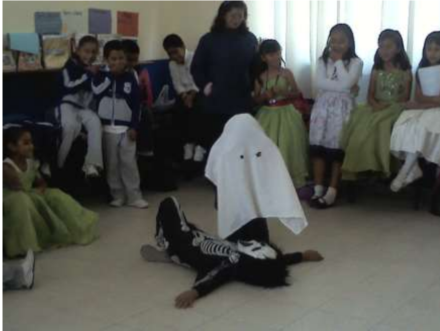
Secuencia 4 “Entre leyendas te veas”, los niños actuando la leyenda “El fantasma de la cocina”.