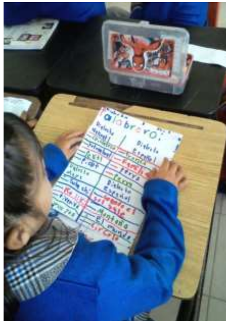
Secuencia cinco; “En que me hablan” palabrero de algunos dialectos.