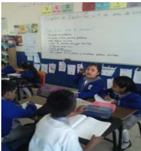
Secuencia seis; "Juego de palabras", reconociendo que son estos juegos y adentrándonos a la secuencia.

La necesidad de evaluar resulta de la necesidad de reconocer los aprendizajes de los alumnos, los puntos que desarrolla Contreras-Ferto, en mi caso son indispensables para llevar a cabo la evaluación y lo que se necesita para abordarla, debo de reconocer que los he tomado en cuenta en mi práctica y me ha facilitado al momento de evaluar, por lo que, lo relaciono con la teoría de Ausbel , donde refiere y explica el concepto de aprendizaje significativo, que se utiliza en oposición al aprendizaje del contenido sin sentido, como la memorización. La posibilidad de que un contenido tenga "sentido", depende de que sea incorporado al conjunto de conocimientos previamente existentes en la estructura mental del sujeto. 64 Puedo decir que si Ausbel habla de un aprendizaje significativo y Contreras-Ferto, se refiere a la necesidad de evaluar, es porque los dos autores empatan en los aprendizajes que han ido adquiriendo los niños a lo largo de un tiempo, y tan es así que también se requiere de un apoyo extra, los padres de familia.