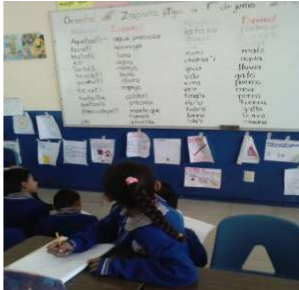
Secuencia cinco; "¿En qué me hablan?".