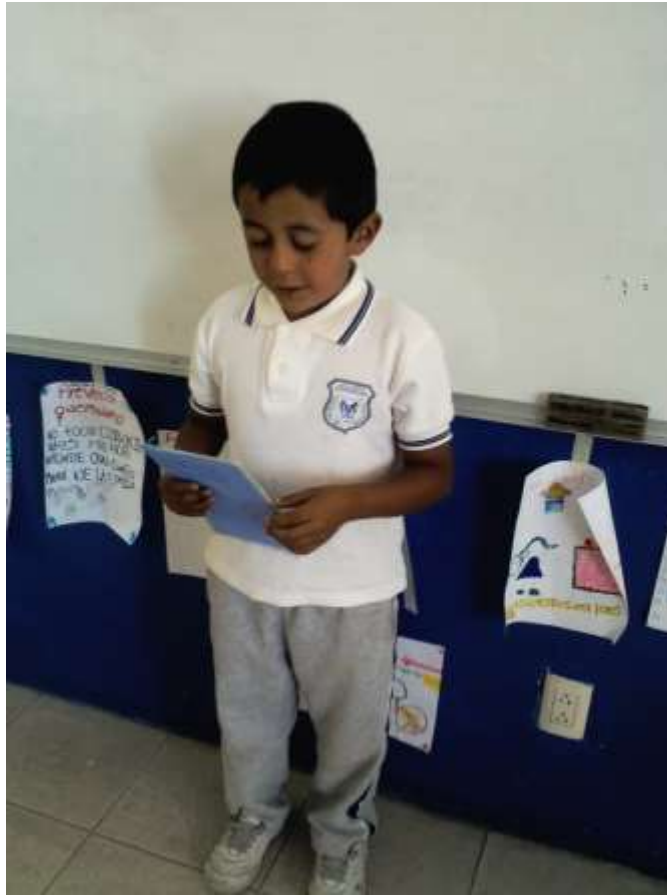
Secuencia 1: "Agencia de publicidad" exponiendo su cartel de publicidad.