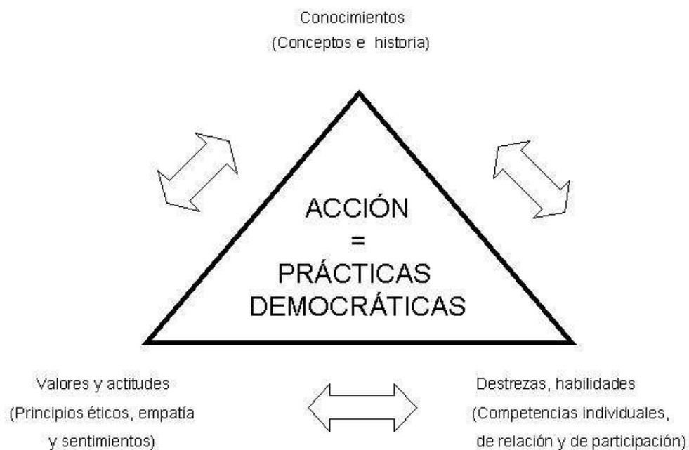
Diagrama de triángulo 1.

(Adaptado de Keen y Tirca, "Educación para la ciudadanía democrática", 1999)