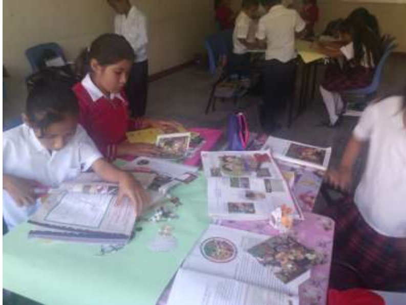
Están buscando información para sus actividades