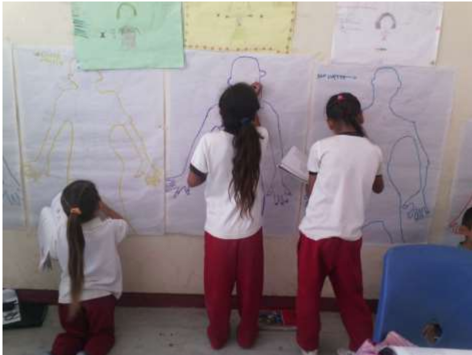
Los alumnos están plasmando las características sexuales de cada uno