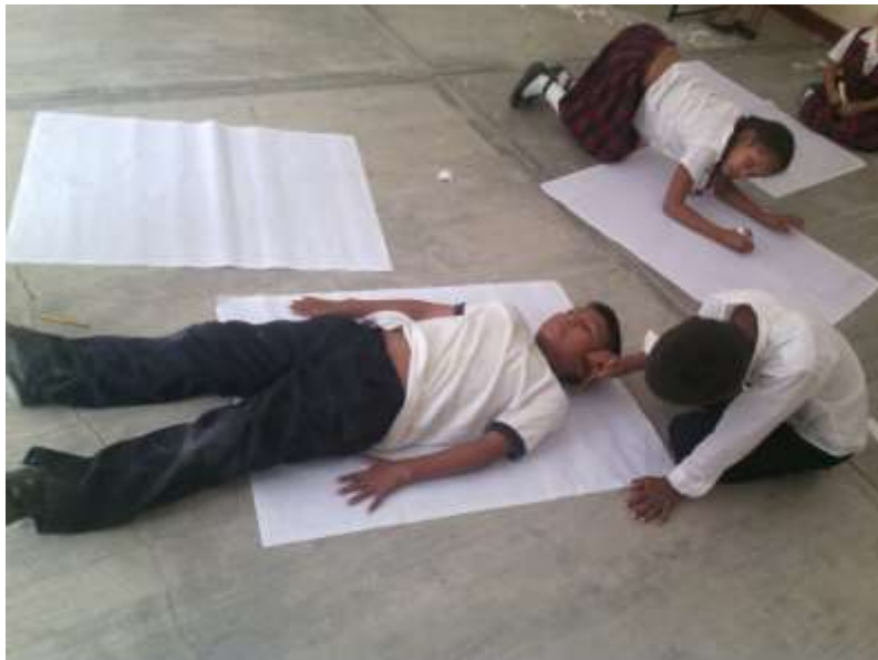
Los alumnos están dibujando su silueta brindándose mutua ayuda