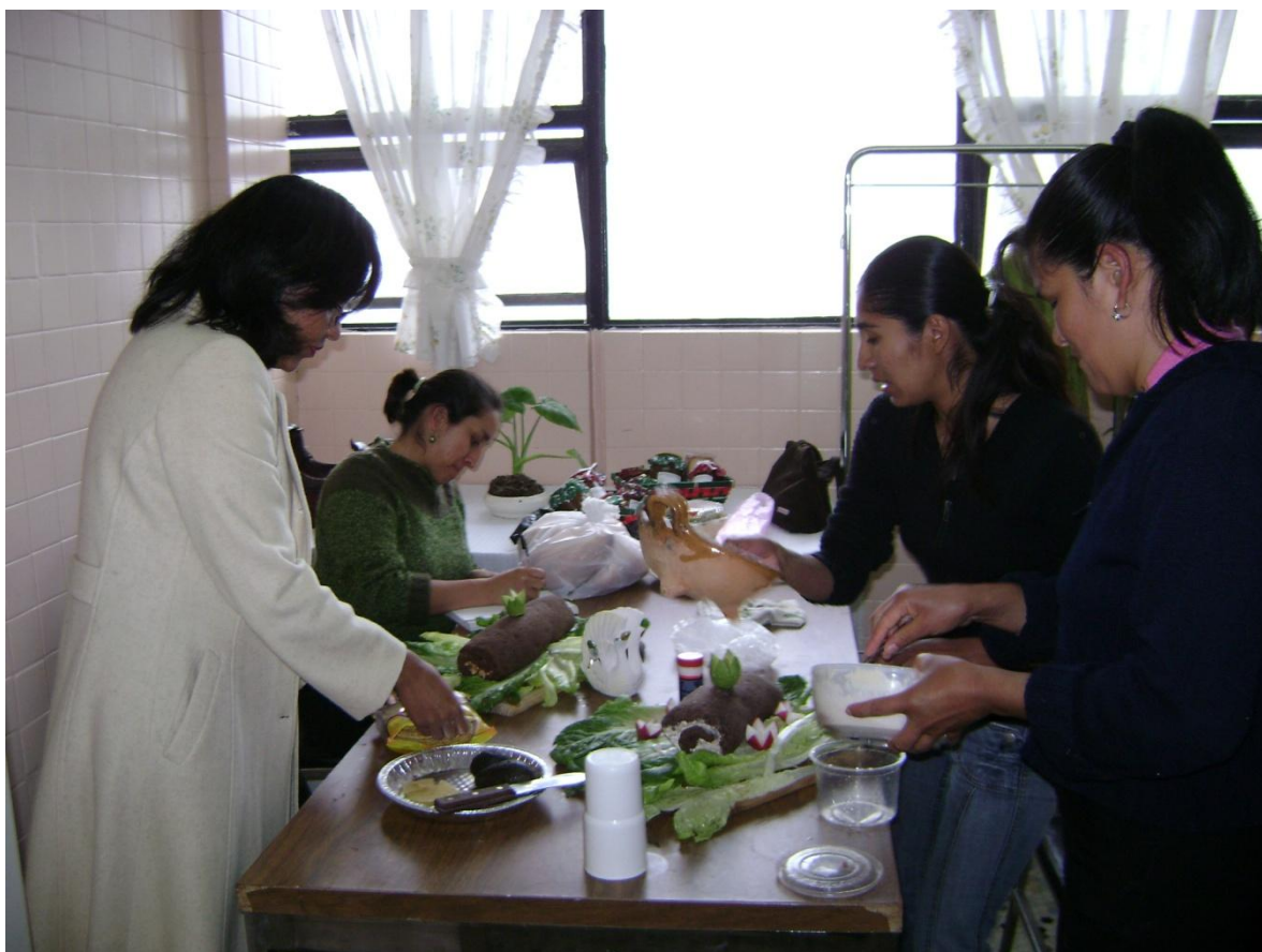
CLUB DE MUJERES DEL CEC DE HIDALGO

Esta foto muestra como se les brinda la capacitación a las madres de familia que habitan en los alrededores del municipio de Tulancingo.