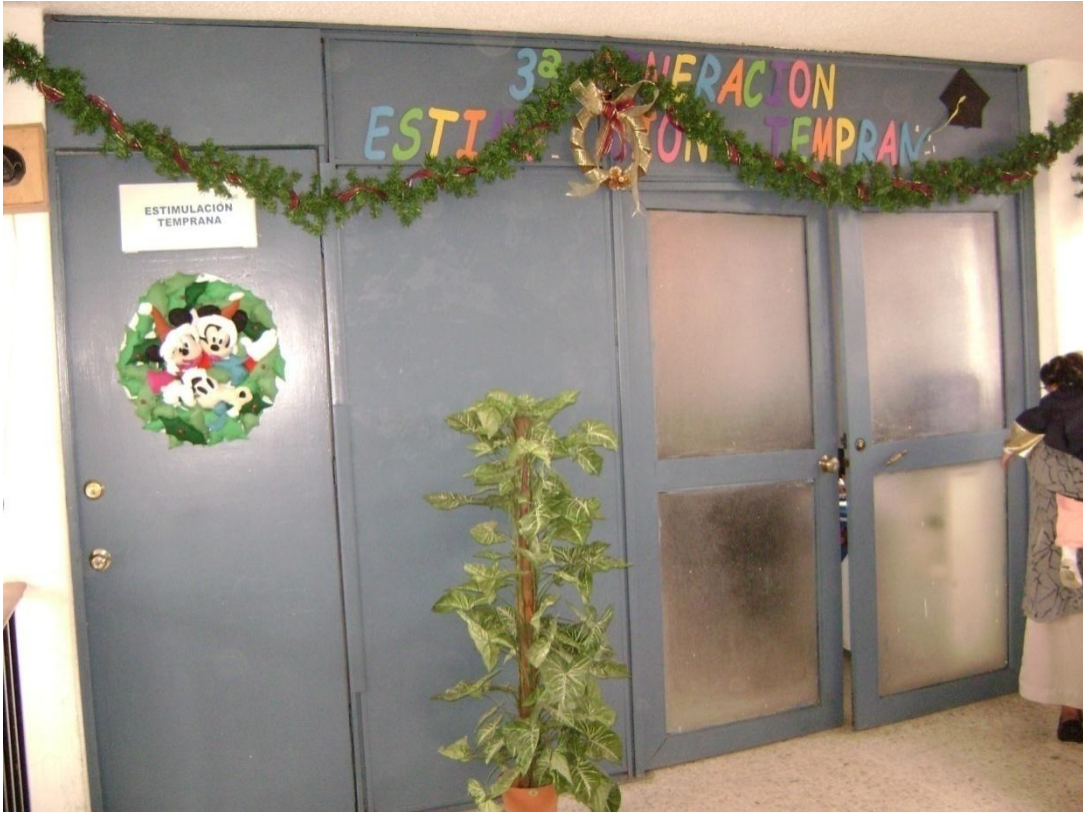
Esta foto muestra el Centro Estatal de Capacitación y dentro de este el area de Estimulación Temprana.