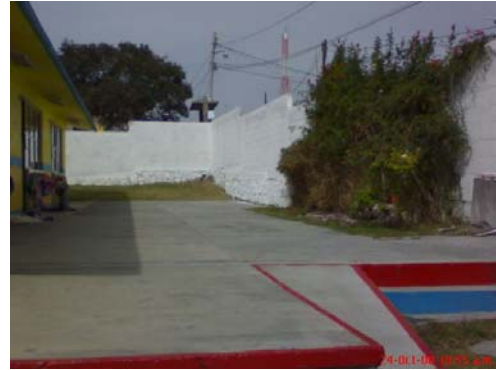
19.- y 20.- Pasillo principal de la escuela como acceso a los salones