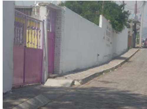
2.- Entrada del Preescolar