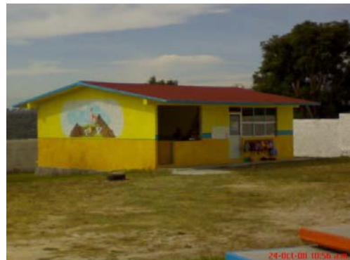
23.- Barda de la dirección y sanitarios 24.- Salón de 3ero. "B" y otro en construcción