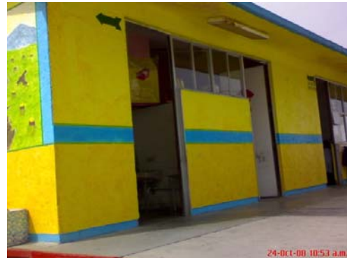
16.- Sanitarios de niñas y niños