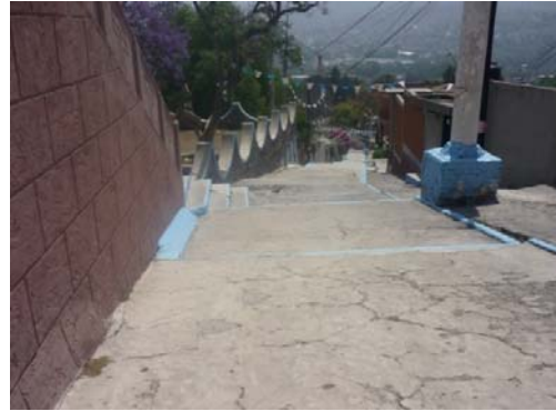
7 y 8.- El templo “La Hermita” se encuentra sobre la misma calle por eso es cerrada