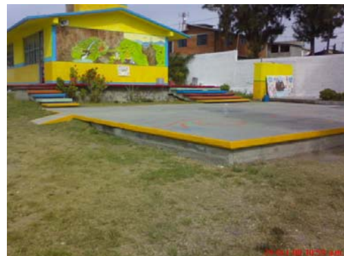
11 y 12.- Contexto institucional del Jardín de Niños “Thomas Jefferson”