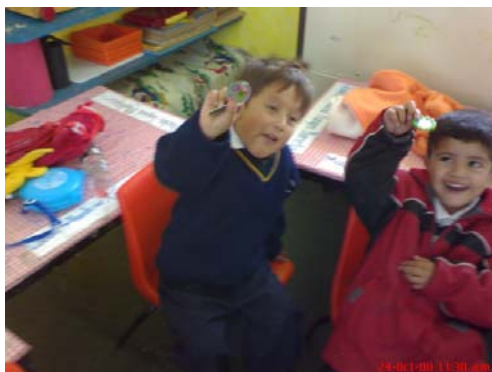
41.- Actitud que denota indisciplina