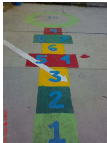
29.- y 30.- Juegos de la institución (sube y baja y avión)