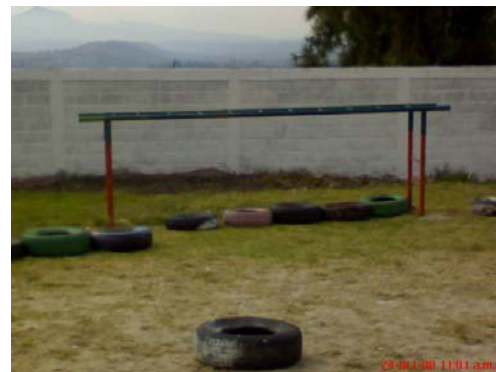
27.- y 28.- Juegos de la institución (resbaladilla y pasa manos)