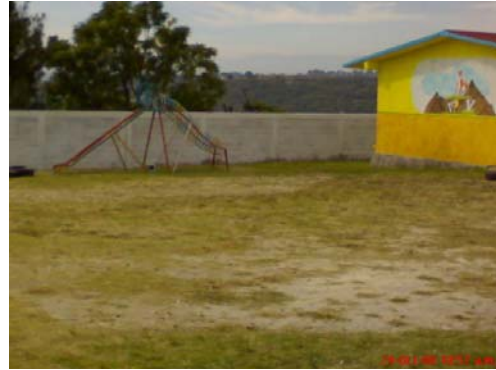
25.- y 26.- Juegos de la institución (columpios y resbaladilla)