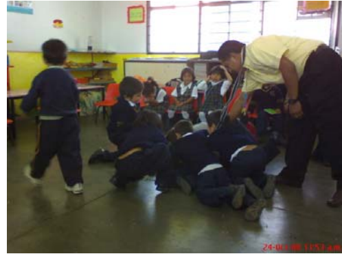
37.- y 38.- Conductas manifestadas cotidianamente en el salón