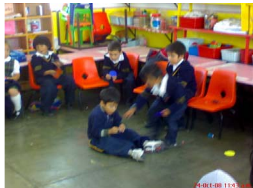
35.- y 36.- Imágenes que denotan indisciplina dentro del salón