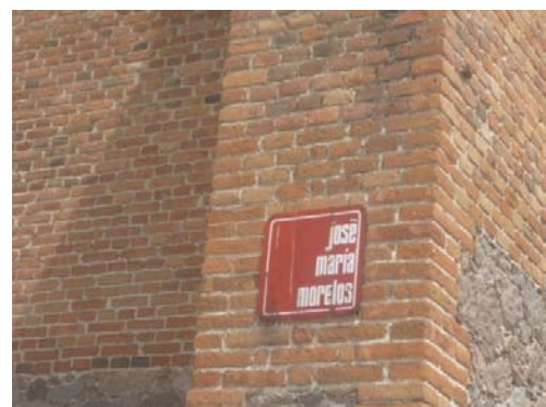
6.- Calle sobre la que se encuentra la esc.