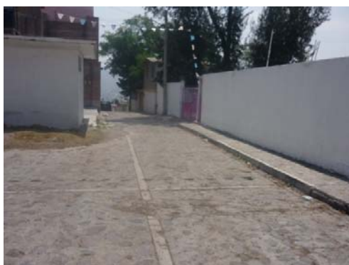
5.- La calle no es tan transitada