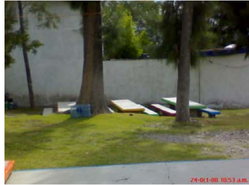
31.- y 32.- Mesitas para almorzar