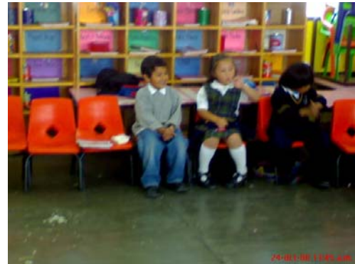
33.- y 34.- Forma en que trabaja el grupo de segundo "B"