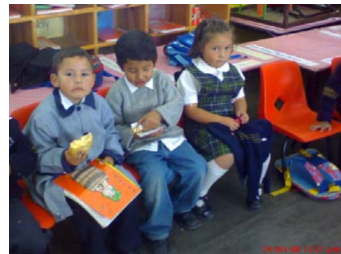
39.- y 40.- Actitudes que denotan una clara indisciplina en el grupo