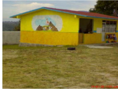
14.- Salón de tercero "B" y otro en construcción