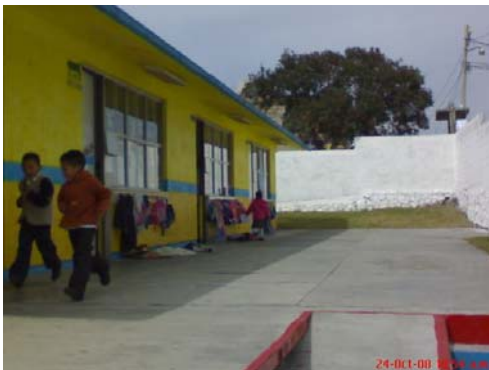
17.- y 18.- Pasillo principal, donde se encuentran tres de los cuatro grupos de Preescolar