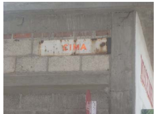
9 y 10.- Una calle con la que colinda es “Cima” y ahí se puede observar que las casas son de block y tabique.