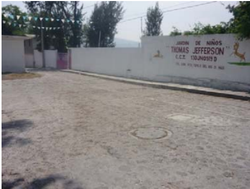
1.- Fachada principal de la escuela.