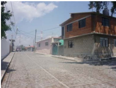
3.- Calle "José María Morelos y Pavón"