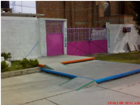
15.- Entrada de la Institución