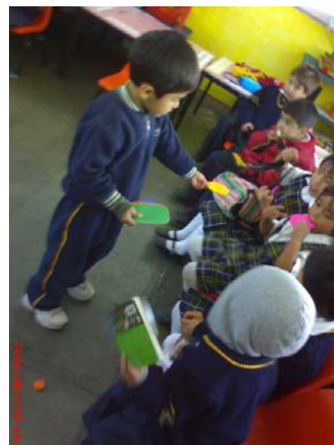
42.- Dinámica de trabajo de los chicos