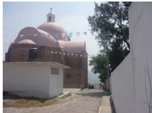
4.- Calle principal del Preescolar