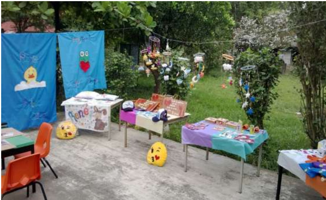
Actividad No. 22 "Cierre del taller" exposición de materiales.