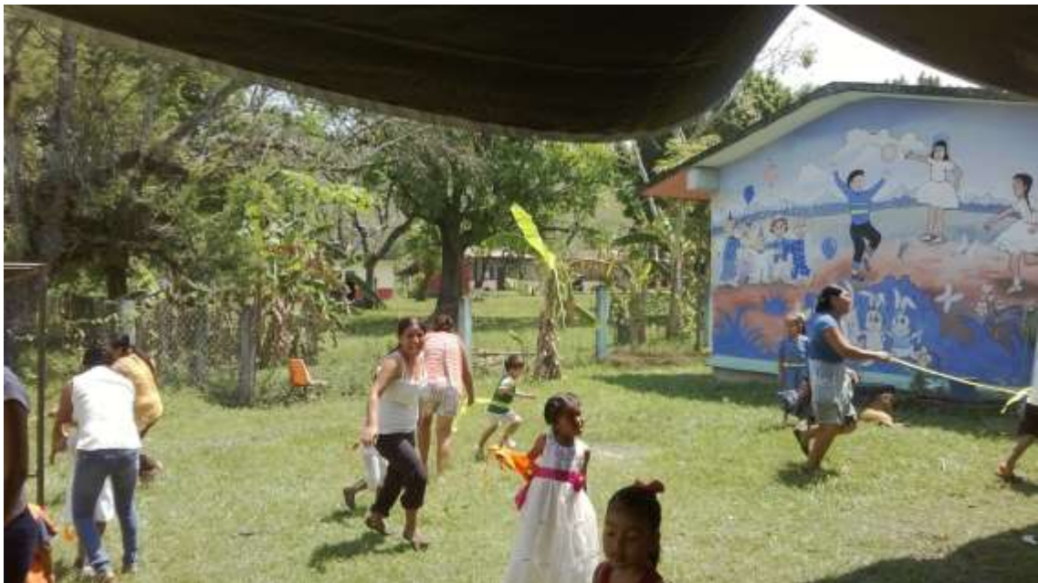
Anexo No.18 Actividad “quitar el listón” en la Matrogimnasia.