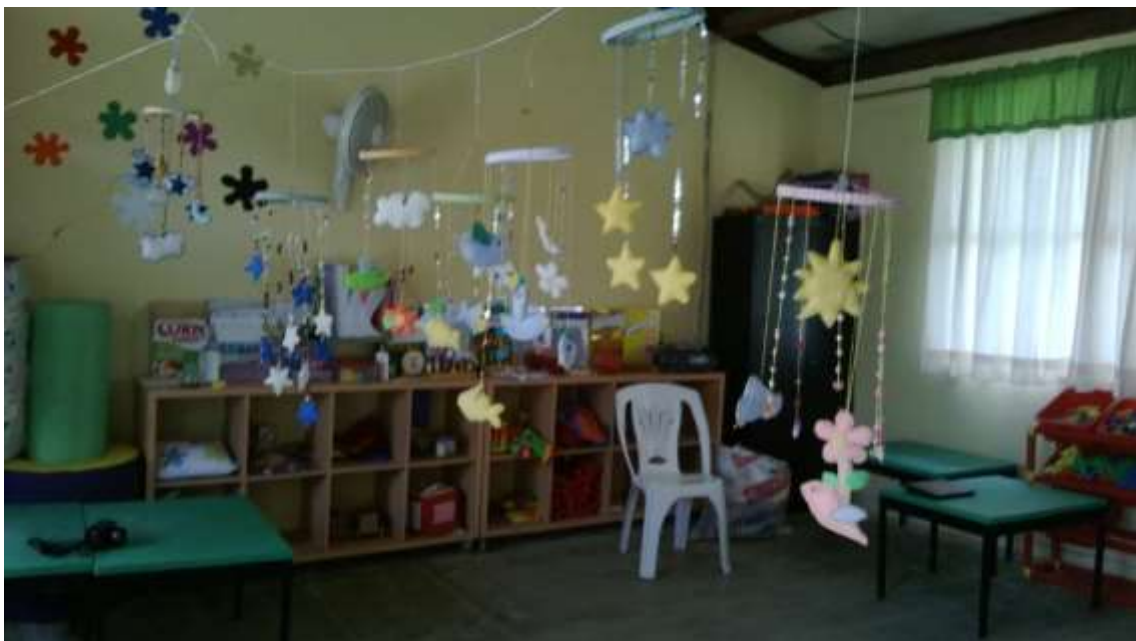
Anexo No. 14 Móviles elaborados por las madres de familia.