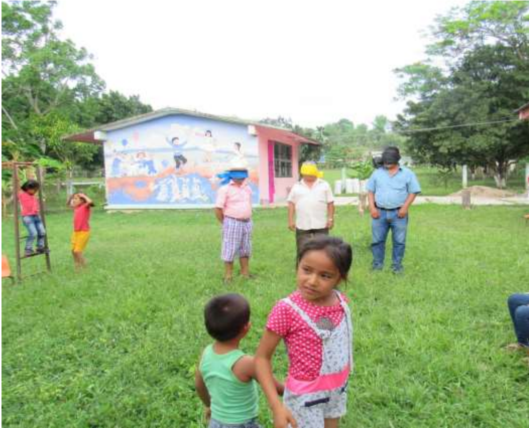
Anexo No.19 Actividad de la Patrogimnasia.