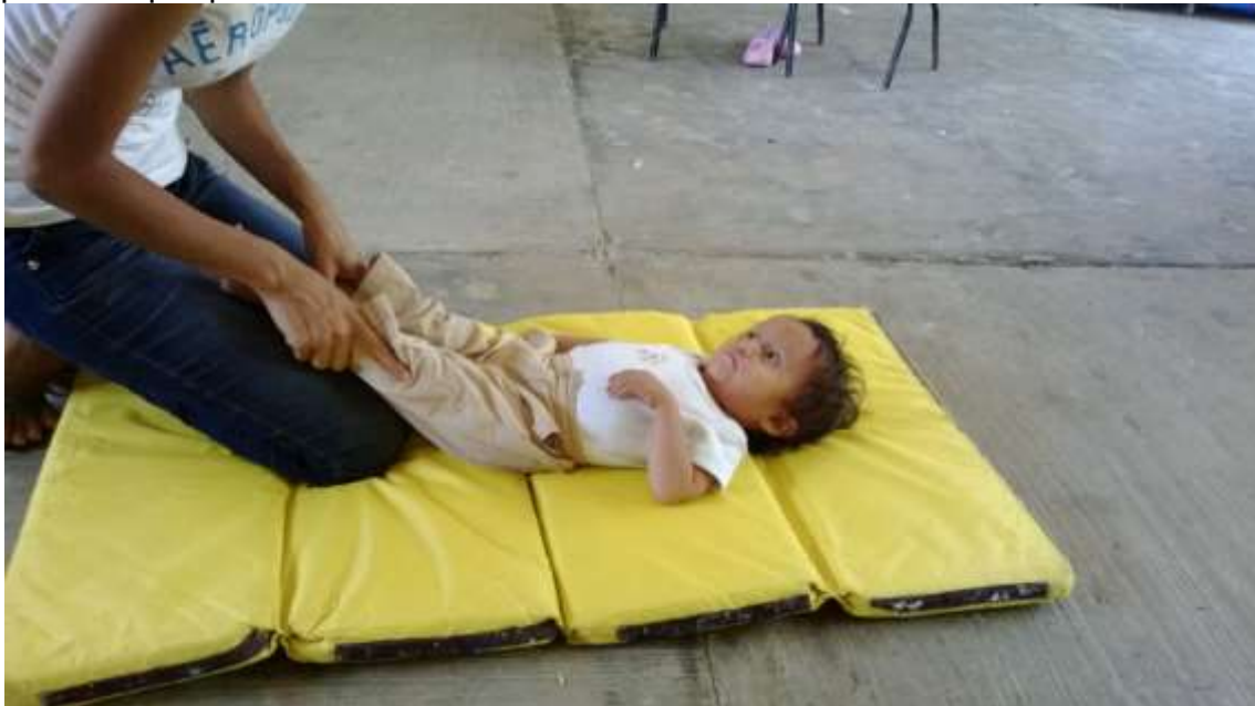
Anexo No. 9 Estimulación temprana a un infante.