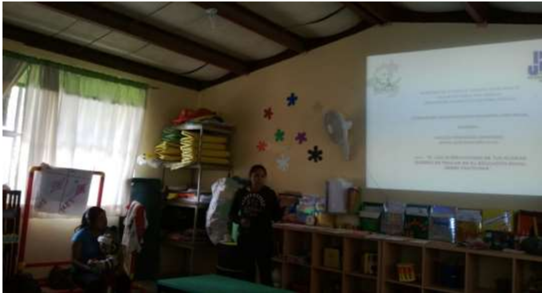
Anexo No. 4 Presentación del proyecto a las familias en el centro de educación inicial, a través de unas diapositivas que permitieron a las madres conocer el trabajo.