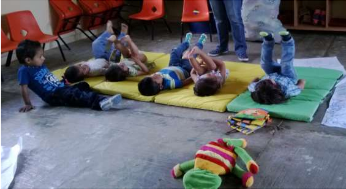
Anexo No.8 Realización de ejercicios para la estimulación a los niños y niñas de educación inicial a cargo de las educadoras, obteniendo respuestas positivas por parte de ellos.