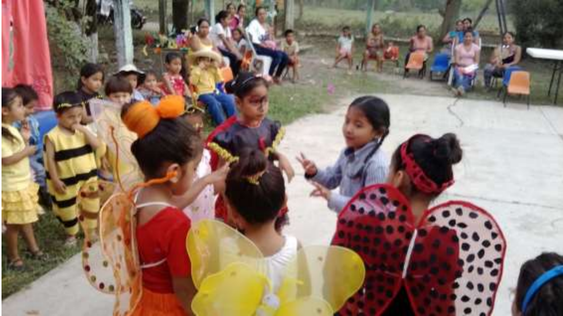
Anexo No. 11 Presentación de la obra de teatro con los niños y niñas de preescolar e inicial.