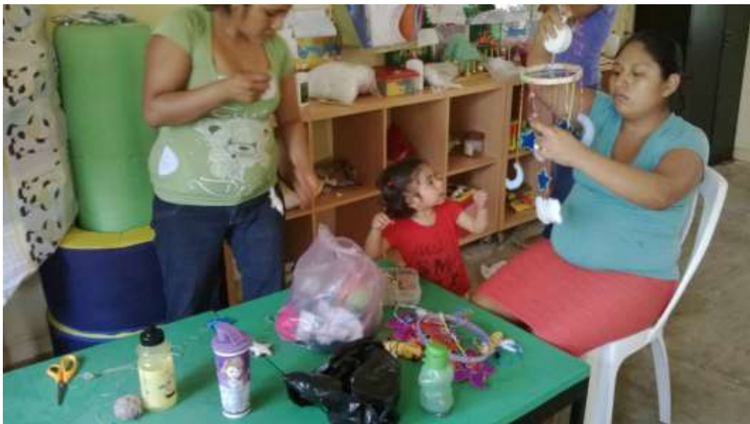
Anexo No.12 Elaboración de móviles con la participación de las madres de familia.