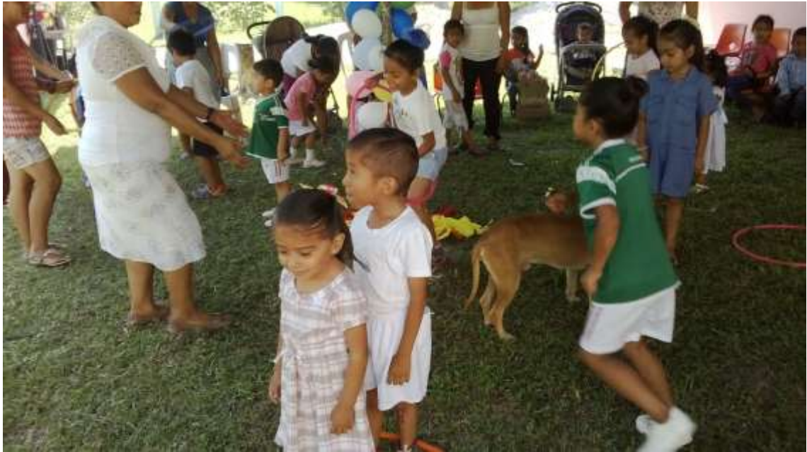
Anexo No. 17 Actividad de aros en la Matrogimnasia.