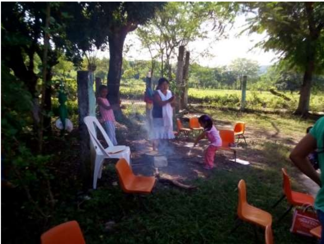
Anexo No.20 actividad "Día de campo"