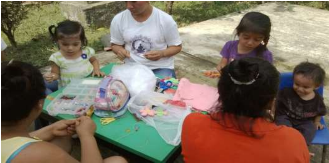
Anexo No. 13 Elaboración de móviles con la participación de las madres de familia.