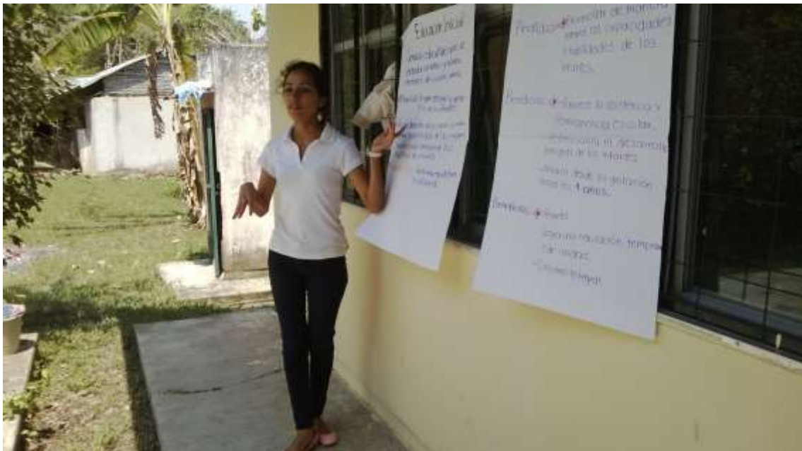
Anexo No. 5 Conferencia "conócame: soy la educación inicial", que se dio a conocer mediante láminas de papel bond, ya que ese día no hubo luz eléctrica.