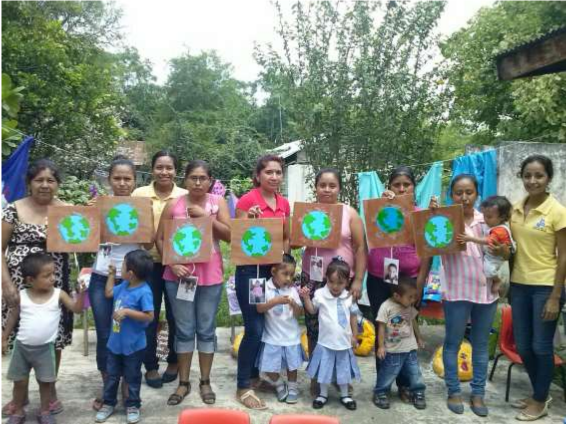
Anexo No.23 actividad "Cierre del taller".