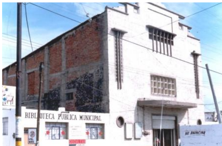
Biblioteca municipal (derecha) y teatro (izquierda)