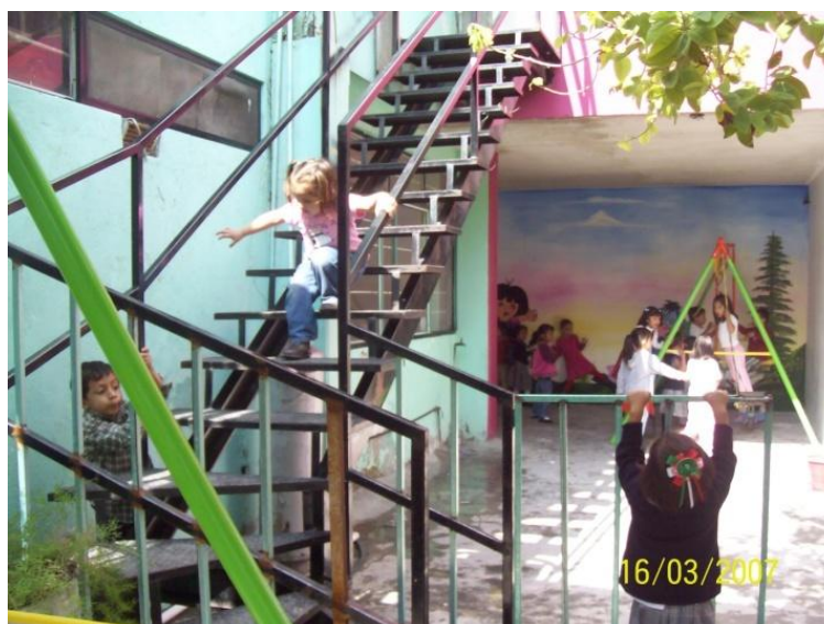
Escalera que tienen que acomodar por el riesgo que corren los niños al subirse en ella.