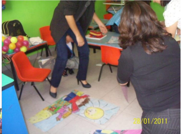
Maestras armando los rompecabezas gigantes