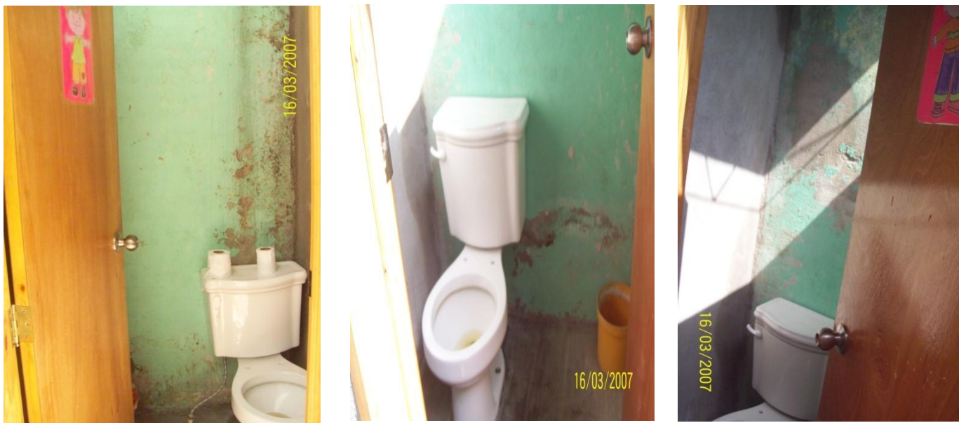
Baños de niñas (izquierda) y niños (derecha), uno por cada sexo