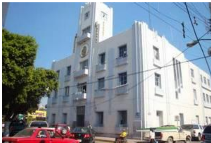
Presidencia Municipal de Mixquiahuala de Juárez Hidalgo