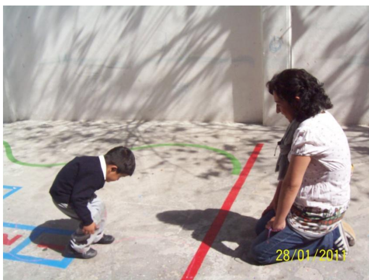
Las maestras en compañía de niños En la actividad de juegos grupales