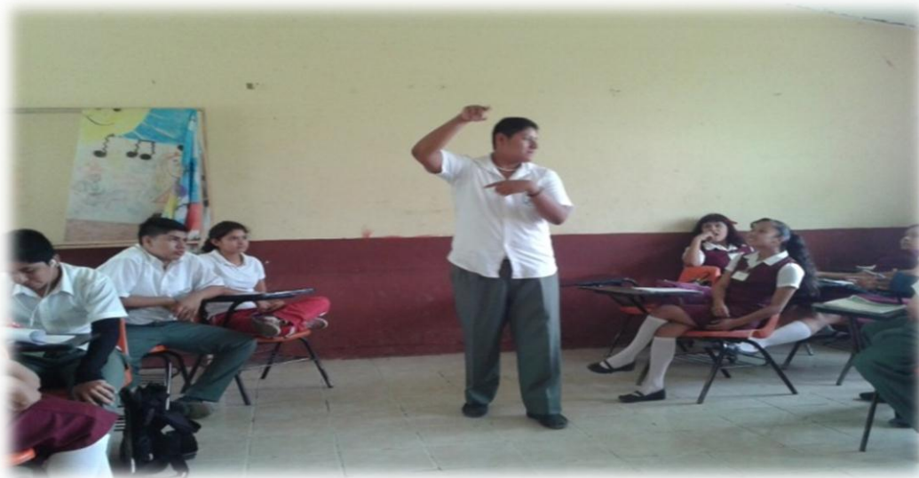
Anexo 11. Jóvenes que manifiestan mayor respeto en el grupo y con los docentes.