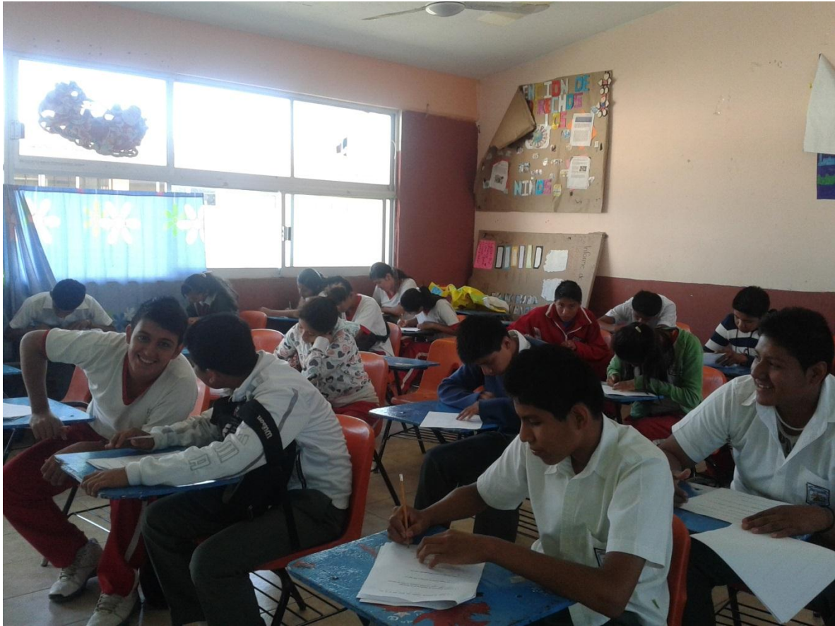
Anexo 12. Alumnos trabajando en equipo e interactuando de forma respetuosa.