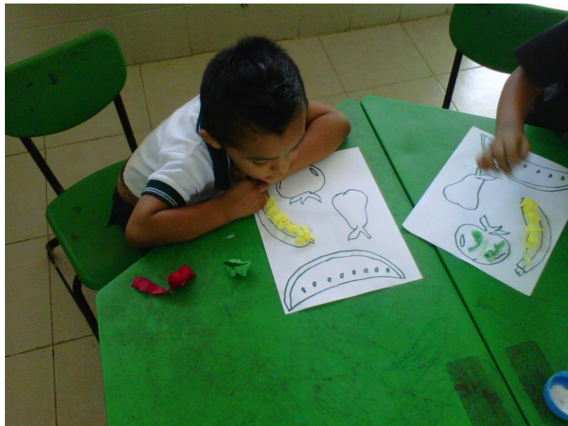
FOTO 5 RELLENADO FRUTAS CON PAPEL CREPÉ, ANTES DE PREPARAR LA ENSALADA DE FRUTAS