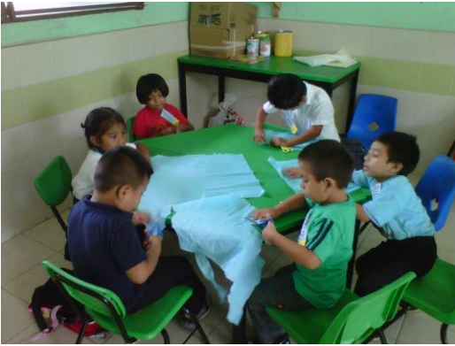
FOTO 1 Preparando el vestuario para jugar a la casita