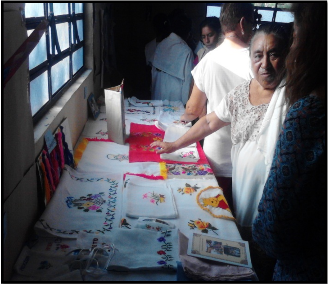
Foto 5: La exposición de las artesanías realizadas durante el curso taller.