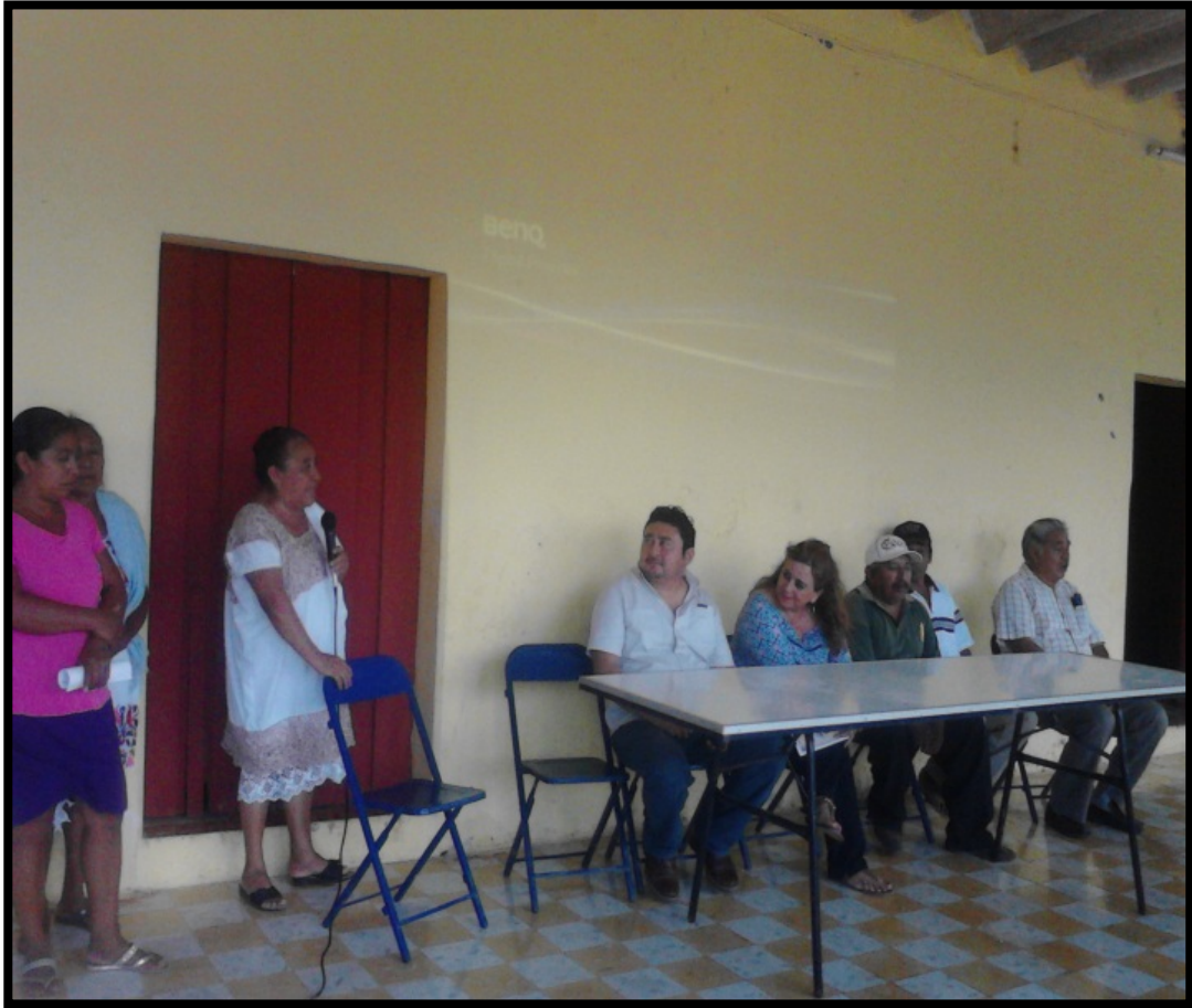
Foto 4: Durante la clausura del taller, “Unidas por el Xocbi chuy ” , las bordadoras alegres y con explicando lo importante que es para ellas realizar dicha actividad.