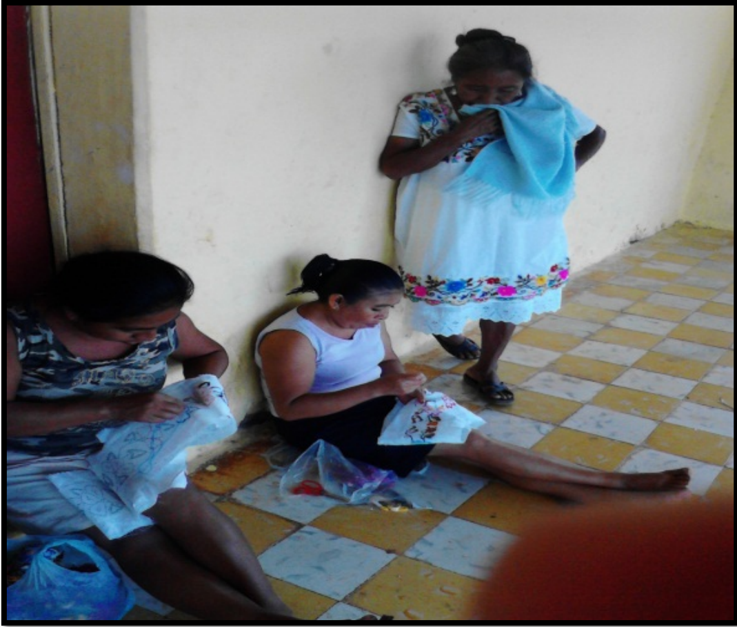
Foto 3: Las participantes realizando el Xocbi chuy , mediante cinturones para damas.