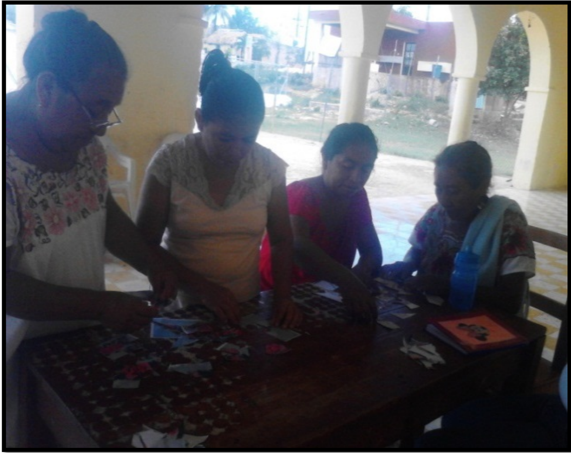
Foto 2: Grupo de mujeres realizando la actividad “Rompecabezas de bordados” con base a una cooperación grupal.