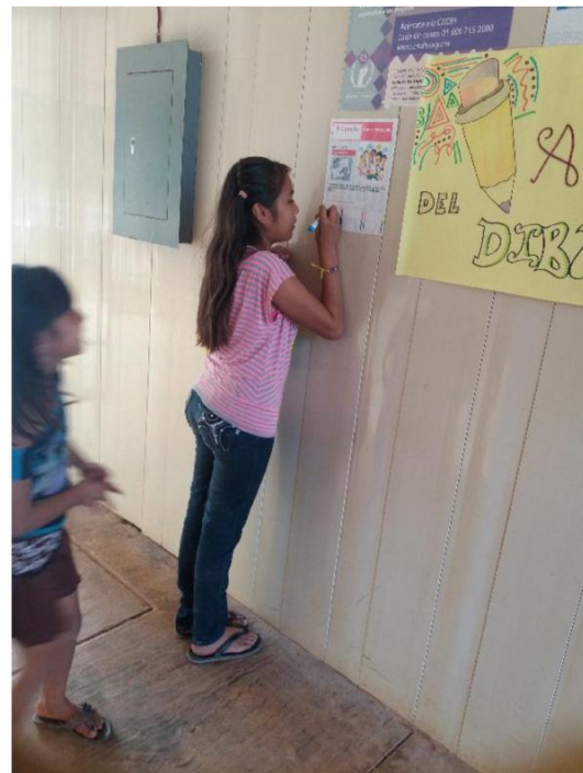
PRESENTACION Y PROMOCION DE LOS TALLERES.