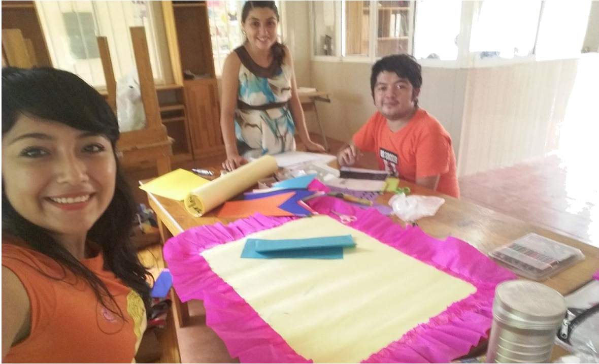
PREPARACIÓN DE MATERIAL DIDÁCTICO.