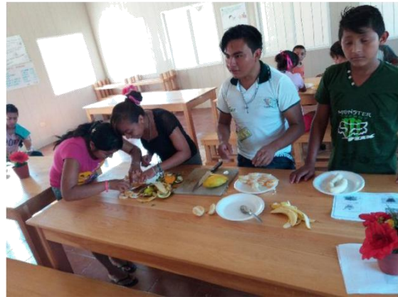
PROYECTO 2: RECETAS SALUDABLES.