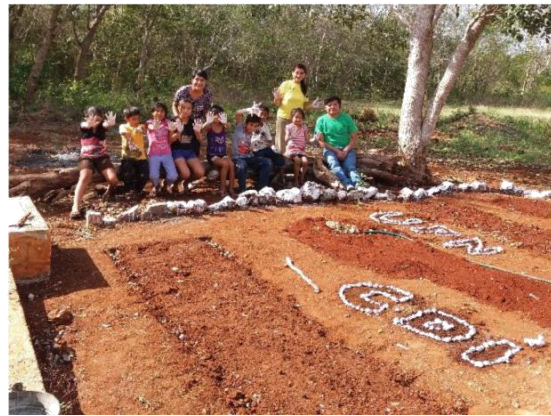
PROYECTO:CREADO MI HUERTO.