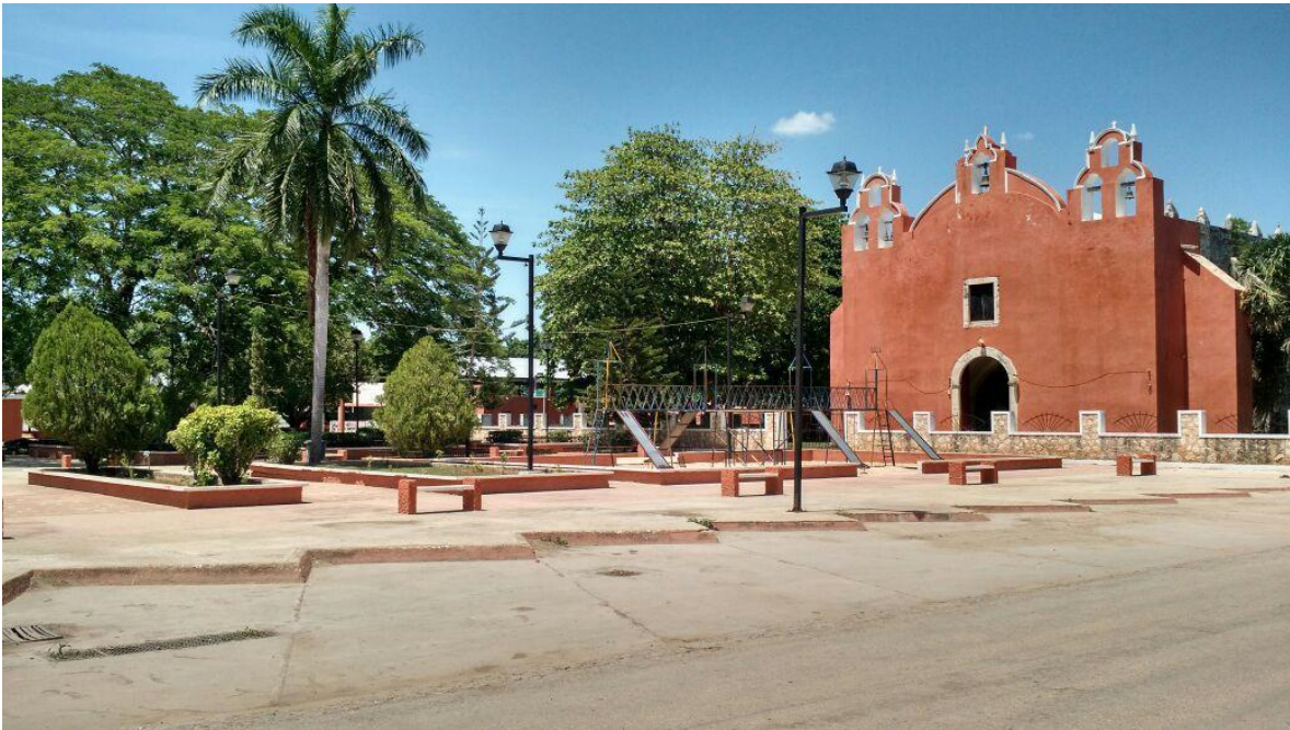
IGLESIA DE TIXMÉHUAC, YUCATÁN.