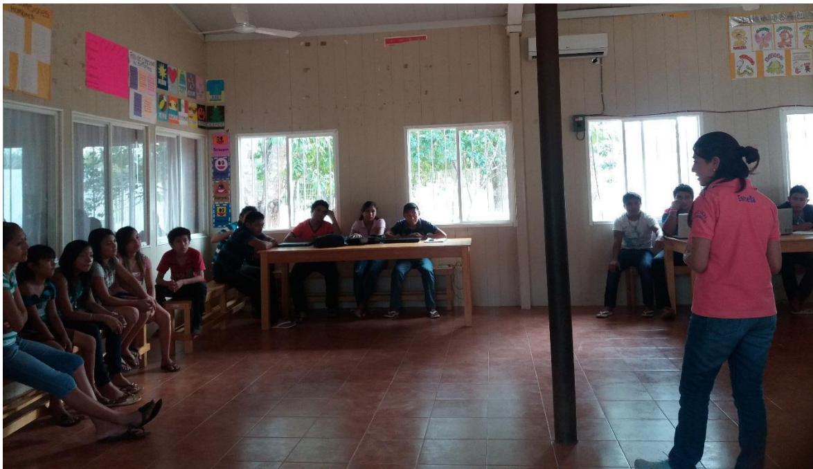
PLATICA SOBRE RESULTADOS OBTENIDOS DE LOS INSTRUMENTOS.