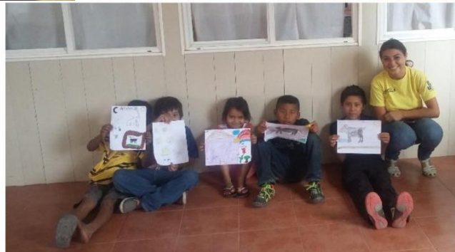
PROYECTO 3: EL ARTE DEL DIBUJO.