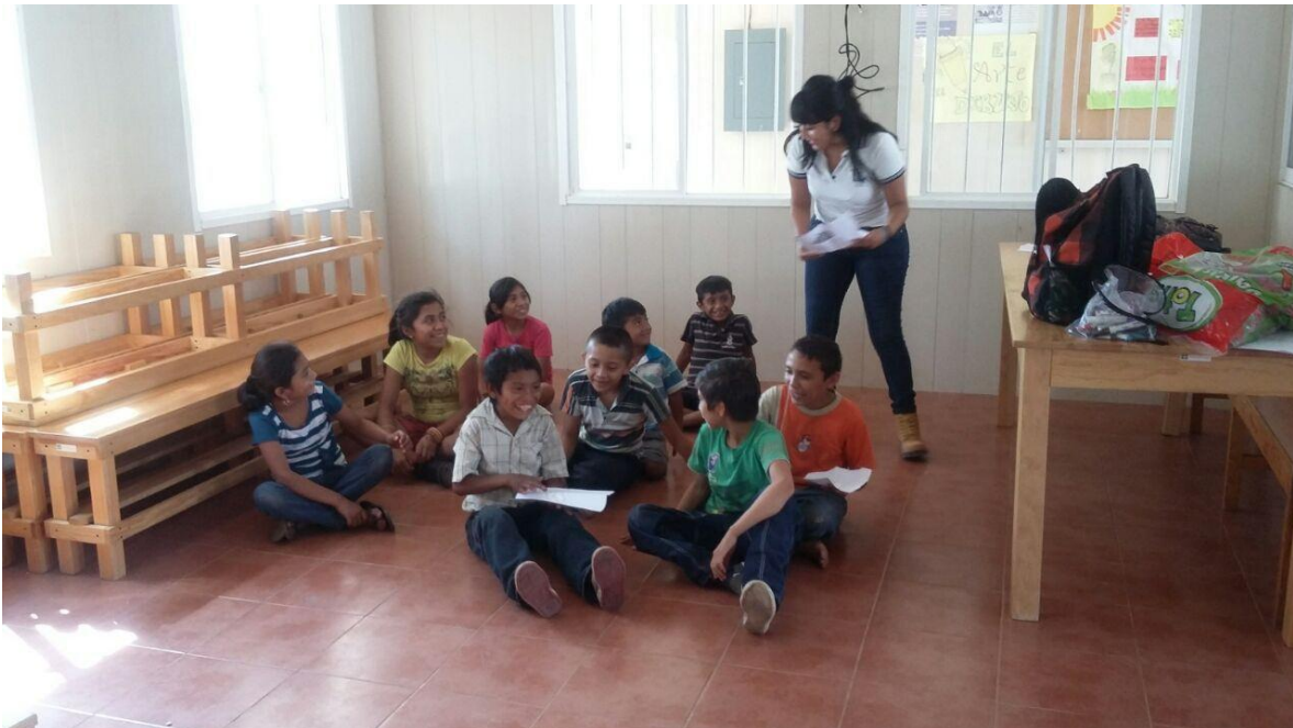
SOCIALIZACIÓN CON EL GRUPO DE PRIMARIA.