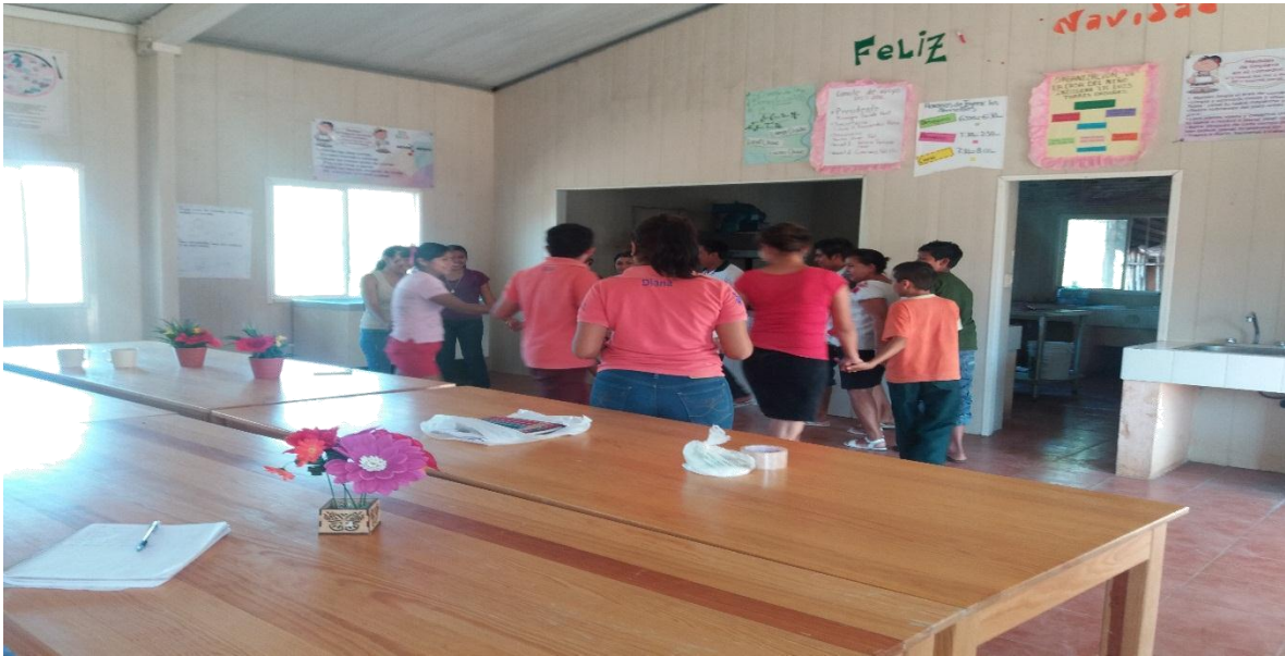
SOCIALIZACIÓN CON EL GRUPO DE PREPARATORIA Y SECUNDARIA.