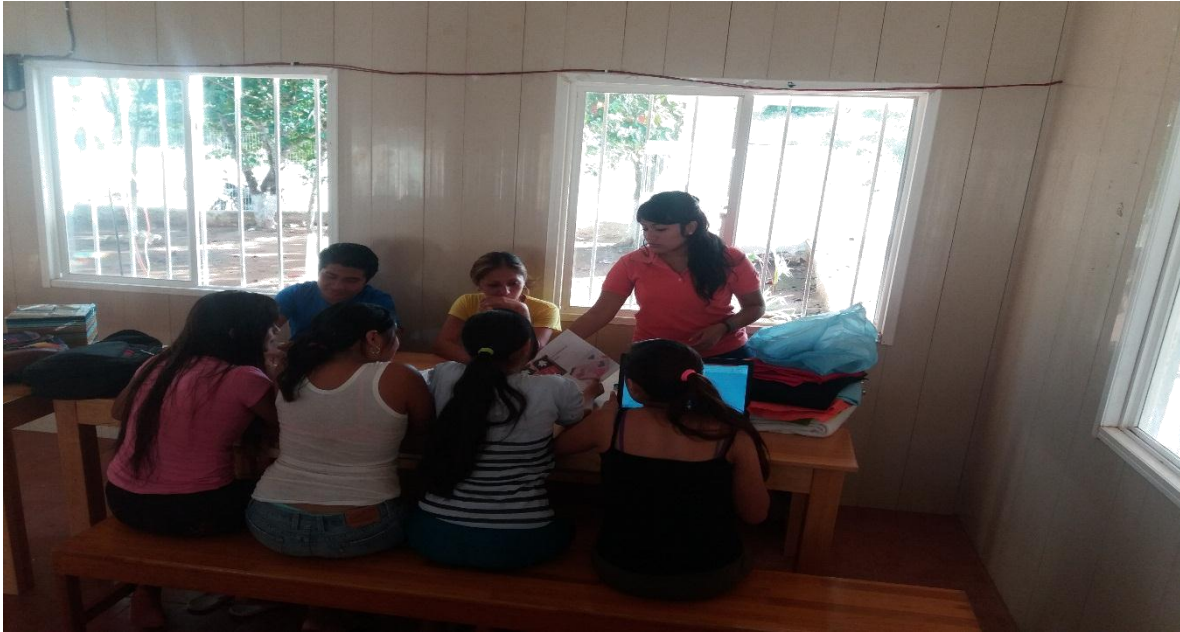
APLICACIÓN DE INSTRUMENTOS DE RECOLECCIÓN DE DATOS.