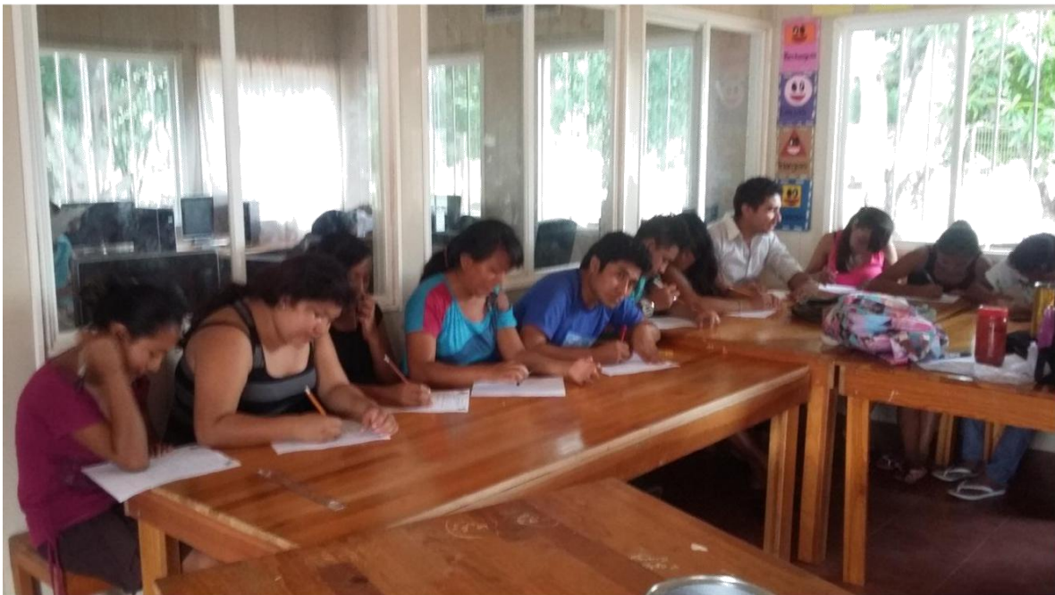
APLICACIÓN DEL DIAGNÓSTICO FOCALIZADO.