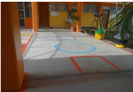
Pasillo hacia lactantes