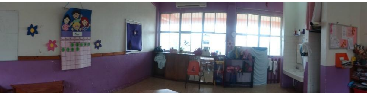
Salón Preescolar IB