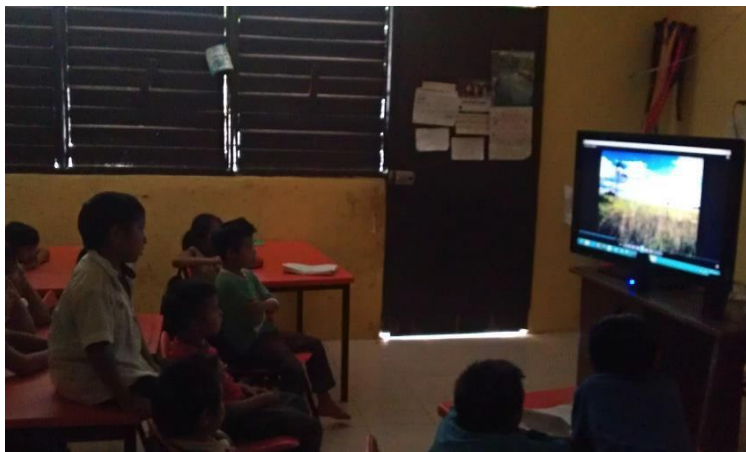
PRESENTACION DE AUDIOVISUALES INFORMATIVOS.