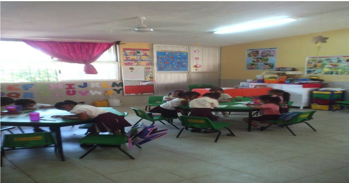
FIGURA 8. Realización de un cuento de su agrado.