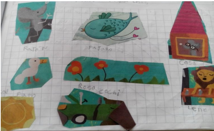
FIGURA 4. RECORTE DE LOS ANIMALES