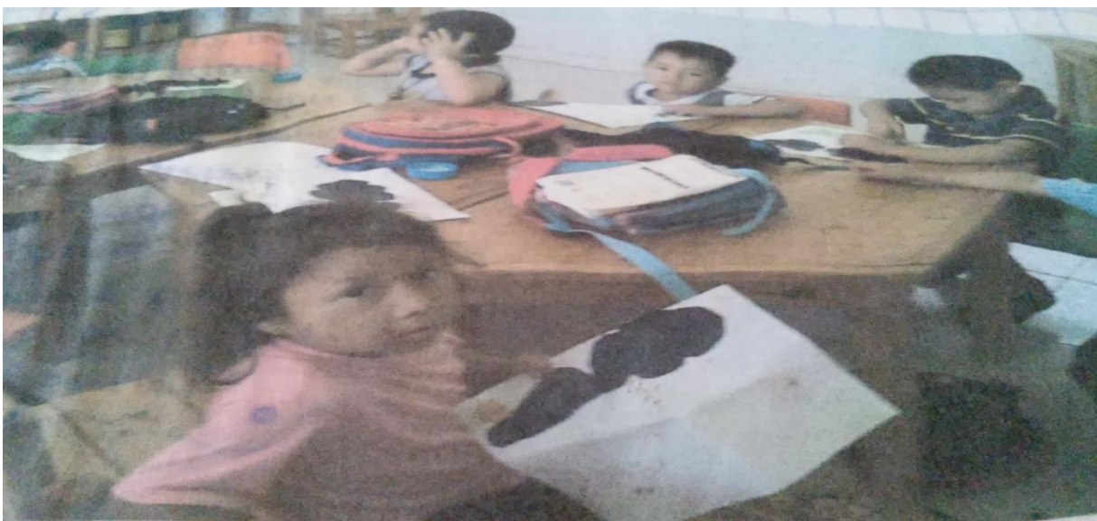
FIGURA 1 REALIZARON UNA CARTA DE MANERA LIBRE A S U MAMÁ