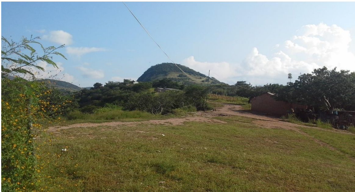
Comunidad de Lagunillas, Ahuacutzingo, Gro., en donde se ubica el Centro Educativo “Popocatepetl”.

En algunas comunidades carecen de servicios de luz eléctrica, servicios de drenaje, de agua entubada y potable, servicio telefónico, de salud, entre otros, por lo que los docentes tienen que acomodarse y adaptarse a cualquier situación en la que se viva en la comunidad y ejercer su oficio eficientemente a pesar de las condiciones que tenga la comunidad.