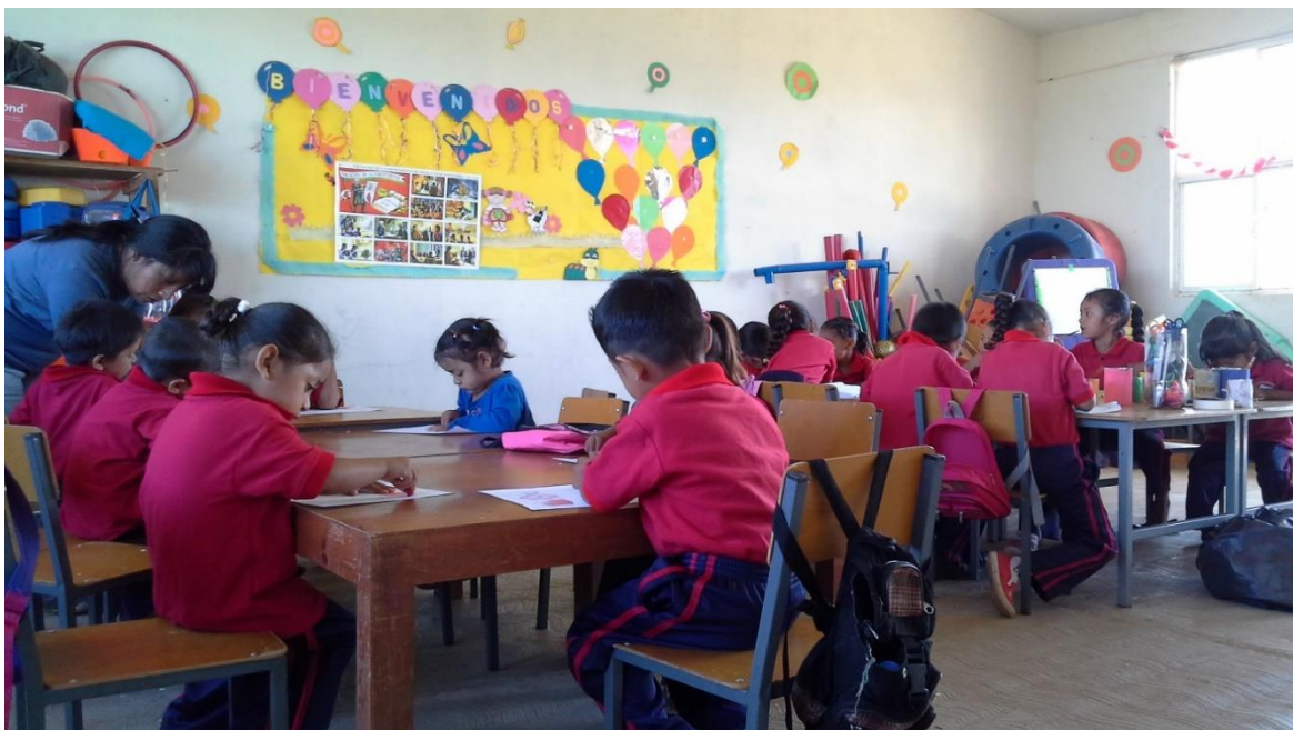
Aula del Centro Educativo "Popocatepetl" (Foto tomada por Mercedes Millan Tomatzin el 03/10/2016).

La maestra al empezar a explicar los temas que se verán durante la clase, empieza dando ejemplos del tema de acuerdo a las cosas o vivencias del contexto en el que se encuentran, es decir que parte de lo particular a lo general al momento de abordar cada tema, utilizando lo que tenga a su alcance dentro y fuera de la escuela para explicar, de manera que los niños puedan comprender y aprender. Es evidente que la maestra ha logrado establecer una buena relación con sus alumnos y que los alumnos participan en las diferentes actividades.