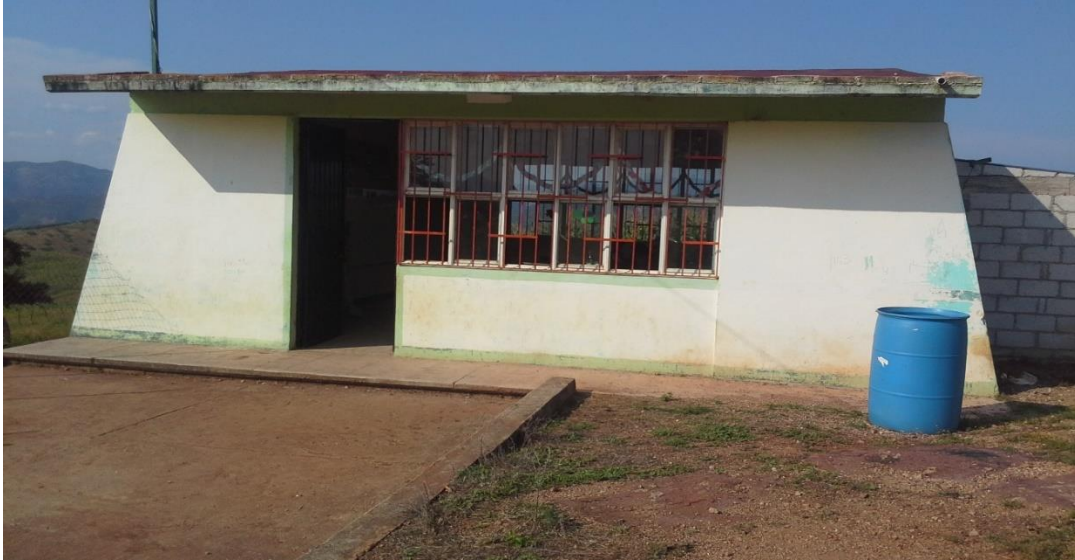
Centro de trabajo de la maestra Catalina: Preescolar indígena: “Popocatepetl” de la comunidad de Lagunillas, Ahuacutzingo, Guerrero. (Foto tomada por Mercedes Millan Tomatzin el 03/10/2016).

Cuando los alumnos llegan al salón de clases comienzan la jornada cantando cantitos que la maestra les enseña para motivarlos a participar por medio de la oralidad, en este caso por medio de los cantos que memorizan porque les gustan, ellos mismos eligen los cantos que quieren cantar cuando la maestra les pregunta antes de comenzar la clase.