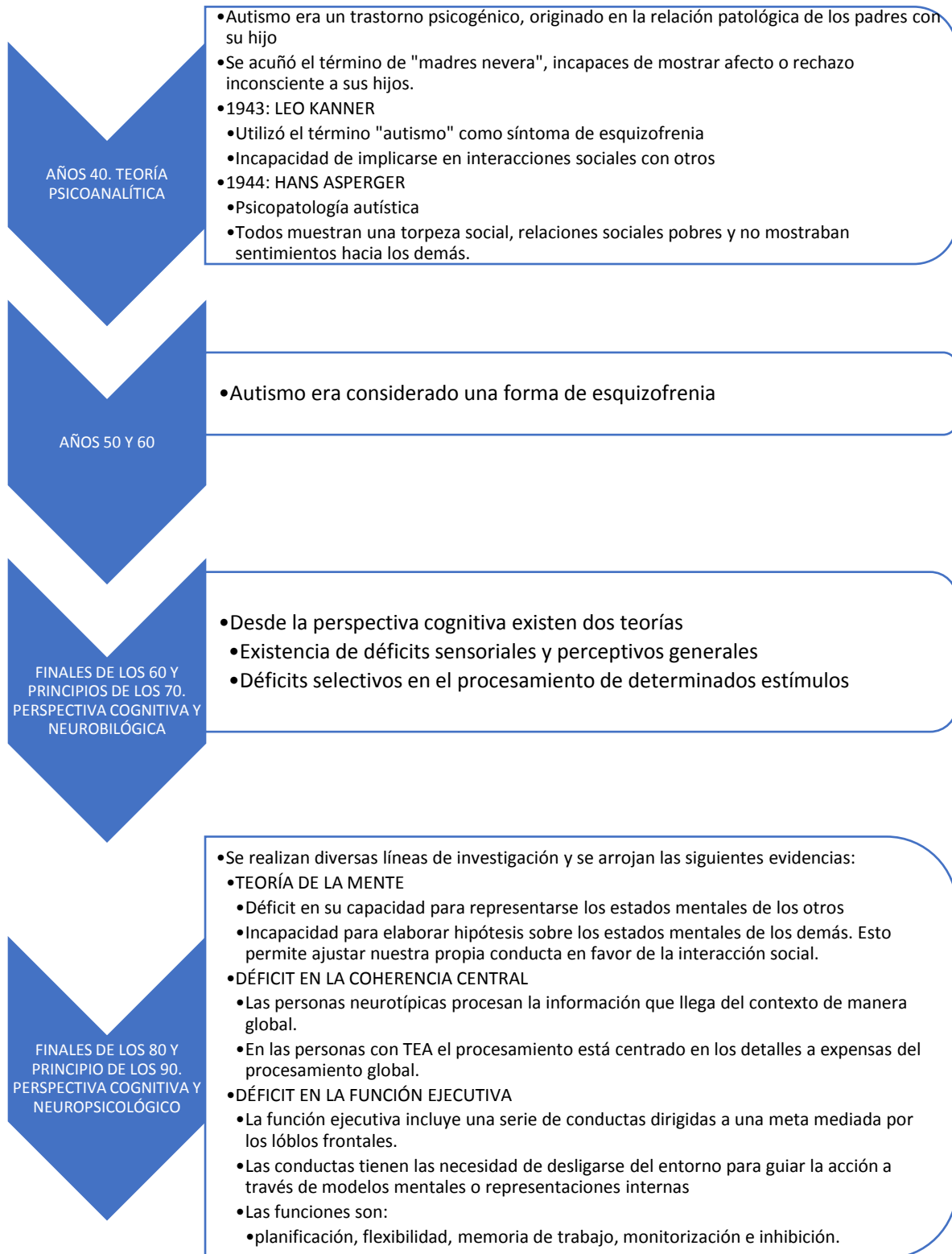
FIGURA 1. Antecedentes del TEA. Martínez M. A. y Cuesta J.L. (2013) Todo sobre el autismo