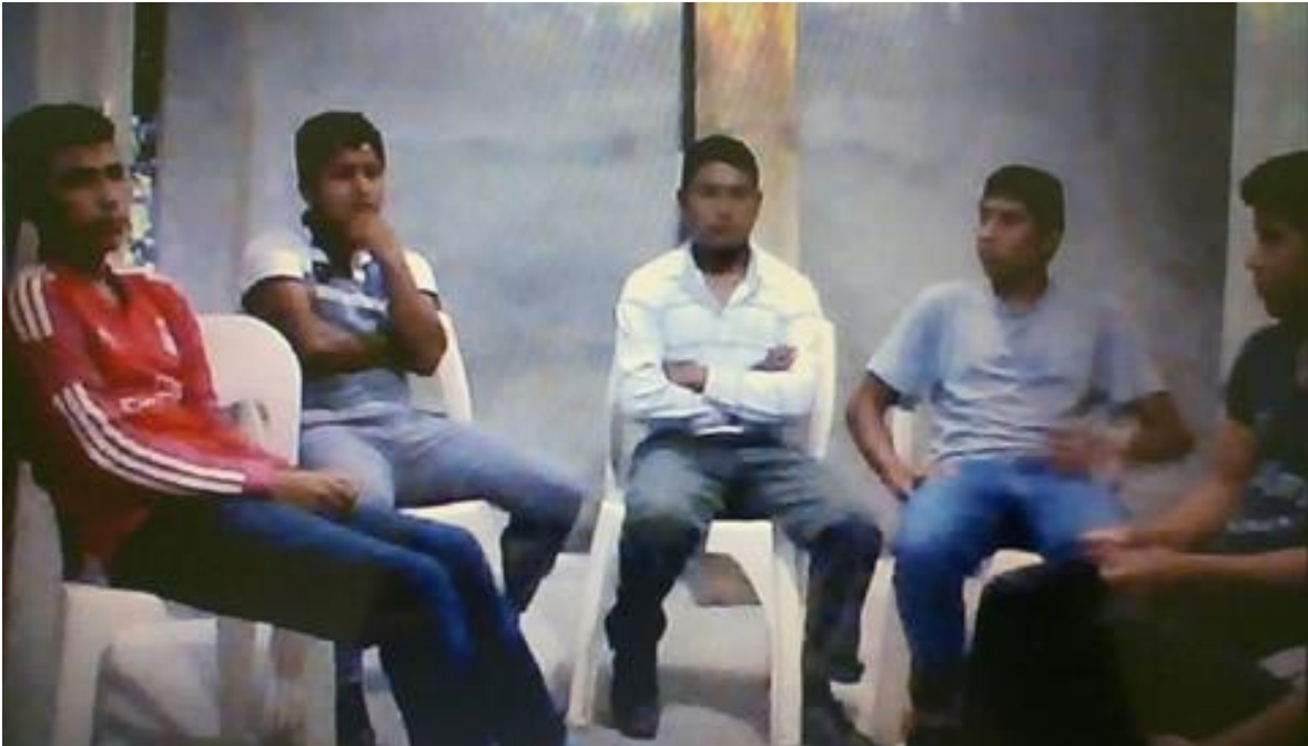
Grupo de discusión con jóvenes hombres de 15 a 18 años de edad, fecha: 29/09/2016