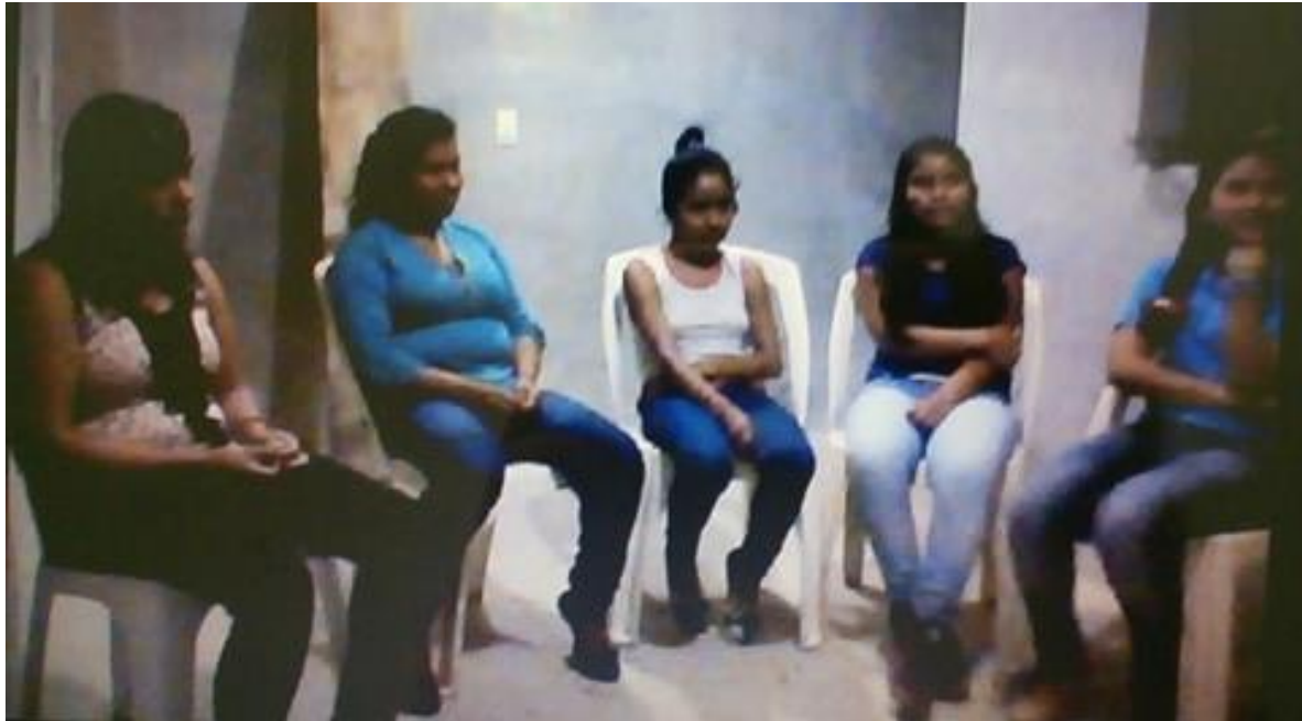
Grupo de discusión con mujeres jóvenes de 15 a 18 años, fecha: 4/10/2016