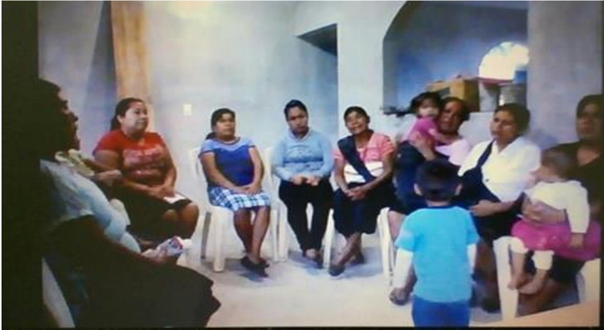
Grupo de discusión con madres de familia de 18 años en adelante, fecha: 6/10/2016