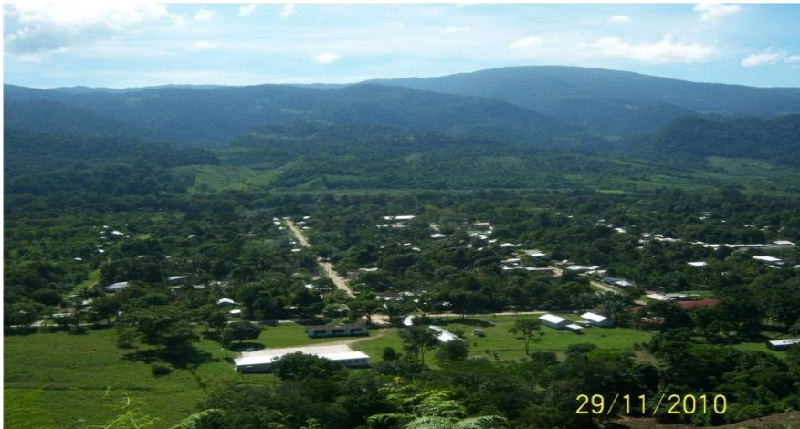
Foto 2: La comunidad de San Jerónimo Tulija. Fotografía tomada por Juan Hernández Gómez el 29 nov. 2010

En la actualidad, la población cuenta con aproximadamente entre 3000 a 4000 habitantes incluyendo niños, jóvenes y adultos (INEGI, 2005). Las familias de esta comunidad viven en hogares indígenas; casas que son construidas con maderas y el techo cubierto con láminas. Pero hoy en día varias de las familias ya cuentan con casas hechas de concreto.