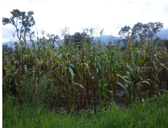
Foto: San Jerónimo Tulija por Pedro Gutiérrez Arias, septiembre 2015

La situación social en la que se encuentra la comunidad indígena tzeltal. Es que la mayoría de sus habitantes viven en un nivel económico bajo, hay pocas oportunidades de progreso en el ingreso económico, lo cual también impide que los hijos puedan progresar en el ámbito escolar.