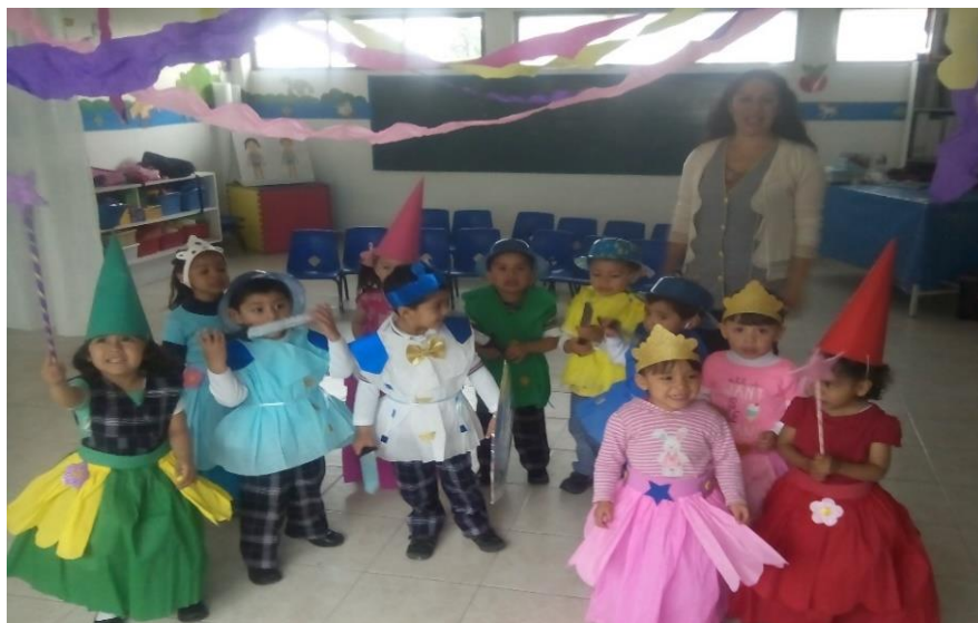
Figura 1 Fotografía de cierre de presentación de la obra “La bella durmiente”