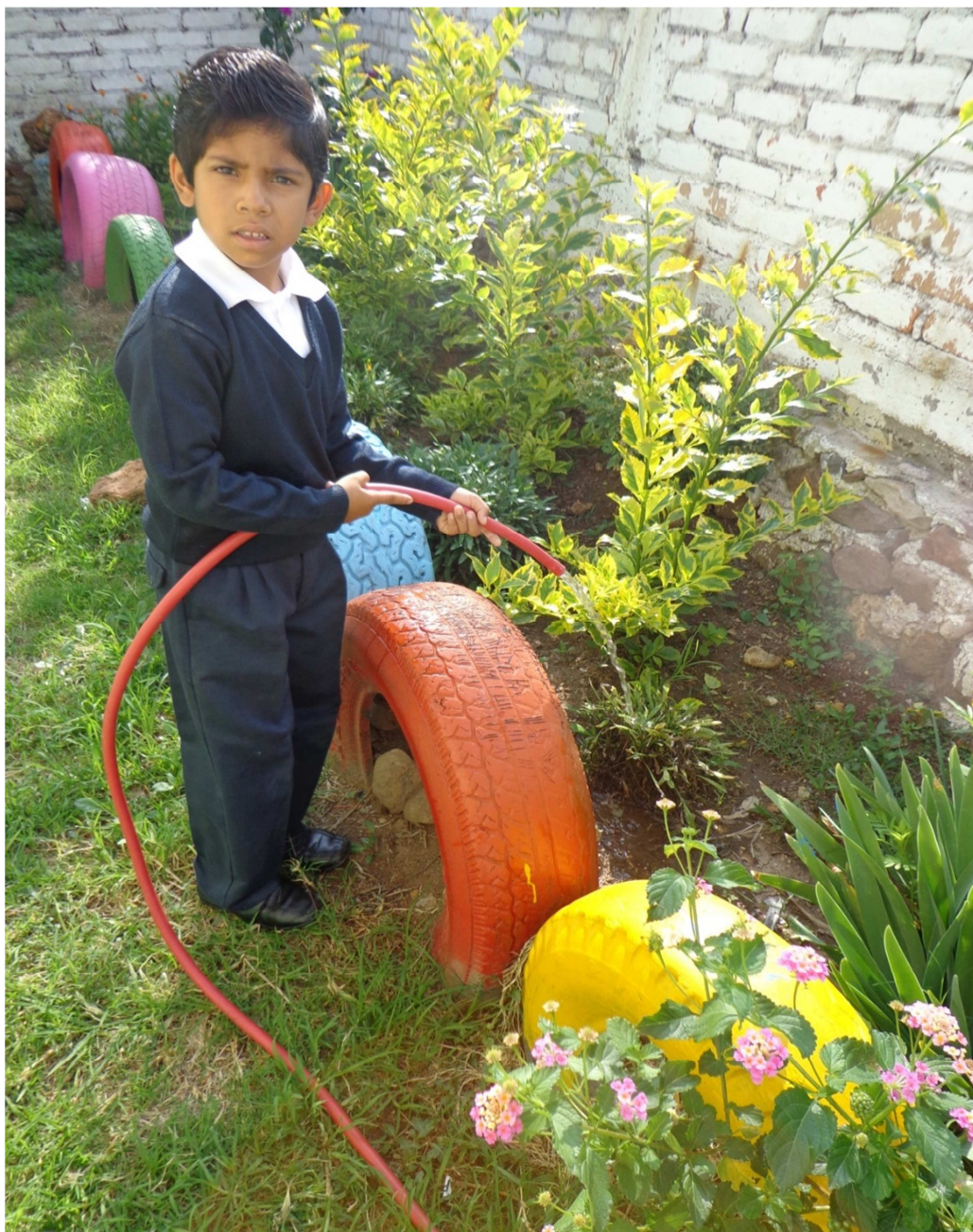
Cuidado de la naturaleza.