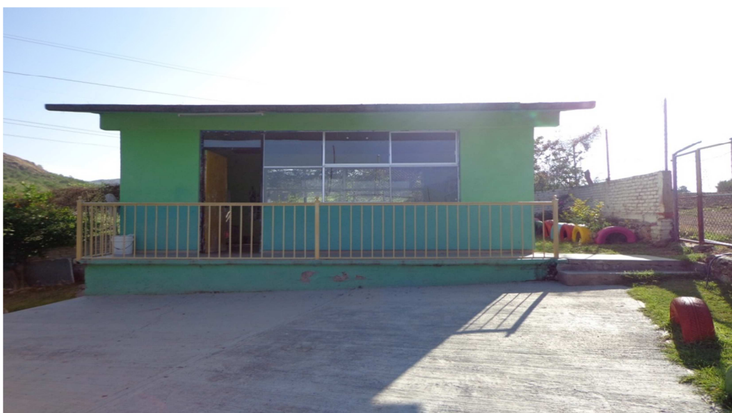
Jardín de Niños