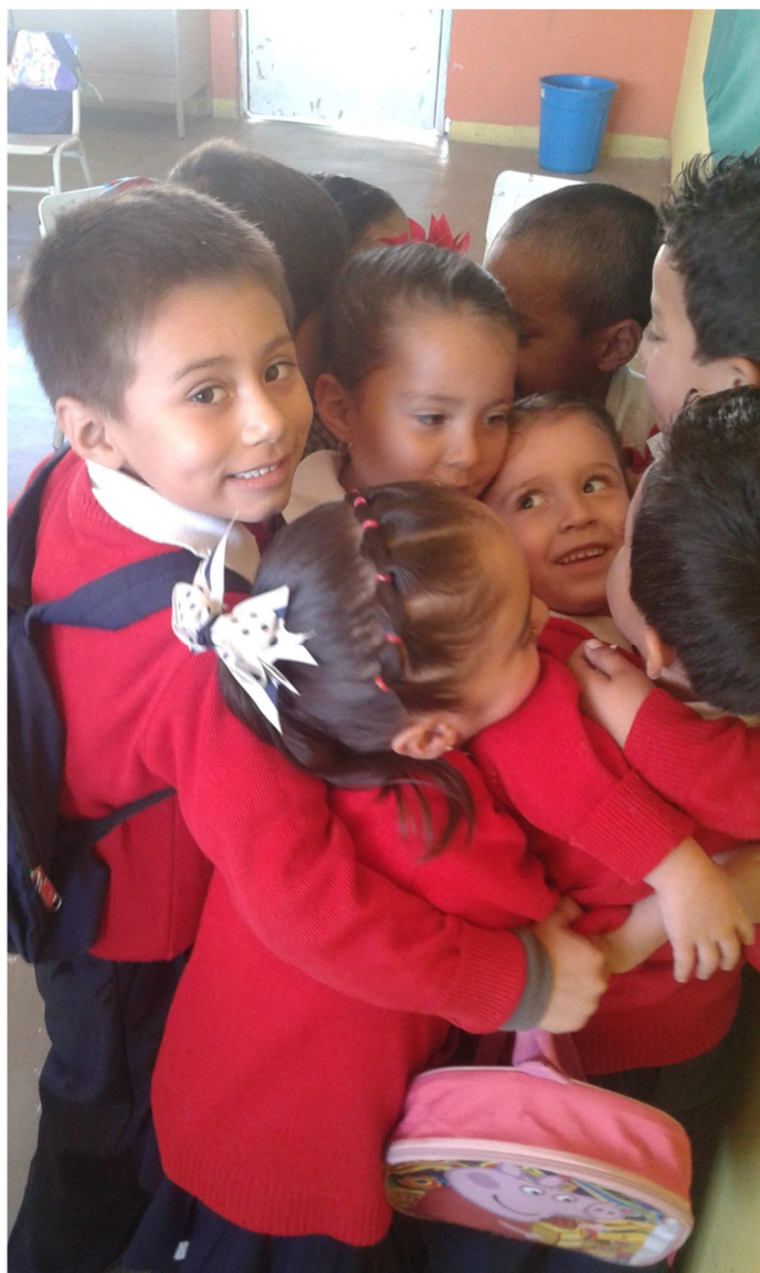
Integración del proyecto.