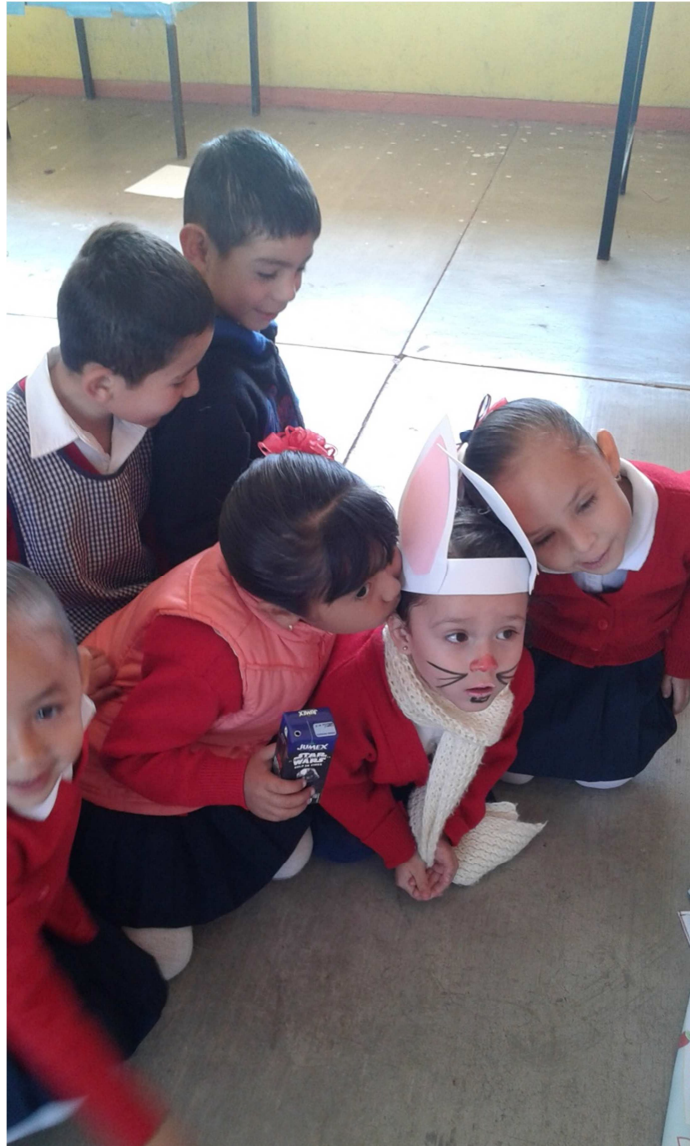
Respeto a los animales.