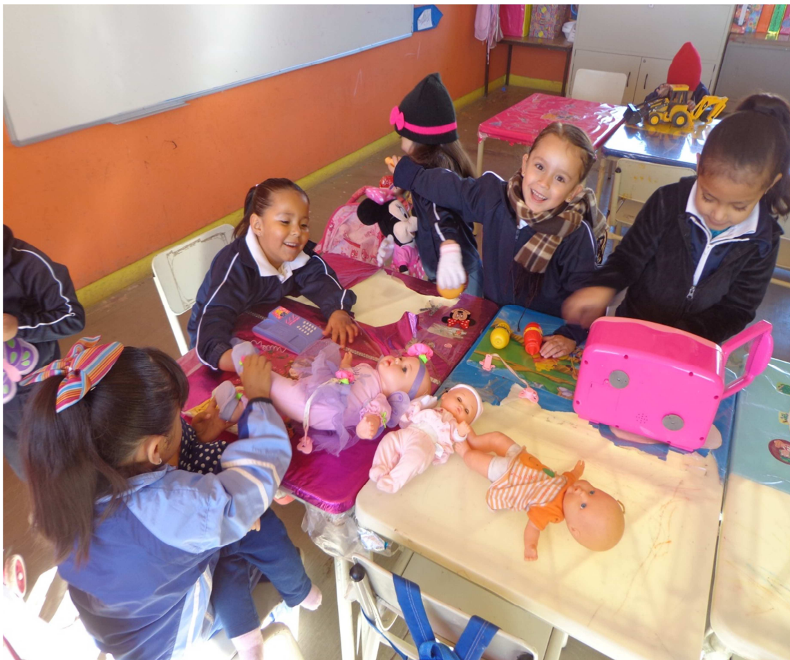
Respeto a la propiedad ajena.