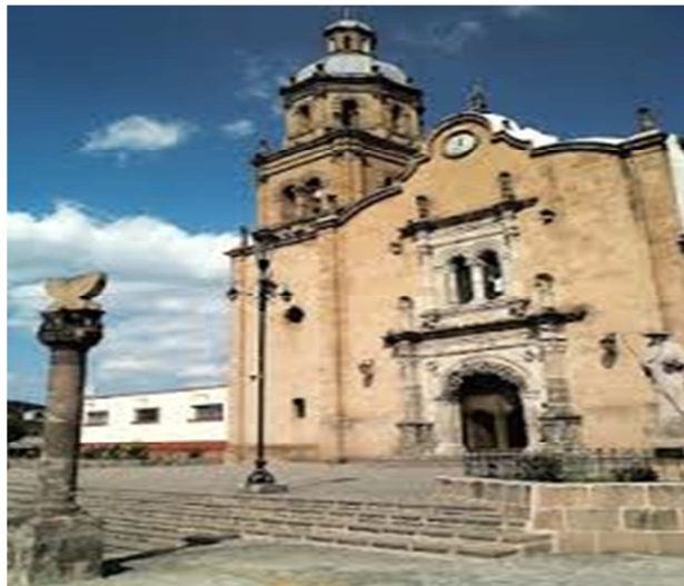
Templo de Santa Ana en Zacapu Michoacán.

Por lo anterior Zacapu es considerado como el primer asiento de la raza tarasca, que más tarde poblaría todo lo que hoy es Michoacán, parte de Guanajuato y Querétaro.