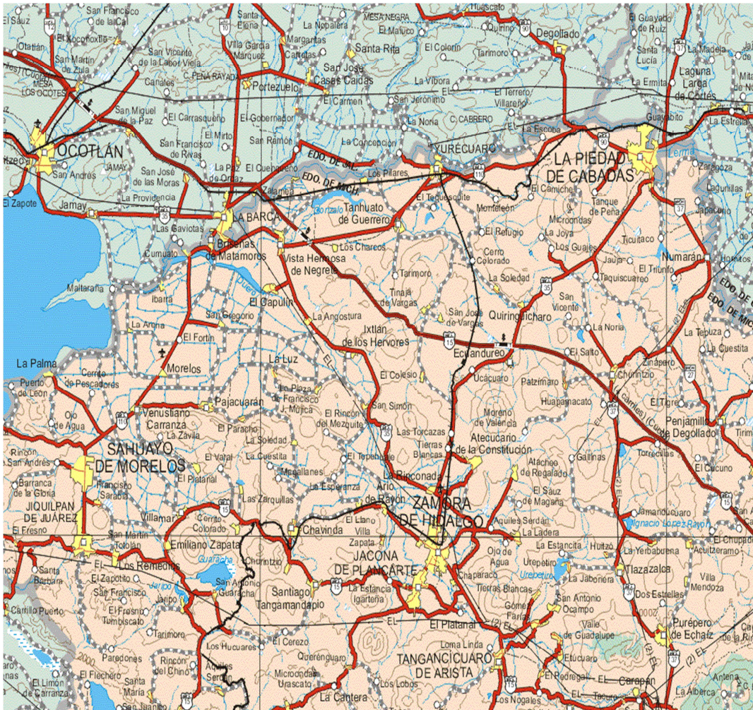
ANEXO 1. Mapa de La Piedad y sus alrededores.