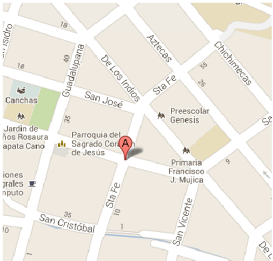
ANEXO 3. Mapa de la colonia Santa Fe donde se encuentra ubicado el Colegio Génesis