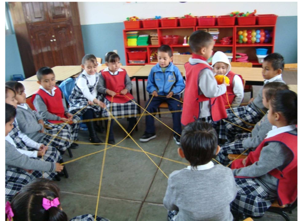
ANEXO 5. Fotografías de actividad de la telaraña.