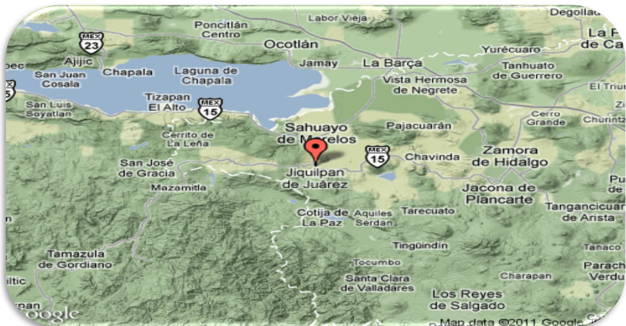
Mapa ubicando Jiquilpan Michoacán