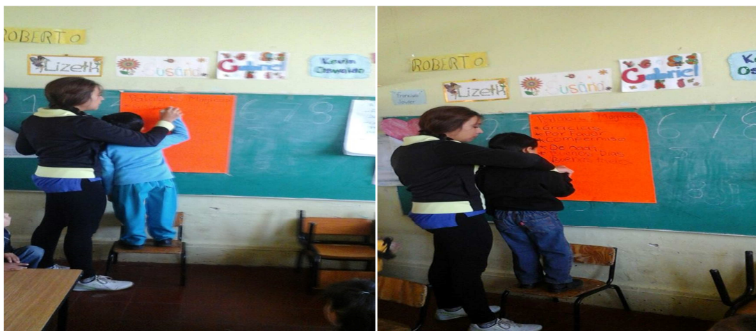
Imagen# 10 y # 11; en donde se muestra como los niños están pasando a realizar las palabras mágicas en la cartulina para que fuera más tentador para ellos y las supieran respetar 7/10/2014.