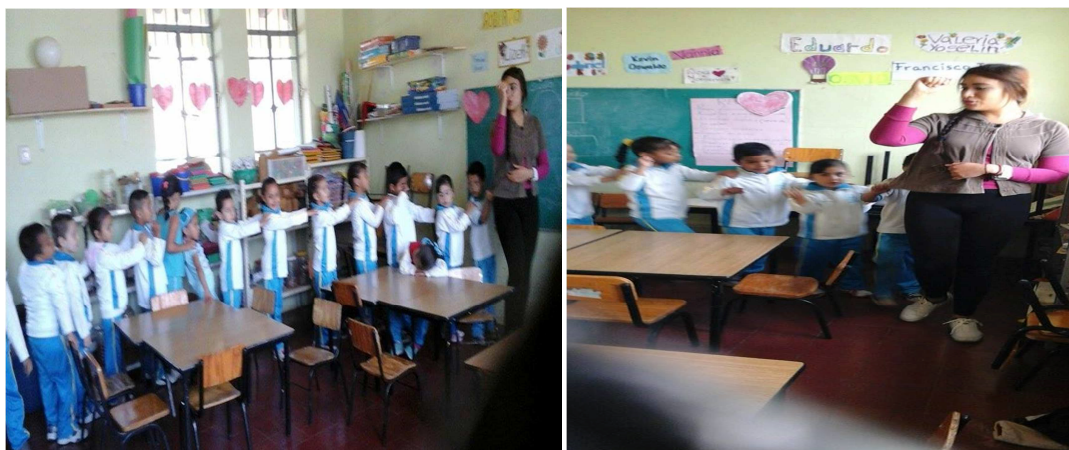
Imagen #17 y #18; en donde se muestra como los niños están formados creando un tren y con su mano derecha arriba que era con la que se le daba marcha al tren para que avanzara.3/12/2014.

Y una de las estrategias de esta categoría de la feria de los juegos y emociones es la del juego del “tren” porque es un juego que se encuentra en las ferias y se realizo como si estuvieran arriba del juego para poder sentir la misma emoción que cuando si se está, así es que primeramente se les dijo que iban a hacer una fila detrás de la educadora para formar un tren y después de ya estar todos formados empezaron a calentar motores y se subía la mano derecha que era con la que le se iba haciendo “chu-chu-chu” e iban dando vueltas por todo el salón subiendo gente que se quisiera pasear como cuando se juega al elefante que se columpia, en donde se va recogiendo gente hasta que se hiciera el tren de todos los niños del grupo, y se agachaban y se levantaban para que fueran las subidas y bajadas del juego de la feria. Realmente fue un juego en donde los niños supieron esperar su turno hasta que les tocara subirse al tren y así como también fue una estrategia en donde respetaron las reglas del juego, pero lo más importante fue que sintieron emociones sociales y personales.