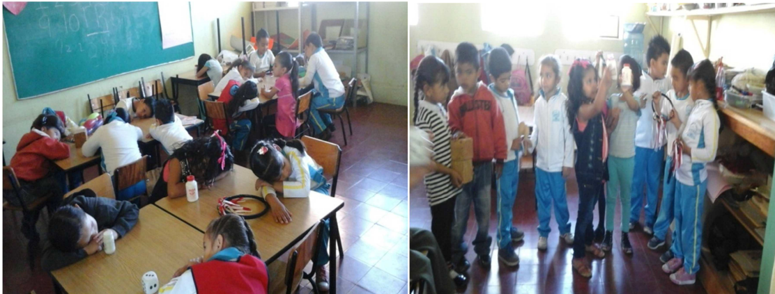
Imagen #13 y #14; en donde se muestra como todos están con los ojos cerrados esperando a que se les repartiera el materia, así como también se ve cuando ya encontraron a su pareja que tenía el mismo materia que el. 04/11/2014.

sus actitudes eran positivas, que era una de las cosas que se quería de las estrategias que socializaran con niños con los que no se asociaban mucho, para ver cuál era ese comportamiento hacia compañeros distintos a con los que convivía mas.