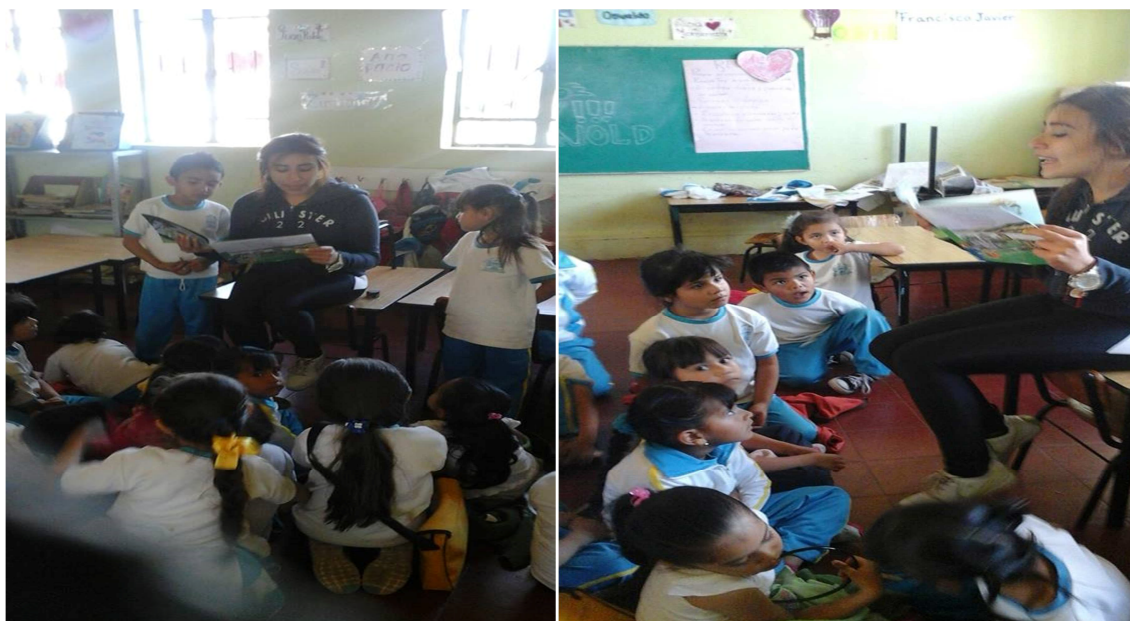
Imagen # 4; # 5; #6 y #7; aquí se muestra como todos los niños están prestando atención para cuando se socializara y se les realizaran las preguntas acerca del cuento supieran contestar y obtuvieran el premio, y en las imágenes de abajo se muestra como están participando los niños. 17/09/2014.

de haberles contado el cuento se iba a socializar todos juntos y los que contestaran todas las preguntas que se les iba realizando obtendrían un premio, lo cual fue una estrategia de muy buen resultado, en donde las evidencias se mostraran en las siguientes imágenes.