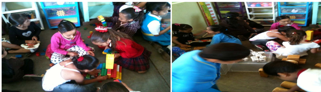
Imagen #21 y #22; en donde se muestra como los niños están jugando con material de construcción y como se están ayudando unos con otros a formar cosas y en donde también están socializando unos con otros. 11/12/2014.

asimismo el material de ensamble, porque con ese material ellos siempre tratan de construir carritos o robots, los cuales se las tienen que ingeniar para ver cómo es que van a realizar la figura. Y fue una estrategia en donde compartieron instrumentos didácticos y se ayudaron unos con otros a construir las cosas que pretendían hacer.