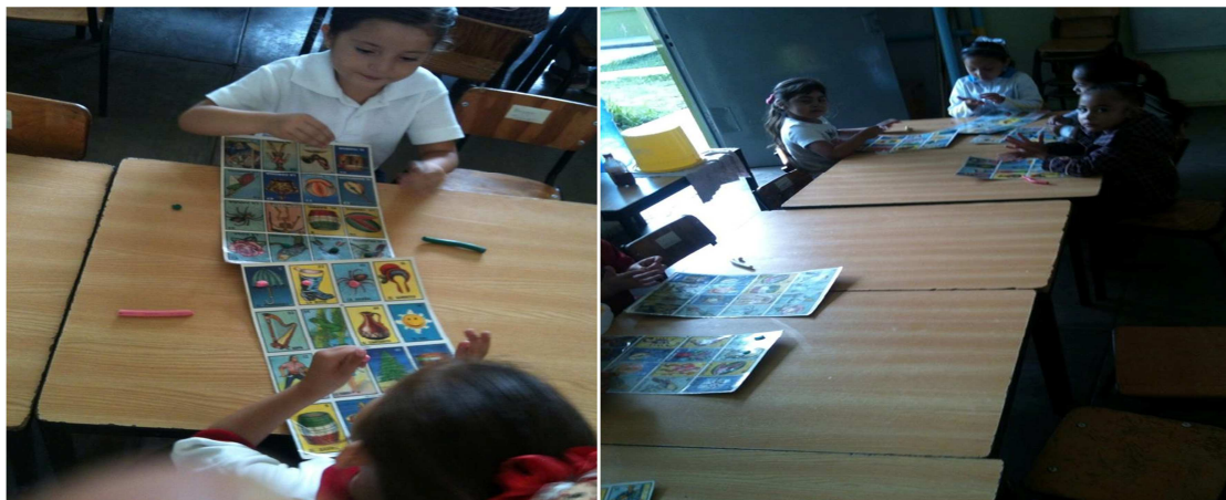
Imagen #15 y #16; en donde se muestra como los niños están realizando las bolitas de plastilina primero para con ellas apuntar y después en donde están atentos buscando la figura o esperando a que diera otra carta. 06/11/2014.

esperaron a que todos sus compañeros acabaran de realizar sus bolitas de plastilina y poder empezar ahora si el juego.