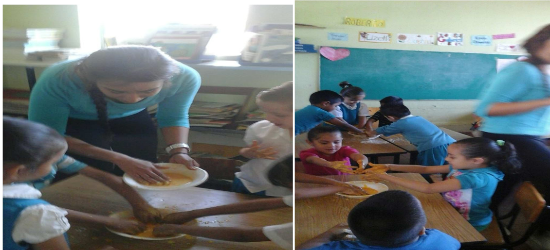
Imagen # 8 y # 9; en estas imágenes se muestra como todos los niños están trabajando por equipos y están socializando entre ellos mientras se iba pasando por las mesas para explicarles la reacción de la masa mágica. 25/09/2014.

la masa mágica. Y una de sus habilidades sociales fue la de cooperación ya que, tuvieron la capacidad de colaborar con los demás para poder llegar al objetivo que se les estaba pidiendo sin necesidad de agredirse.