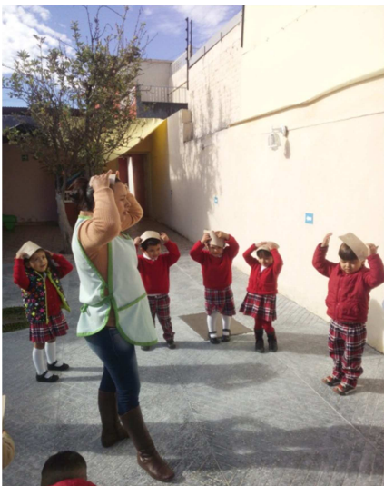
Indicaciones para realizar el juego.

Evaluación: El objetivo se logró en un 97%, los alumnos ayudaron a sus compañeros en cada momento el 3% no logró.