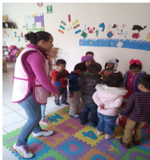
Atraparon a una oveja.