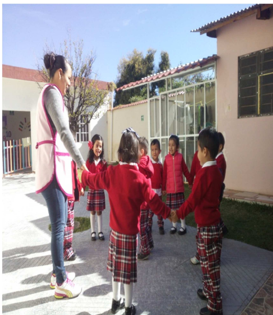
Explicación de la actividad.

Evaluación: Se cumplió el objetivo en un 97% los pequeños lograron aprender el canto y respetaron reglas y turnos, el 3% no se logró.