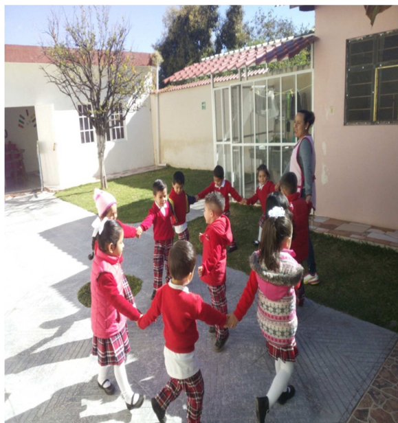
Jugando a El Pato.