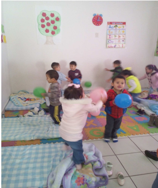
Los pequeños realizando el juego.

Evaluación: El objetivo del juego fue que los alumnos compartieran el globo en un 97% se logró, el 3% no se logró.