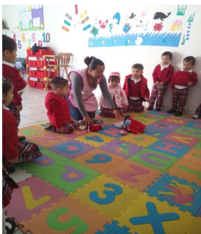
Indicaciones del juego.

Evaluación: El objetivo del juego se logró un 97% los pequeños conviven se respetan y respetan reglas y turnos, el 3% no se logró.