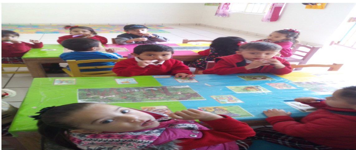
Cepillado de dientes.