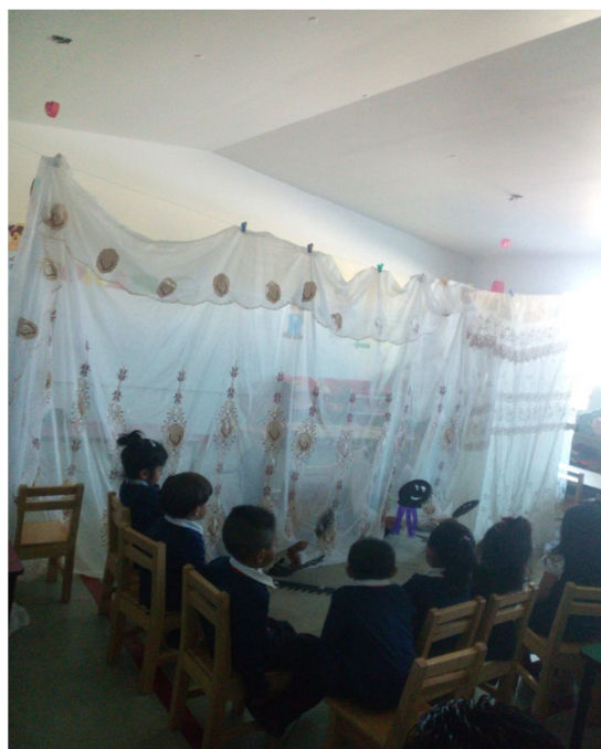
Todos atentos en la función.