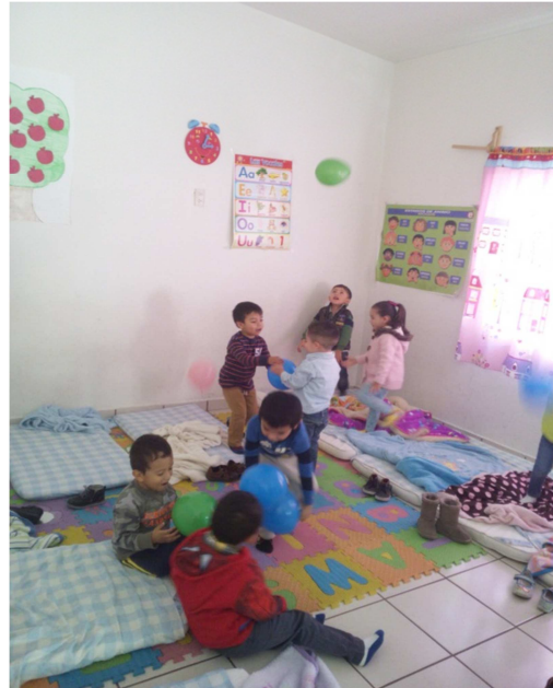
Compartiendo el globo.