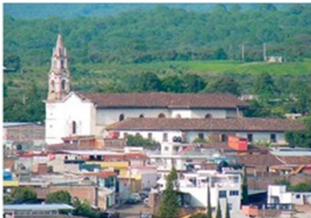
Vista panorámica de Peribán.