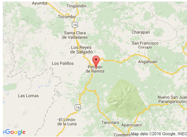
Mapa de ubicación de Peribán de Ramos Michoacán.