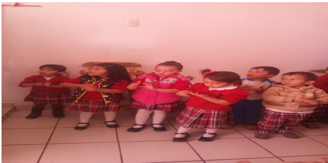
Lavado de manos.