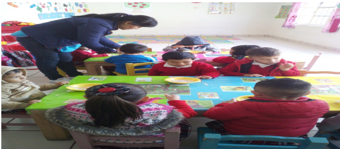
La hora del desayuno.