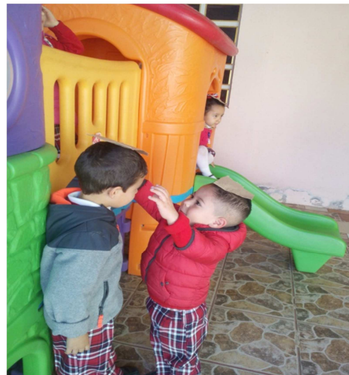
El alumno ayudando a su compañero.