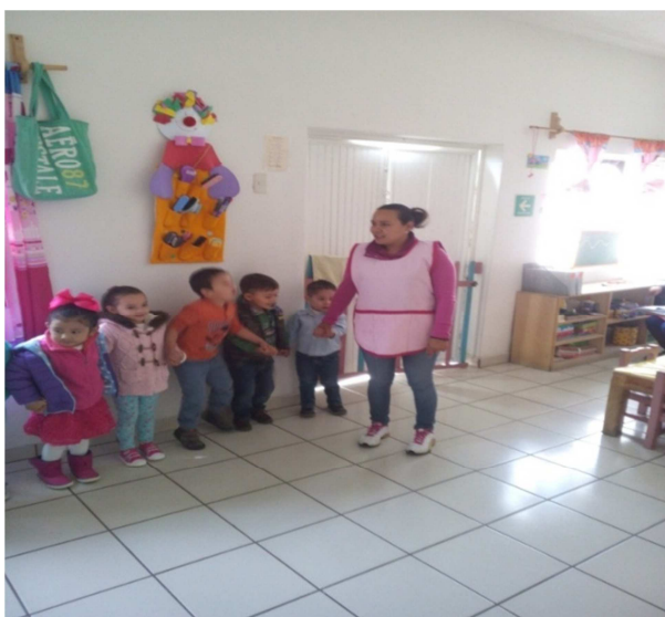
Integrando a los alumnos.

Evaluación: El objetivo del juego se logró en un 97% los alumnos conviven y se respetan más. El 3% sigue en proceso.