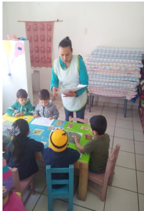
Repartiendo la hoja para decorarla.