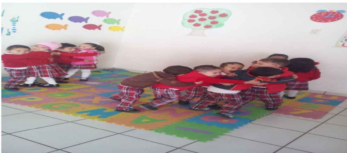
Los alumnos expresando el valor de la amistad.

Evaluación: El objetivo se logró en un 95%, los alumnos lograron aprender el valor de la amistad, el 5% no se logró.