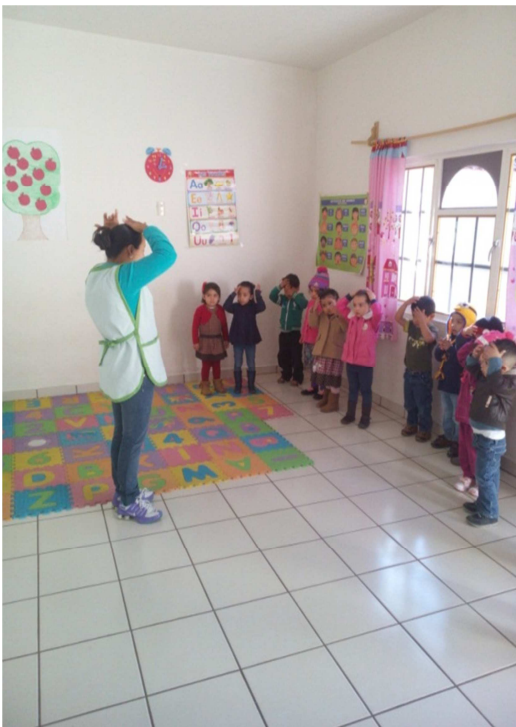
Explicando el juego.

Evaluación: La actividad se logró en un 95% los alumnos lograron expresar sus sentimiento. Y el 5% no se logró.