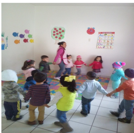
Jugando al tren.

Evaluación: El objetivo se logró en un 98% los pequeños aprendieron el canto, respetaron reglas y turnos, conviven más entre ellos. El 2% no se logró.