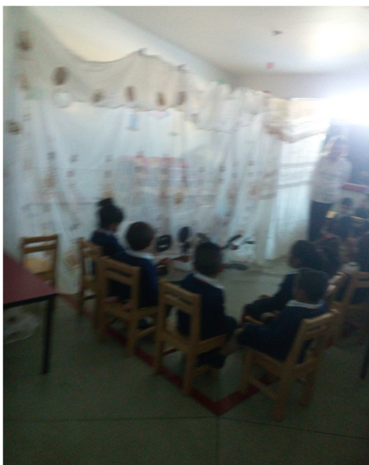
Los niños en la función.

Evaluación: El objetivo se logró en un 98% los alumnos lograron trabajar en equipo y el 2% no se logró.