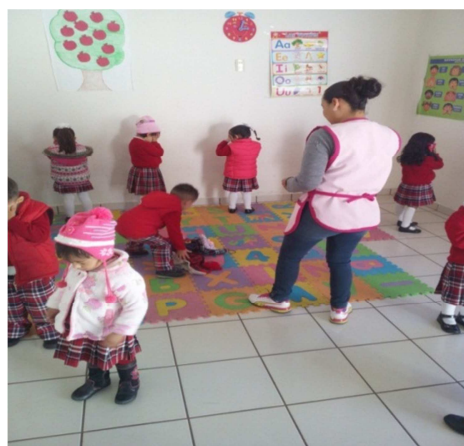
El niño tomando un objeto para esconderlo.