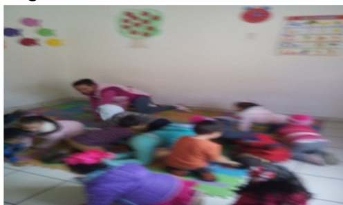
Gateando en el salón.