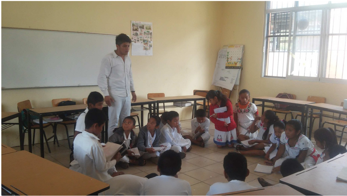
Escuchando ejemplos de tratos solamente de palabra

Después de haber escuchado las participaciones de los alumnos, se les habló sobre lo que significa el valor de la palabra, y sobre su evolución que ha tenido en el transcurso del tiempo, porque la palabra como tal le da un significado a la existencia del ser humano. Posteriormente los alumnos formaron dos equipos para organizar algunas preguntas que harían a personas de su localidad, un primer grupo cuestionaría a personas jóvenes y el segundo a las personas de mayor edad, con el fin de saber la evolución que ha tenido el valor de la palabra.