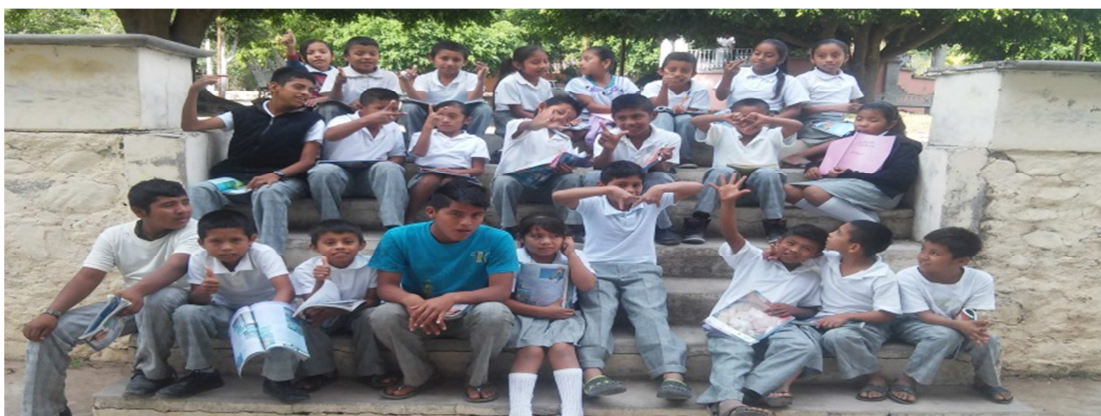
El grupo con el que se hace el trabajo

Luego entonces lo que buscamos con este trabajo es poder hacer una revaloración con los alumnos, intentando que se sigan promoviendo y se lleven a la práctica de manera voluntaria, considerando que es para beneficiar a la población en general, no para perjudicarla. Razón por la que en estas actividades el papel de nosotros los profesores es muy importante, porque a los alumnos cuando se les encausa de manera positiva, los resultados también son positivos.