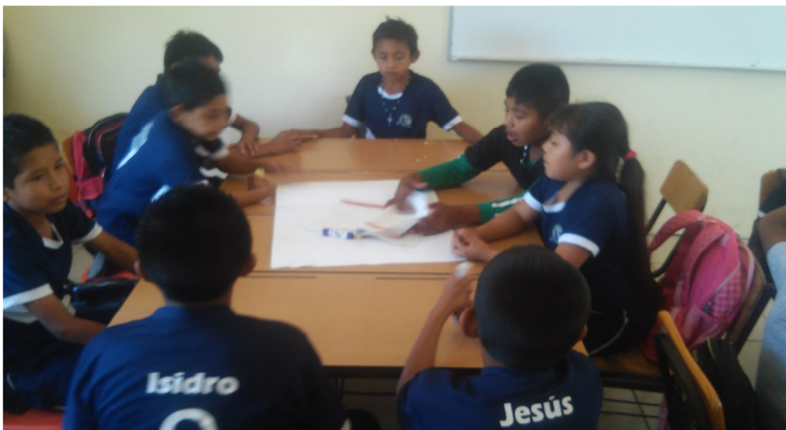
Resolviendo el problema de manera cooperativa

Para clarificar un poco más el trabajo cooperativo, se les entrego un crucigrama para que de manera cooperativa lo resolvieran los alumnos opinando y apoyándose tratando de resolver el problema de la mejor manera con opiniones y sugerencias de todos. Este tipo de trabajos o actividades les deja en claro a los alumnos que el trabajo cooperativo, es la herramienta más adecuada para poder realizar las cosas dependiendo de la situación.