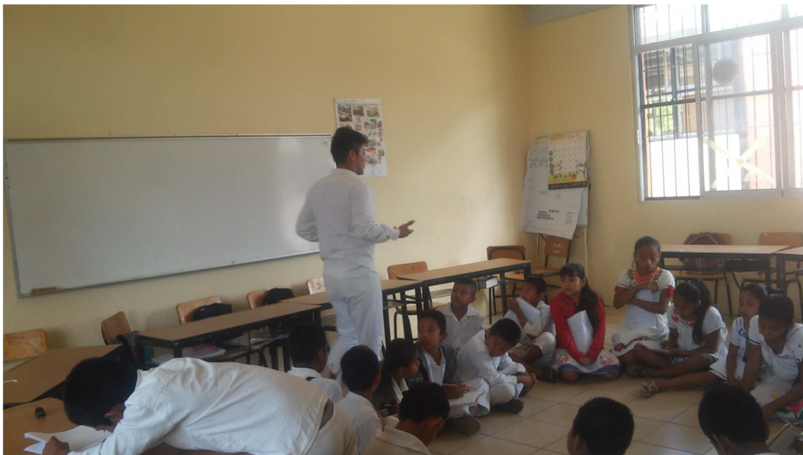
Promoviendo el uso de la lengua náhuatl