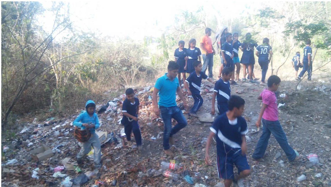
Haciendo el recorrido a los lugares contaminados

Se realizó con los alumnos una pequeña dinámica, después se les realizó un cuestionario donde contestaron preguntas relacionadas con la naturaleza, luego llevamos a cabo el análisis sobre el trato a la naturaleza que se les da en la localidad de Pómaro, cuando cada alumno dio su punto de vista sobre el trato a la naturaleza en su comunidad, buscamos los lugares con más daño a la naturaleza para llevar a cabo una pequeña reflexión sobre el daño que se le está causando.