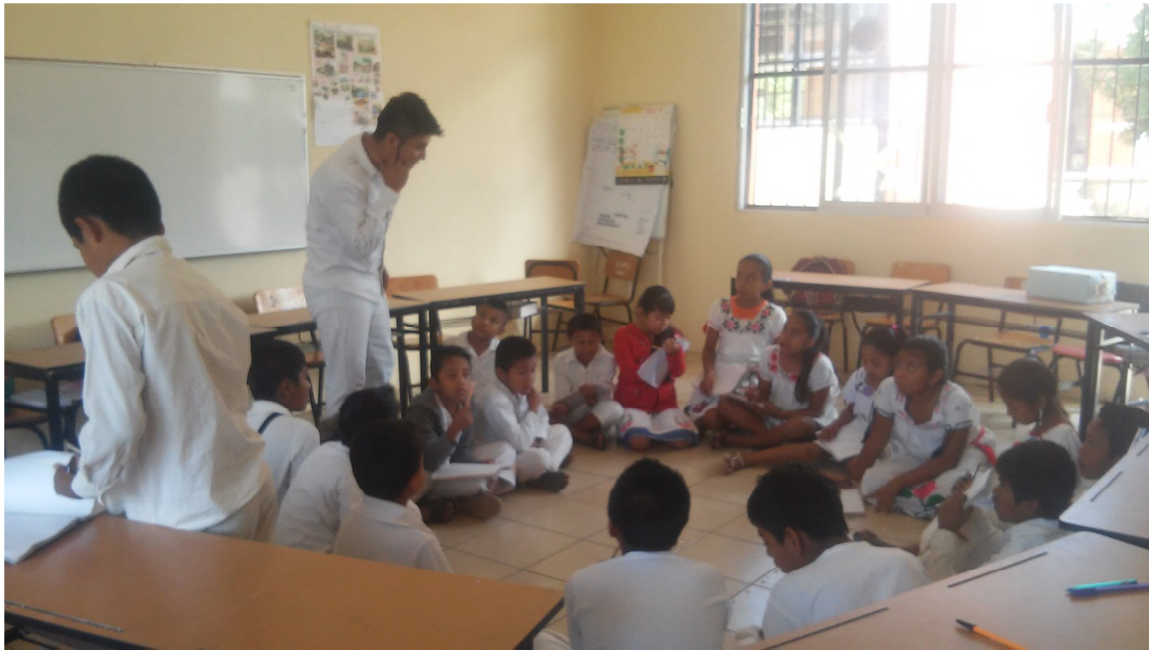
Comunicándose a través de la lengua náhuatl

Al término de la actividad, se les pidió que evaluaran el desempeño del grupo en general en el desarrollo de cada una de las actividades, considerando que la forma en que se trabajó con los alumnos, fue una forma aceptada por ellos mismos, porque ellos fueron los protagonistas principales.