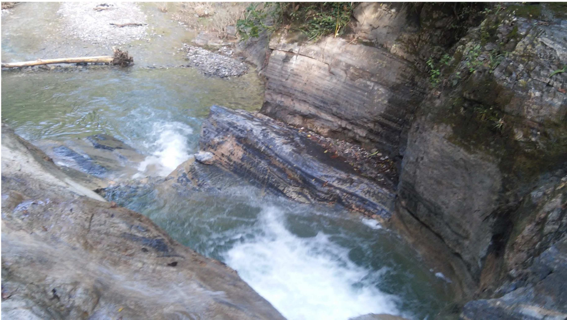
Espacios contaminados donde se debe hacer faena