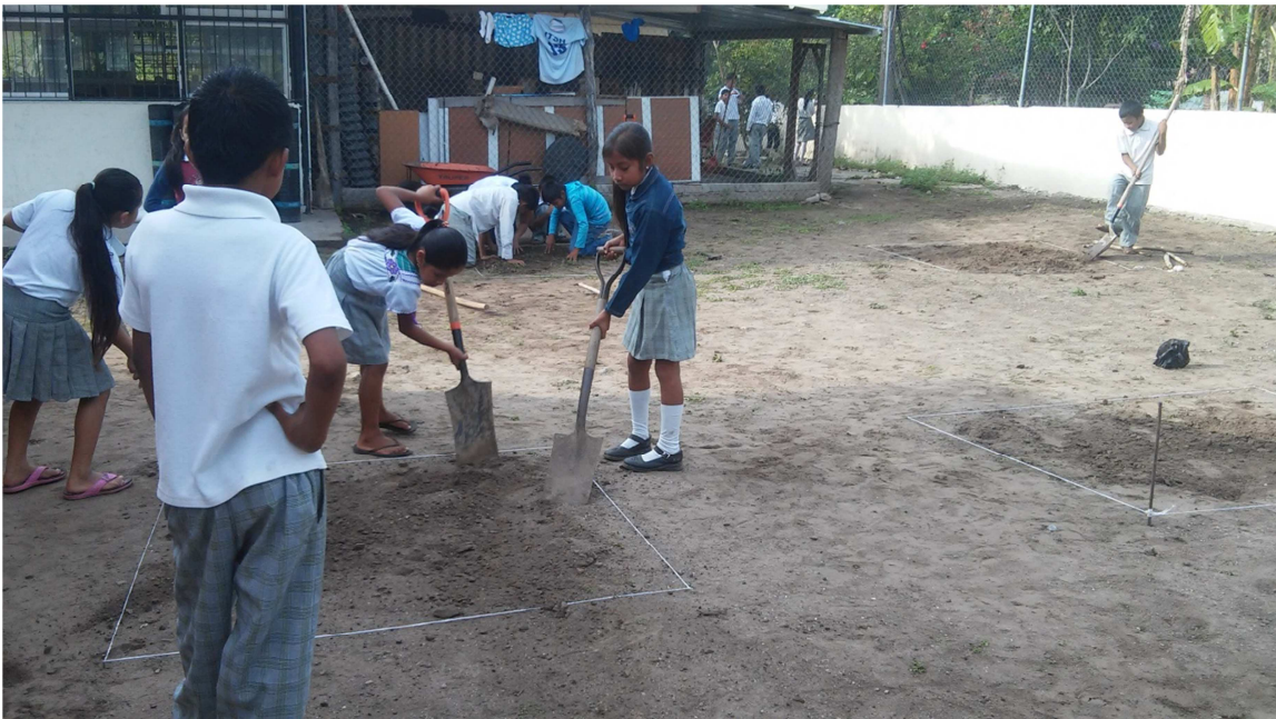
Promoviendo la reforestación