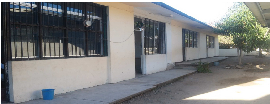
Escuela primaria Bilingüe Cuauhtémoc.

aulas, hay 2 sanitarios, no existe aula de medios, pero si cuenta con un espacio suficiente donde los alumnos juegan a la hora del recreo.