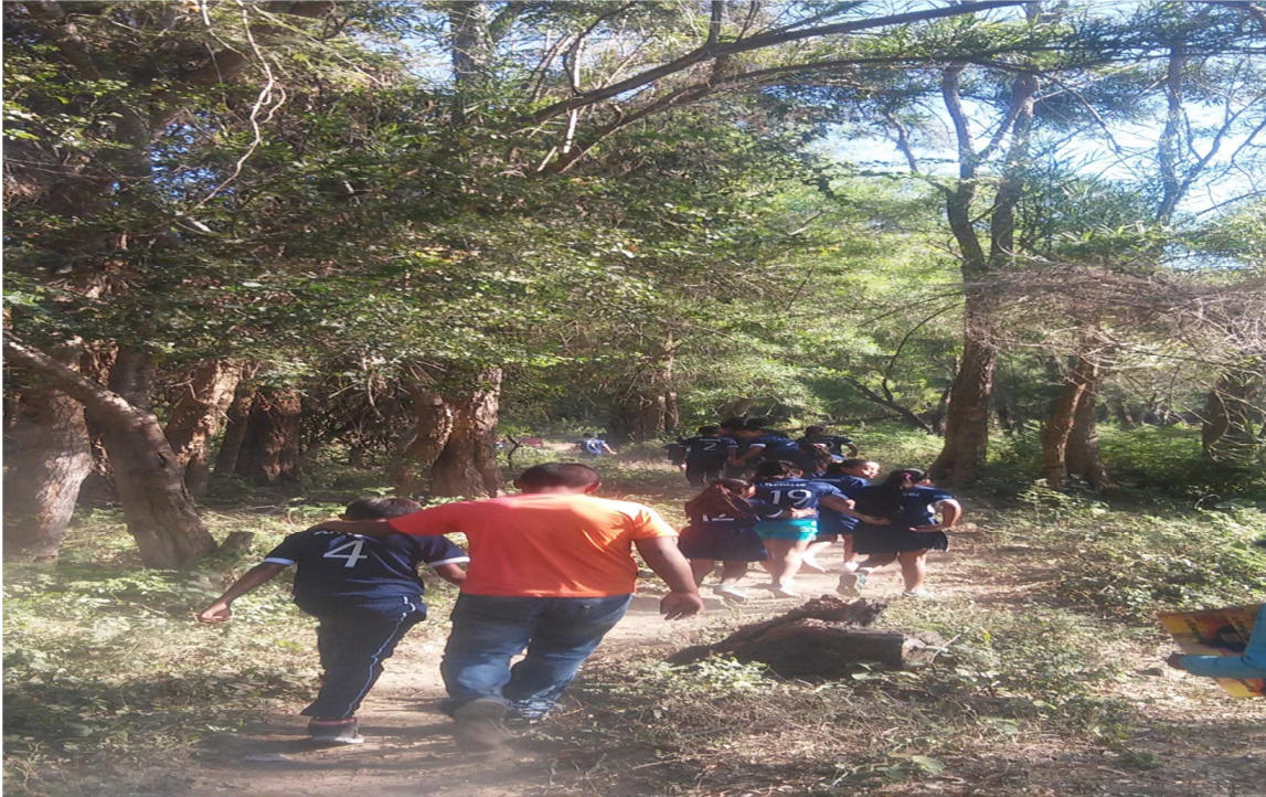
Haciendo un recorrido buscando lugares contaminados