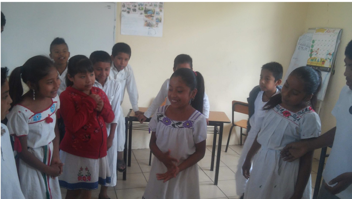
Conversando sobre las faenas que se hacen en la comunidad

Una vez entendiendo el significado del tema, los alumnos formaron un círculo para comentar los tipos de faenas que se realizan en su localidad. También se platicó cual institución era la que promovía más este tipo de acciones y quienes eran los que las coordinaban; coincidiendo en que quienes utilizaban este tipo de acciones conocidas como faenas, era el centro de salud de su localidad.