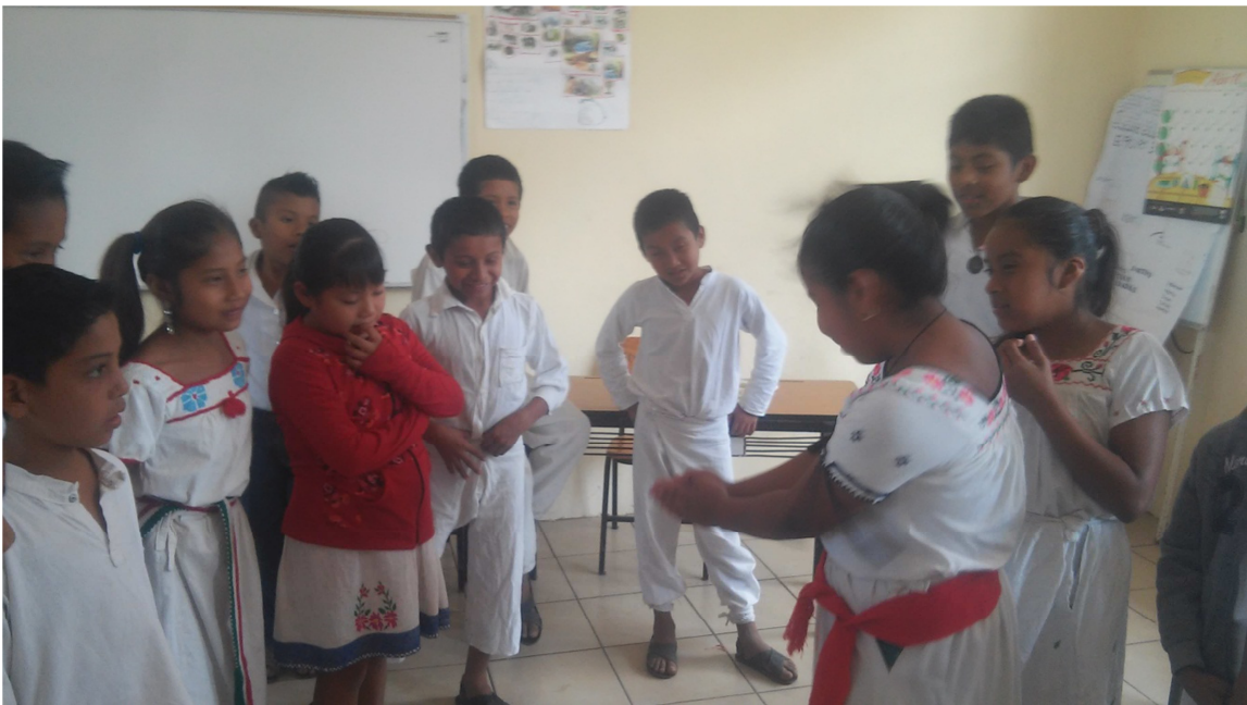
Escuchando algunos ejemplos sobre el valor de la palabra