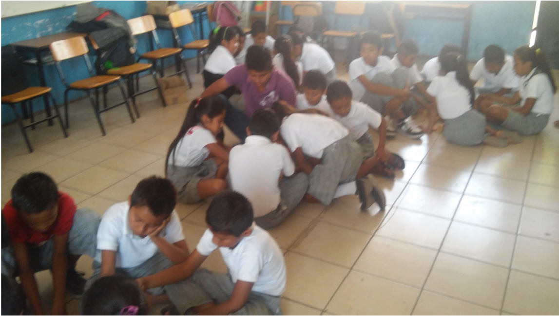
Promoviendo en equipo el uso de la lengua náhuatl

Esta actividad fue muy interesante y divertida, porque la mayoría de los alumnos hablan muy bien la lengua náhuatl. Debo decir que aprendí mucho durante el desarrollo de las actividades porque de manera voluntaria lo hacían con gusto los alumnos demostrando que ellos sí saben hablar en su lengua materna, además me quedó claro que se sienten orgullosos de poder hacerlo.