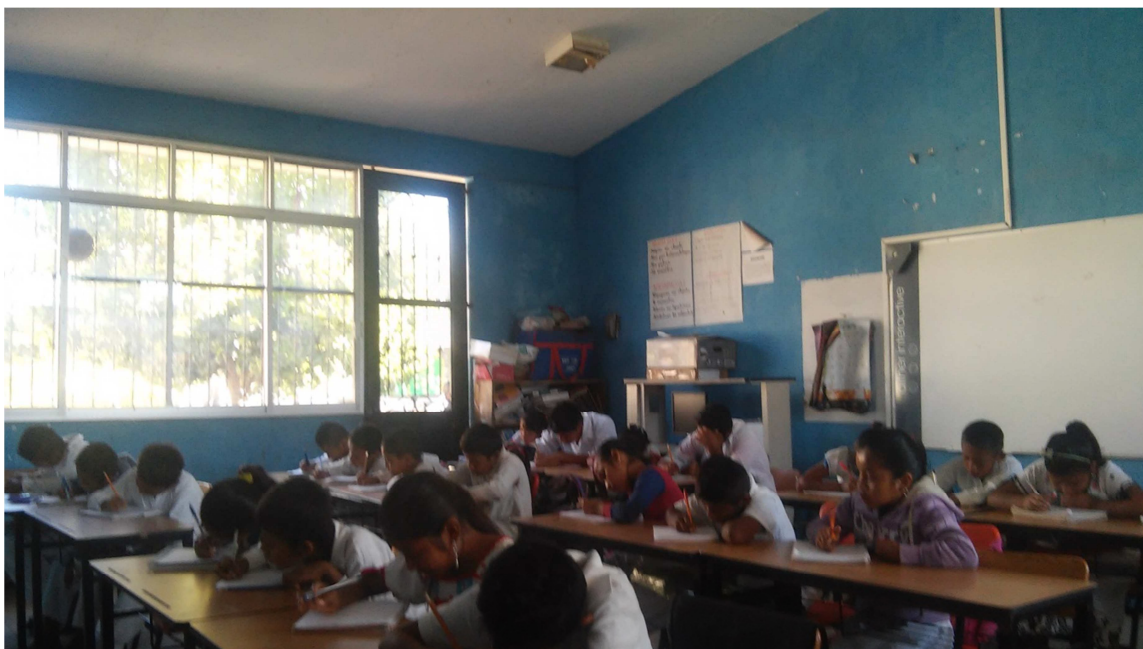
Dibujando lo que vieron en el recorrido

Posteriormente se les pidió a los alumnos que dibujaran lo que habían observado en el recorrido sobre los lugares contaminados; así como de las acciones que han hecho las personas para el cuidado de su medio natural. Este valor del cuidado de la naturaleza lo tienen muy claro, algunos niños comentaban que sus papás cortaban la madera en luna sazona para que no se pudriera rápido y durara un poco más. También se prohíba cortar los árboles cerca de los nacederos de agua, a los que les gusta la cacería se les prohíbe matar hembras etc.