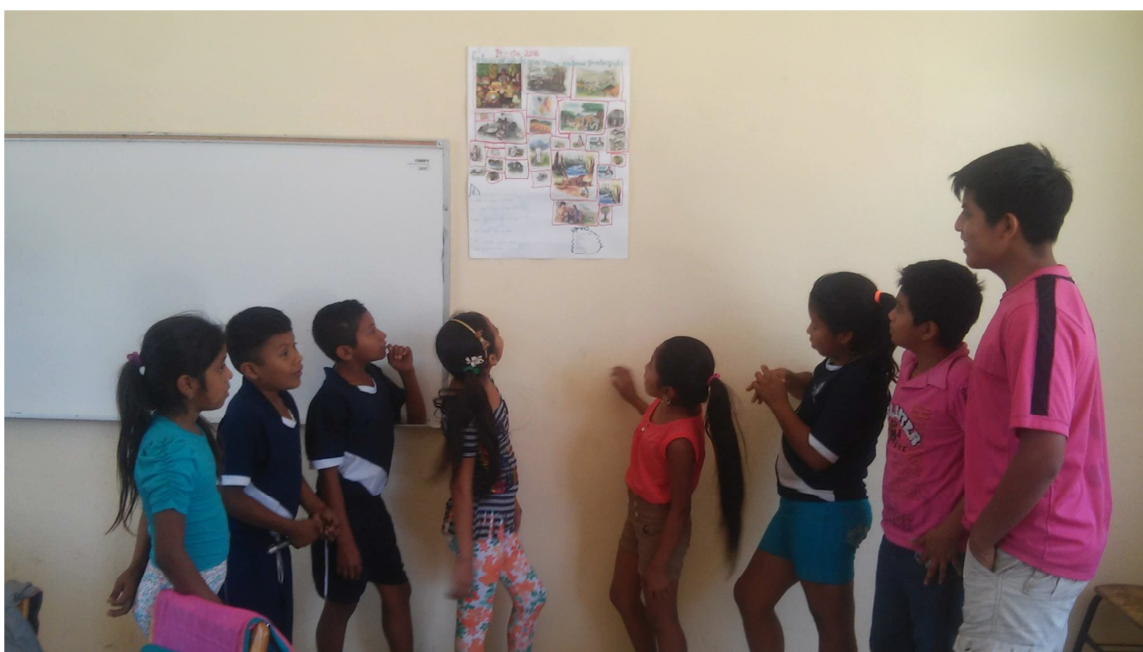
Revisando el mural

Después de haber realizado los dibujos con su respectiva descripción, se hizo un pequeño mural elaborado por ellos mismos con las imágenes de las faenas que se trabajan en la comunidad, para poder dar testimonio de que efectivamente este valor o saber comunitario aún sigue vigente en esta comunidad indígena de Pómaro.