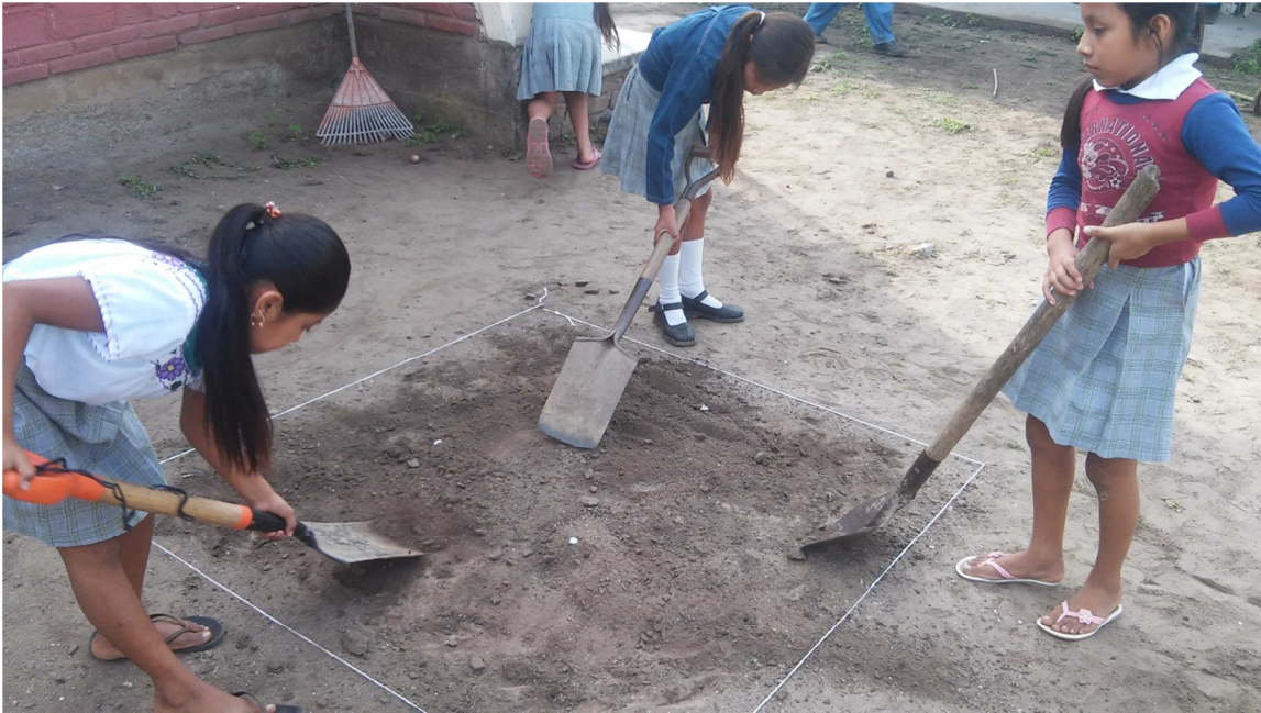
Los alumnos promoviendo la reforestación