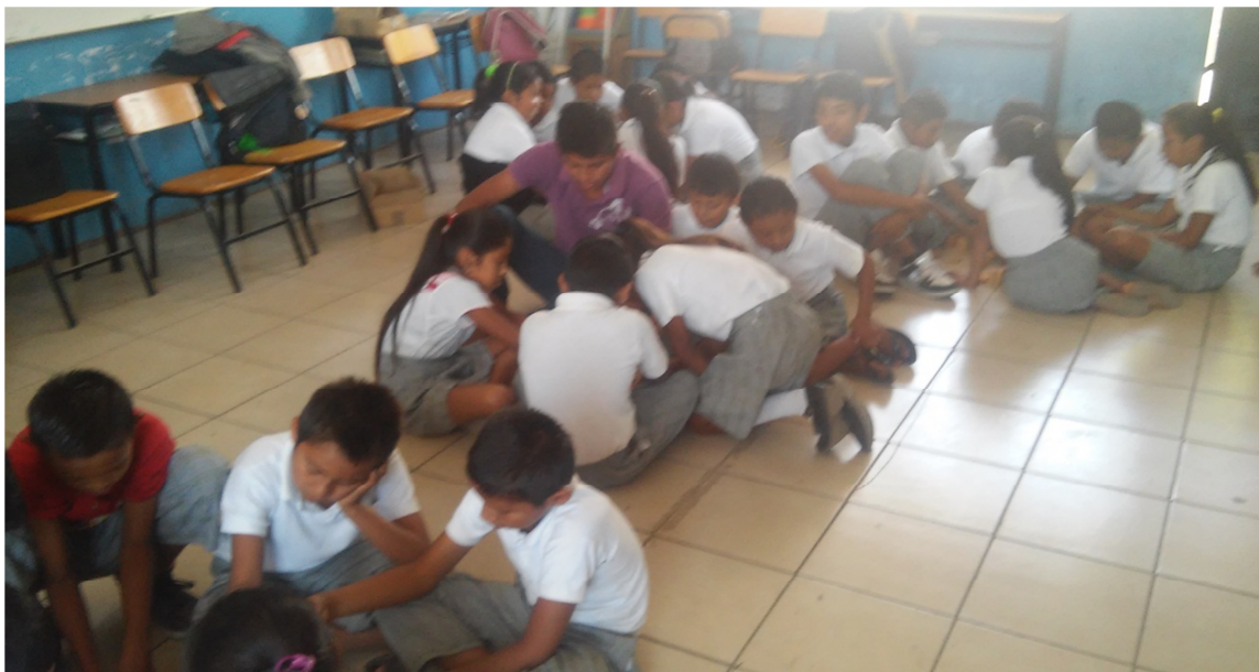
Promoviendo el trabajo cooperativo