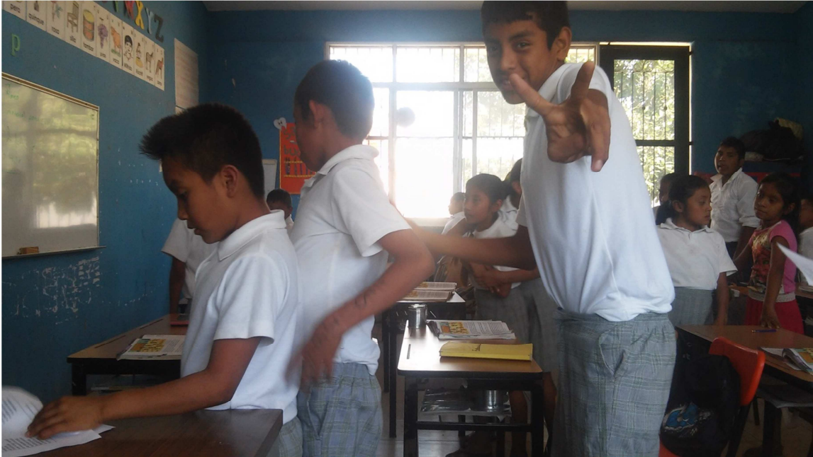
Promoviendo el valor de la palabra