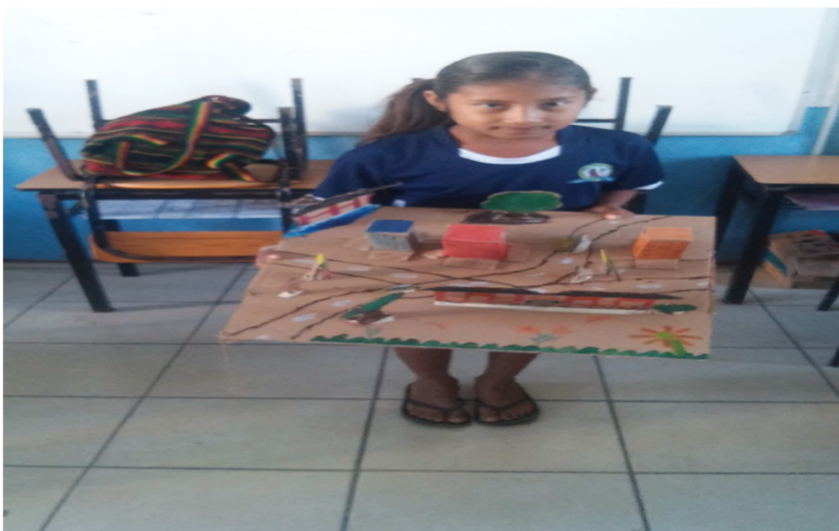
Una maqueta producto del trabajo cooperativo