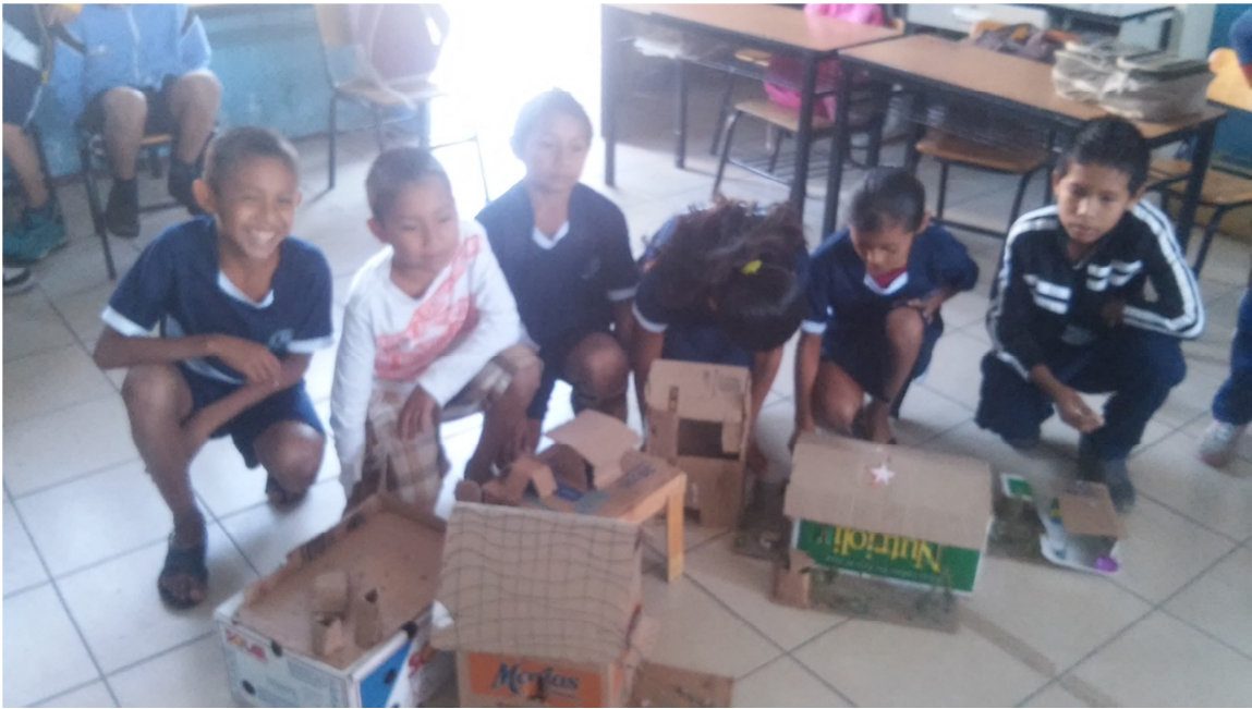
Algunos productos del trabajo cooperativo