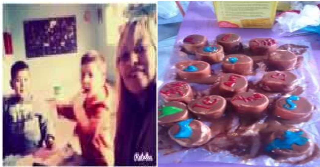
Anexo 11 actividades llevadas a cabo con los educandos, en busca del tesoro.