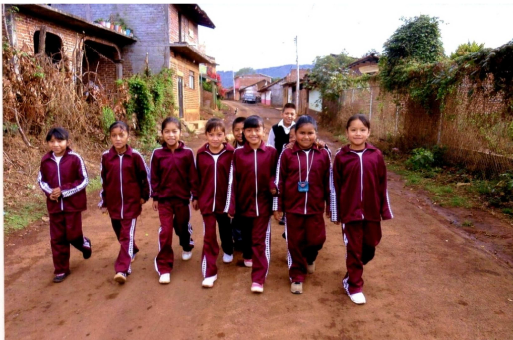
Caminando al ojo de agua