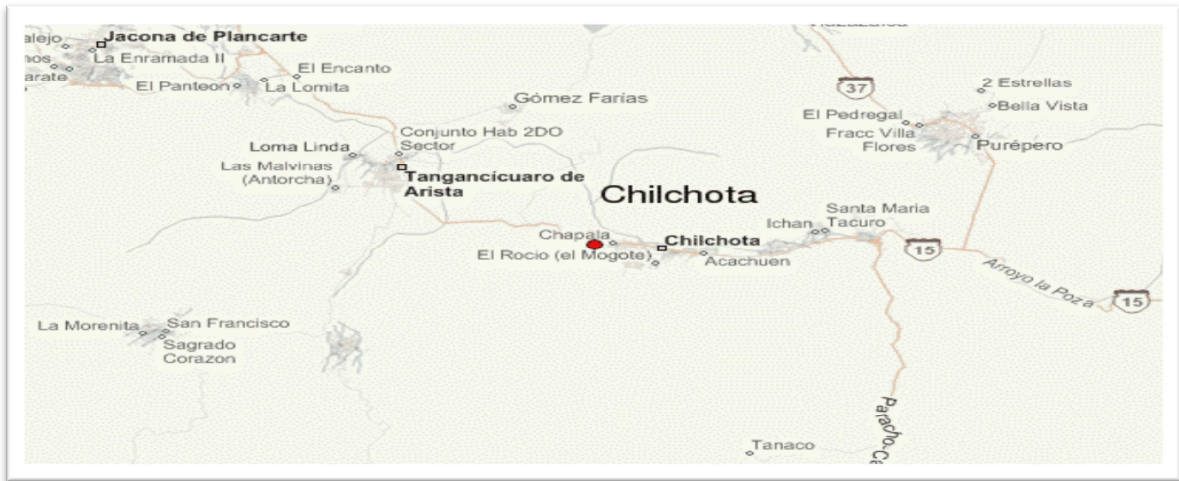
Figura No: 1 Título: Mapa, el municipio de Chilchota

Mapa, el municipio de Chilchota, carta topográfica del INEGI