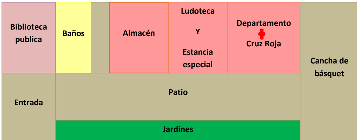
Cuadro No: 2 Título: Croquis de la ludoteca