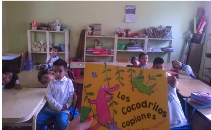
Fotografía 2.- En este momento de la actividad los niños fueron cuestionados sobre la lectura, para evaluarlos y observar si reflexionaron sobre el cuento, se puede observar cómo algunos de los niños están pensando sobre sus ideas del cuento para brindarme sus ideas y comentar sobre ellas, la mayoría de los alumnos fueron participativos.