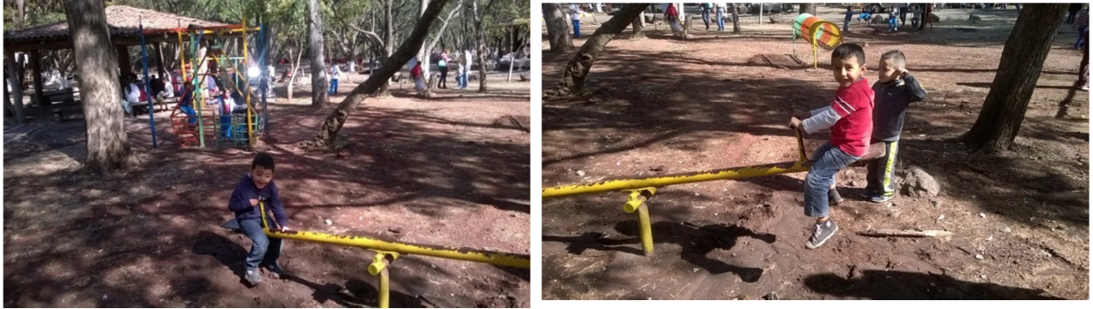
Fotografía 26.- Los niños mostraron disposición al momento de interactuar con sus compañeros, reflejaron sus valores tanto el respeto y tolerancia.