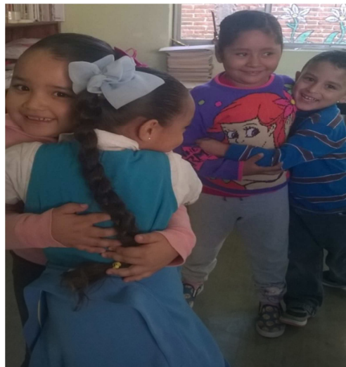
Fotografía 15.- Una foto más sobre el afecto que se tuvieron los niños al momento del juego, coloque esta fotografía debido a que las niñas solían ser las que por pena o por algunas otras situaciones no se integraban con los niños y aquí se observa que ya ahora se relacionan entre sí con menor desapego.