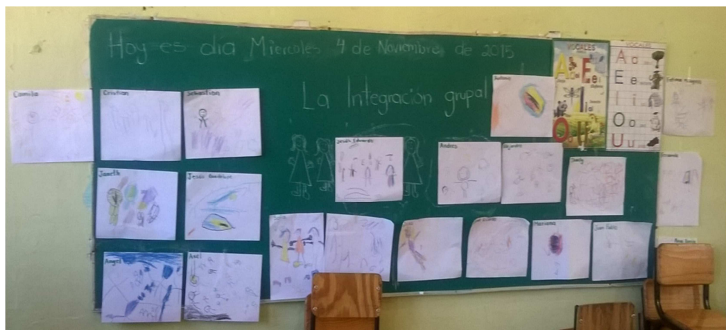
Fotografía 6.- En esta fotografía se pueden observar todos sus dibujos de cada uno de los niños, en cuales la mayoría lograron el propósito de la actividad, demostrar sobre la importancia de estar en buena convivencia.

Realicé esta actividad por el hecho de observa que tanto han adquirido sobre el tema de la integración, por la situación de que algunos de los niños no han logrado adquirir cierto interés sobre este tema, al igual para que mediante sus dibujos