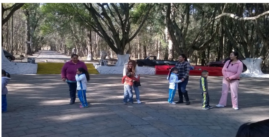
Fotografía 25.- En esta fotografía se observa la participación de los niños y madres de familia al aplicar juegos donde se involucra su afecto así su hijo, el niño se sentía así más seguro de sí mismo.

Mediante la realización de los juegos con padre e hijo observé que los niños les ayudo demasiado debido a que se divertieron mucho y todos participaron de una manera eficaz sin problemas algunos, fue un momento agradable para los padres de familia y sus hijos, al momento de compartir los alimentos los niños están ya muy entusiasmados y acudían mejor a los juegos ahí fue donde mostraron buena disposición jugaron en conjunto, se iban de un lugar a otro se sentían libres y contentos, identifique que la mayoría de los niños estuvieron integrados al momento de jugar.