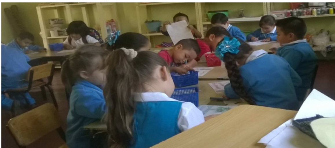
Fotografía 4.- En esta fotografía se puede observar la manera en que los niños se encuentran haciendo sus dibujos sobre la integración grupal, en este momento observé

Mediante la actividad observé que los niños lograron realizar sus dibujos en relación al tema, solo algunos pocos se guiaron sobre la integración de su familia pero al igual aproveché eso también para que fuese más aun entendible sobre la importancia de la integración, el grupo comenzó a vincular la relación y convivencia que hay en su familia y a partir de ahí los oriente para que también reflejaran eso hacia sus compañeros de grupo.