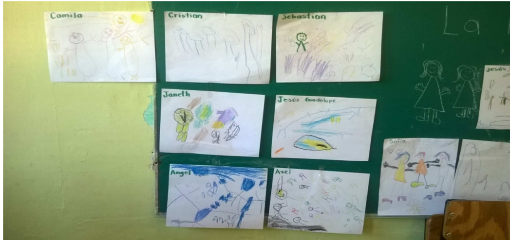
Fotografía 5.- Estos son los dibujos que realizaron los niños en relación a la integración grupal, reflejaron en ellos a sus compañeros en convivencia y no apartados del resto.

que los niños trabajaban de una manera colectiva debido a que platicaban entre sí con sus compañeros sobre sus creaciones, así pues trabajaron de manera individual y colectivamente.