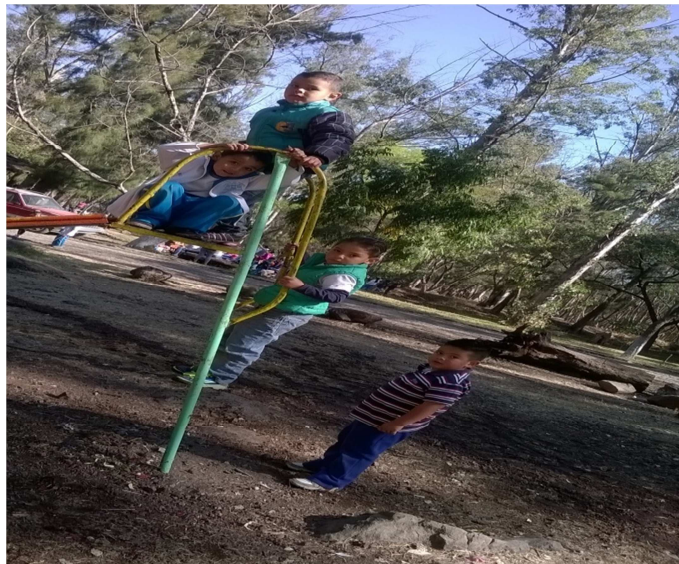
Fotografía 27.- En esta fotografía se encuentran dos niños que no solían integrarse con sus compañeros y a la hora de esta actividad, por si solos de involucraron en los juegos.

Los niños no se integraban en las actividades grupales, se presentaban en ellos malos comportamientos debido a que no sabían convivir de una manera eficaz, no se respetaban entre si y surgía la desintegración en el grupo, se despartaban, por ello se preparó este tipo de juegos, donde los niños participaran adecuadamente, gracias a esta actividad que se aplicó se presentó un cambio en ellos debido a que hubo logros y desaparecieron los malos comportamientos.