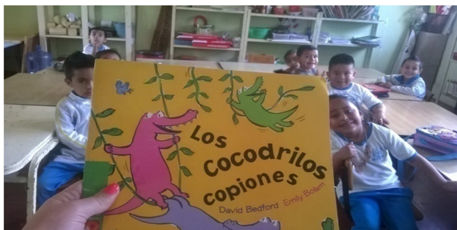
Fotografía 1.- Este fue el libro de textos que fue presentado para los niños mediante la lectura dentro de aula.