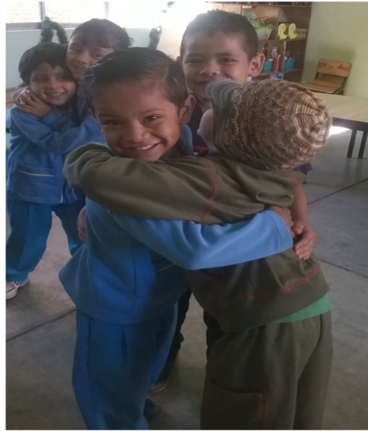
Fotografía 14.- Así fue el afecto que se promovieron los niños al momento de darse su abrazo al termino de la melodía que era cuando lo hacían, mientras sonaba la música ellos bailaban y lo hacían en parejas no lo hicieron solos, participaron con forme a los valores del respeto y tolerancia no hubo dificultades para la relación entre ellos.