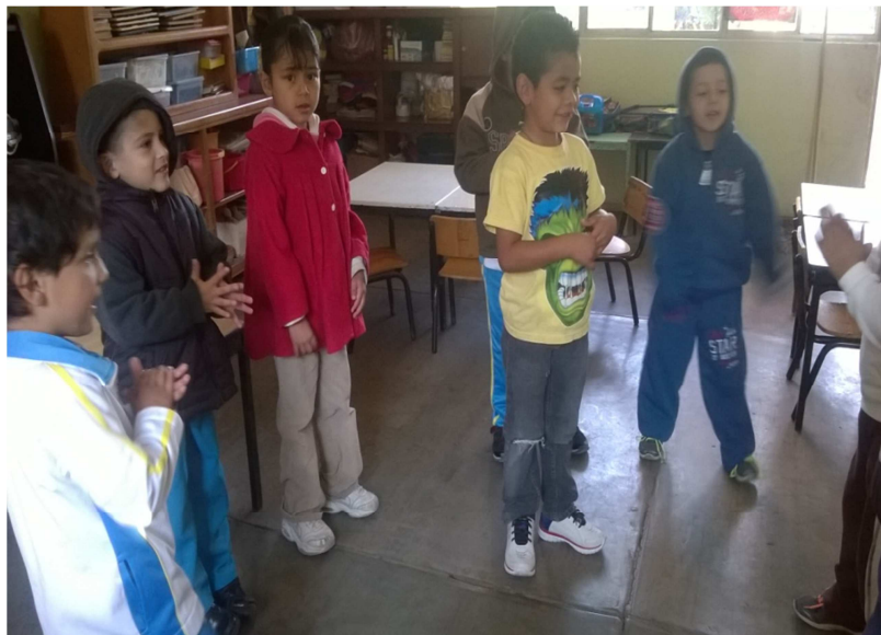
Fotografía 11.- Esta fotografía es similar a la anterior debido a que no se me prestó el tiempo para tomar más fotografías, en esta se puede observar que se fueron involucrando más niños los cuales al principio no quería participar.