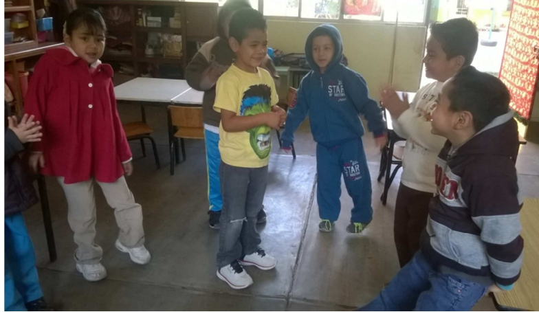
Fotografía 10.- En esta fotografía se muestra el comienzo del juego llamado el Avión, se formo un círculo dentro del salón del aula y se comenzó a cantar utilizando nuestras palmas, fue pasando cada uno de los niños al momento que escuchaba su nombre, observé que de un principio había un poco de timidez pero poco a poco los niños se fueron involucrando en el juego.

circulo que se realizó, en si los niños aportaron buenos comportamientos al momento del juego relacionando entre sí.