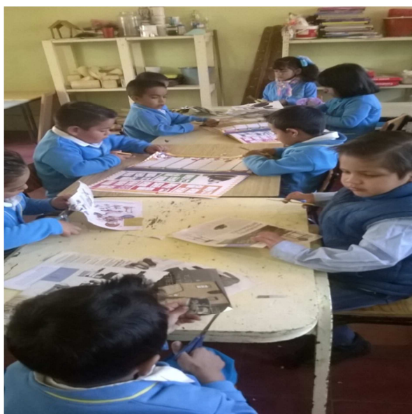
Figura 8: En esta otra fotografía los demás equipos estuvieron interactuando entre sí en la búsqueda de sus mejores imágenes para la elaboración del mural, al igual fueron muy cuidadosos al momento de cuidar sus recortes.