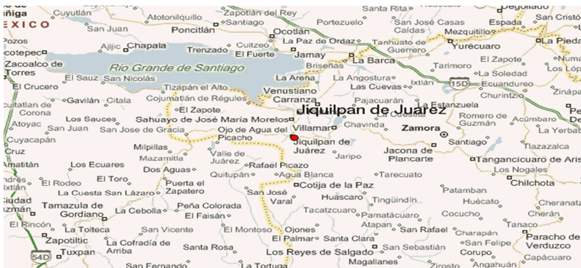
Mapa 1. Jiquilpan Michoacán

Su clima es templado, con veranos cálidos y precipitaciones de junio a septiembre. Es un corredor comercial, agrícola y ganadero. Entre sus productos agrícolas está el maíz, frijol, trigo, cebada y garbanzo. Se elaboran productos derivados de la leche.