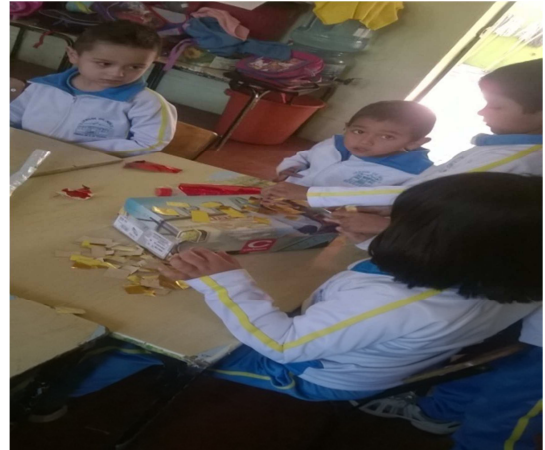
Fotografía 23.- aquí se refleja la disposición que tuvieron los niños para la construcción de los instrumentos musicales, no se presentó ningún inconveniente, se apoyaron entre sí y se daban sugerencias a otros.