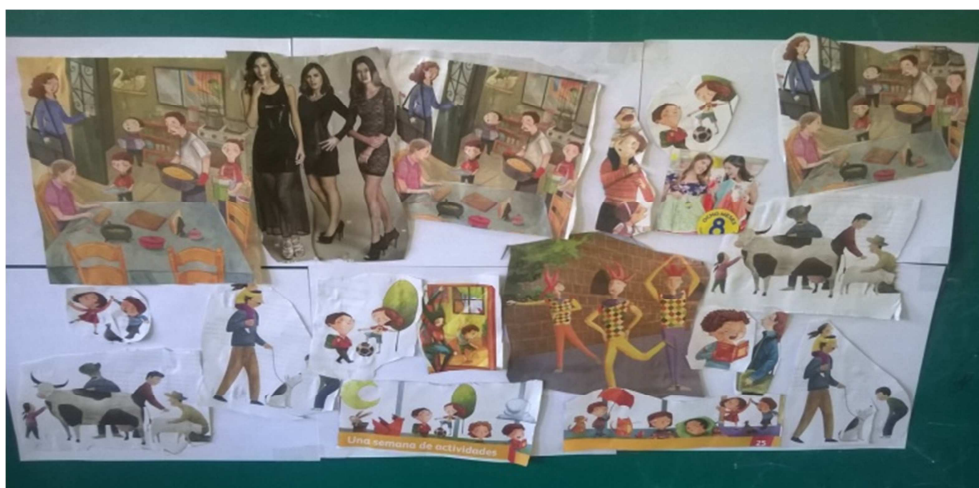
Figura 9.- En esta fotografía solo se puede observar el cómo les quedó a los niños su mural, el hecho de que no salgan los niños fue debido a que les tuve que ayudar a realizarlo y no se me dio la oportunidad de tomarles a los niños.